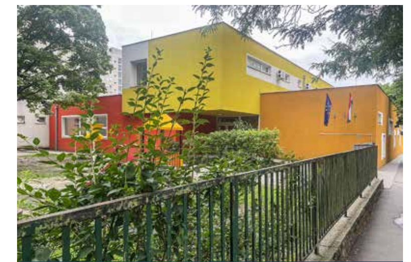
Az Arany Óvodában lesz az új intézmény székhelye

tens, 24 gyógypedagógiai asszisztens, 12,5 karbantartó/kertész/fűtő, 20 gondozónő/takarítónő, 1 informatikus). Vinczek György alpolgármester kérdésünkre elmondta: az óvodák maradnak a helyükön, a pedagógiai programok sem változnak, sőt arra lehet számítani, hogy az a sok jó kezdeményezés, amely egy-egy óvodában megvolt – például a fejlesztések, az SNI-s gyerme-