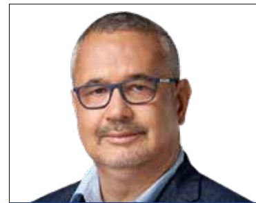
ARATÓ GERGELY országgyűlési képviselő (DK)