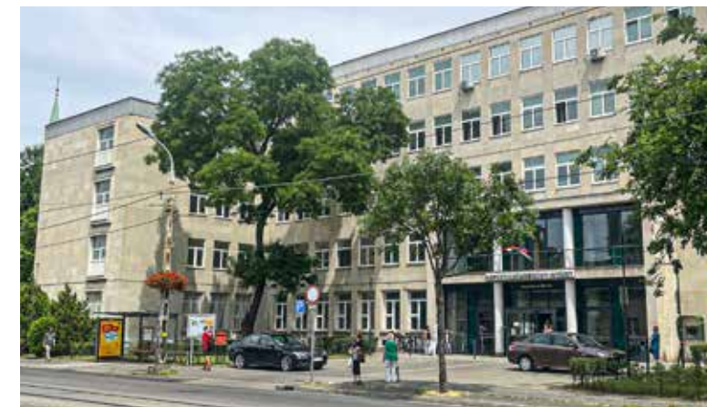
A szakrendelő látja el a helyettesítést

Országos jelenség a házi orvosok számának csökkenése, a tendencia Kispesten is gondokat okoz. A képviselő-testület júniusban tárgyalta a betöltetlen házi orvosi körzetek felosztására irányuló kezdeményezést.