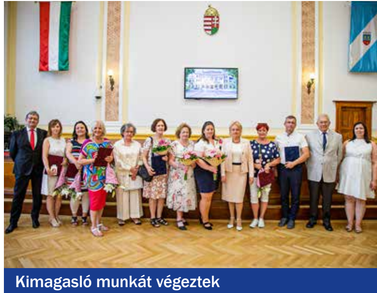
Kimagasló munkát végeztek