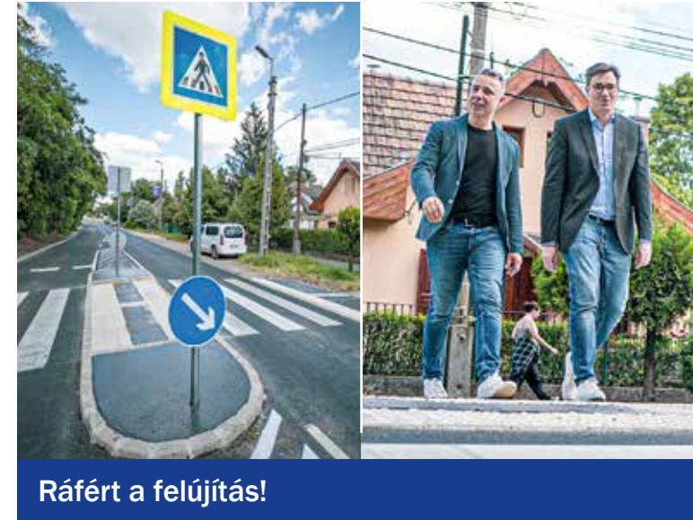
Ráfért a felújítás!

A tervezettnél korábban, már június végére elkészült a Budapest Közút Zrt. a Határ úti útszakasz aszfaltozásával.