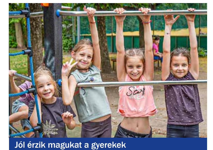
Jól érzik magukat a gyerekek

akik a tanév során is fizetnek a menzáért, a többieknek ez is kedvezményes vagy ingyenes. Az önkormányzat összesen csaknem 20 millió forintot költ a táboroztatásra. A jelentkezők és az itt lévők 77 százaléka alsó tagozatos kisgyerek, a többiek ennél idősebbek, ezért a programokat is ehhez a korosztályhoz igazítottuk – mesélte a tábori programokat koordináló Wekerlei Kultúrház tagintéz-