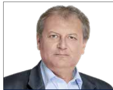
DR. HILLER ISTVÁN országgyűlési képviselő (MSZP)