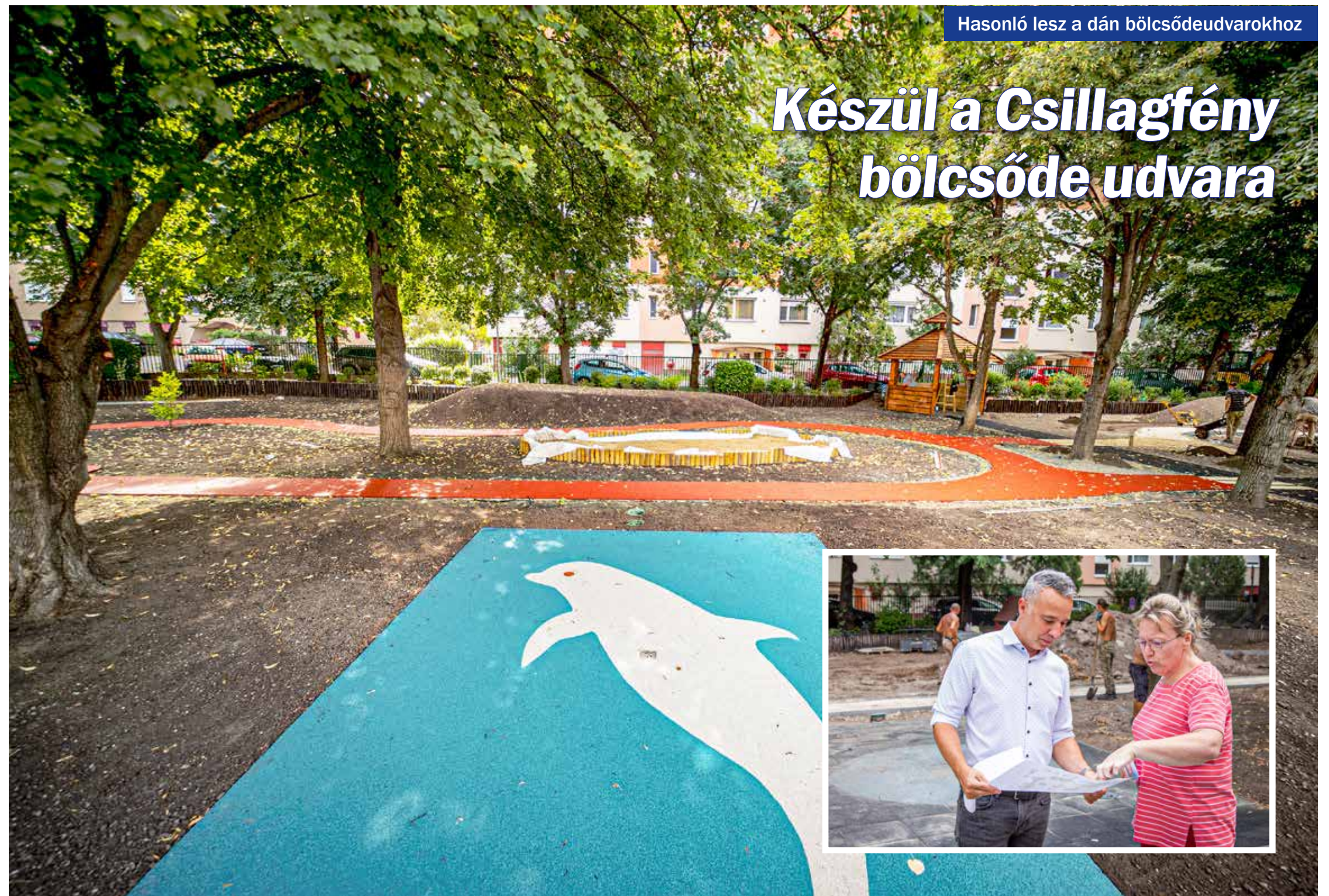
Hasonló lesz a dán bölcsődeudvarokhoz