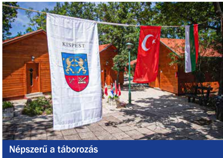
Népszerű a táborozás