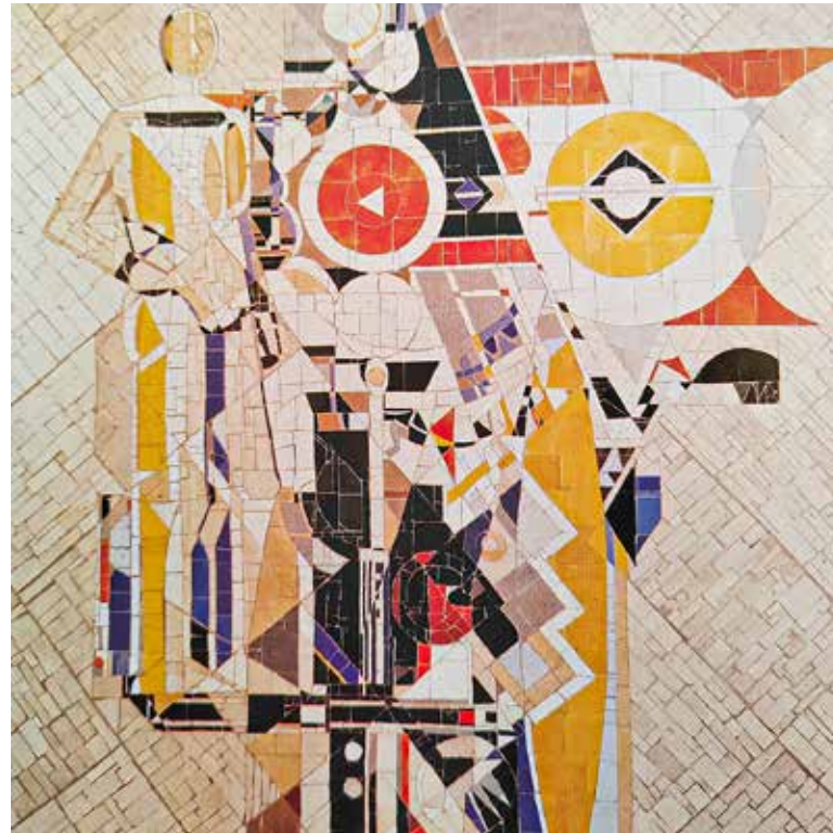
Mozaik, 1968 (Muralia Hungaricana, mai magyar épületdíszítő művészet, Helikon, 1978)

A Népszava 1968. augusztus 18-án adott hírt a Vörös Csillag Traktorgyár Művelődési Ház akkori felújítását követő megnyitásáraól.