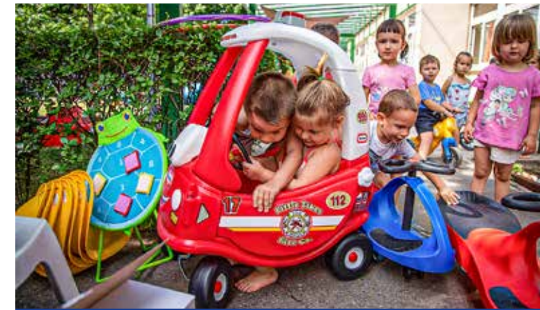
Örültek a gyerekek

Félmillió forint értékben kaptak játéksomagot az önkormányzattól a kispesti bölcsődék.