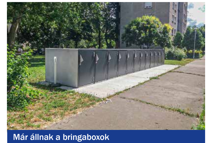
Már állnak a bringaboxok

kai utca, Toldy utca és Árpád utca) már állnak a zárható kerékpártárolók. Ezeknél szeptember harmadik hetének hétfőjén, 17–19 óráig a Bringás reggelihez hasonló tájékoztató programokat tart az önkormányzat, majd szeptember 4. hetének hétfőjétől a kispeszt.hu oldalon regisztrációs felület nyílik azok számára, akik jelentkezni szeretnének a tárolókra. Közülük a bringatároló 500 méteres sugarú körében lakók lesznek előnyben – tájékoztatta lapunkat Varga Attila alpolgármester.