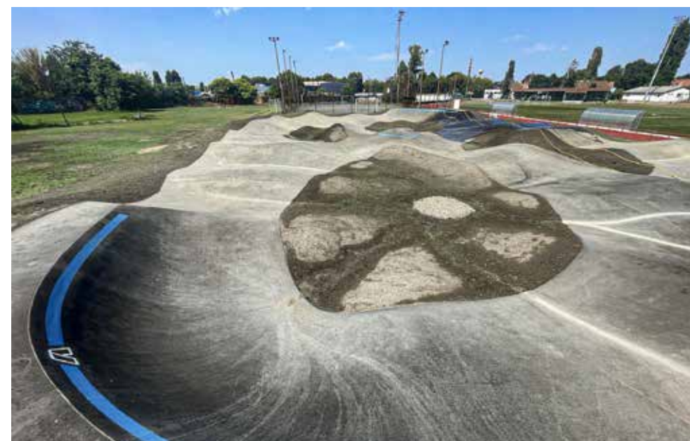
Edzések, versenyek helyszíne lehet

A kerékpárpalya.hu tulajdonosa arról is beszélt, hogy a pumpatrack a kerékpározás egyik újhullámos megfelelője, a BMX crossból alakult ki, ennek edzőpályájaként indult el. Azért pumpapálya a neve, mert pumpáló mozgással tudjuk magukat körbe-körbe hajtani, lendületet tudunk szerezni és megtartani anélkül, hogy tekernénk a biciklit vagy hajtánánk a gördeszkát, a rollert. Ez gyakorlatilag annyit jelent, hogy a hullám lejtőjén egy picit meg kell nyomni a biciklit, és amikor felfelé megyünk a hullám hátoldalán, akkor el kell venni a súlyt róla.