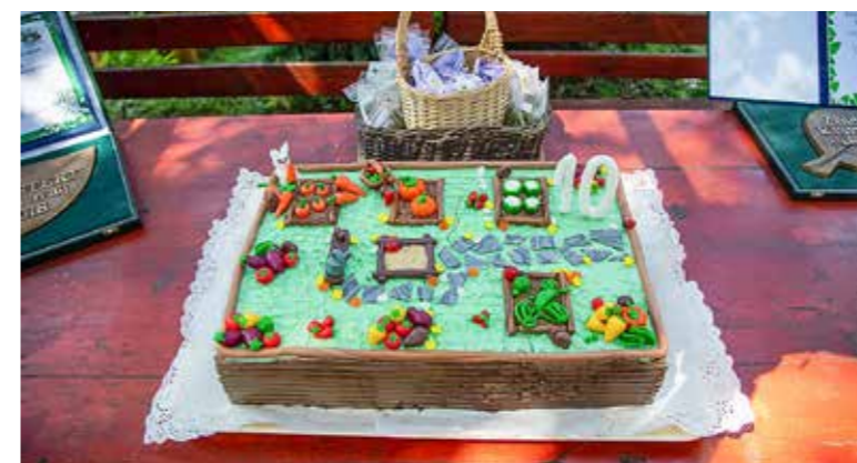
Kiskert a lakótelepen

Kiscest második közösségi kertje 2013. május 18-án nyílt meg. Számos zöldség- és gyümölcsfélével természetnek benne, sokféle virág díszíti a Dobó Katica és Arany János utca mentén, a Forrásház mellett kialakított kertet.