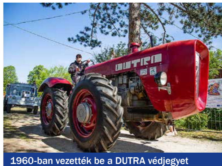
1960-ban vezették be a DUTRA védjegyet

Tizenötödik alkalommal indították be a régi traktorokat és mezőgazdasági gépeket a XVIII. kerületi Hofherr–Dutra Gépmajálison, idén is a XVIII. kerületi Tomory Lajos Múzeum kertjében.