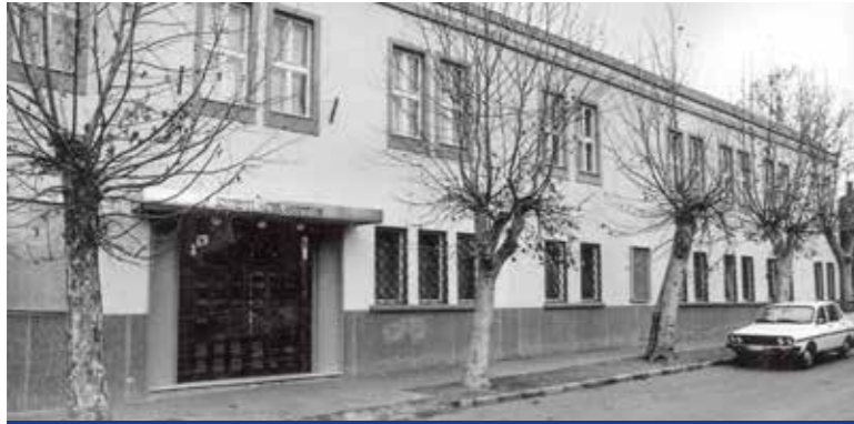
A megújult homlokzat 1985-ben

Az épület bezárása riadalmat keltett az intézmény látogatói és az ott működő csoportok között. Mindenki tudta, hogy az épülettel kezdeni kell valamit. 1981-től már lehetett olvasni arról, hogy fel fogják újítani az intézményt. Az új városközpont tervei között azonban szerepelt egy, a Kossuth téren elhelyezendő modern művelődési otthon terve. A tervet nem vonták vissza, így a kerület lakossága félhetett attól, hogy a Teleki utcai épületet elbontják. Így sokan érezték szükségét annak, hogy a kultúrházat megmentsék, mivel ezáltal már az épület fennmaradása volt a kérdés. Az Erkel Ferenc Kórus Kádár Jánoshoz fordult segítségért. Sem a gyárnak, sem a kerületnek nem volt elegendő forrása arra, hogy az építkezést megindítsa. Partnereket kerestek a felújításhoz, és előzetes kötelezettség-vállalási szerződéseket kötöttek, a támogatói kör tovább bővült. Az építkezésre vállalkozó Diogenész Építész Stúdió 20 millióért vállalta a munkát, de ekkor csak 16 millió forint állt rendelkezésre. Közüggé vált a ház felújítása, magánszemélyek ajánlottak fel kisebb összegeket, téglalajgyek kibocsátását javasolták. A kerület minden üzeme, vállalata, szövetkezete anyagi áldozatot