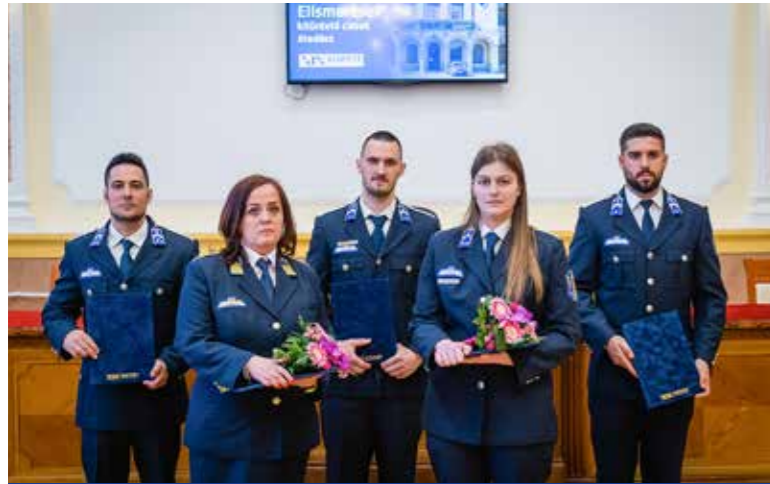
Kimagasló munkát végeznek a kispesztiekért

Sárkányölő Szent György Elismerést vehetett át a kispesti rendőrkapitányság öt munkatársa. Az Elismerést Szent György napjához, április 24-éhez kapcsolódóan adta át az önkormányzat.