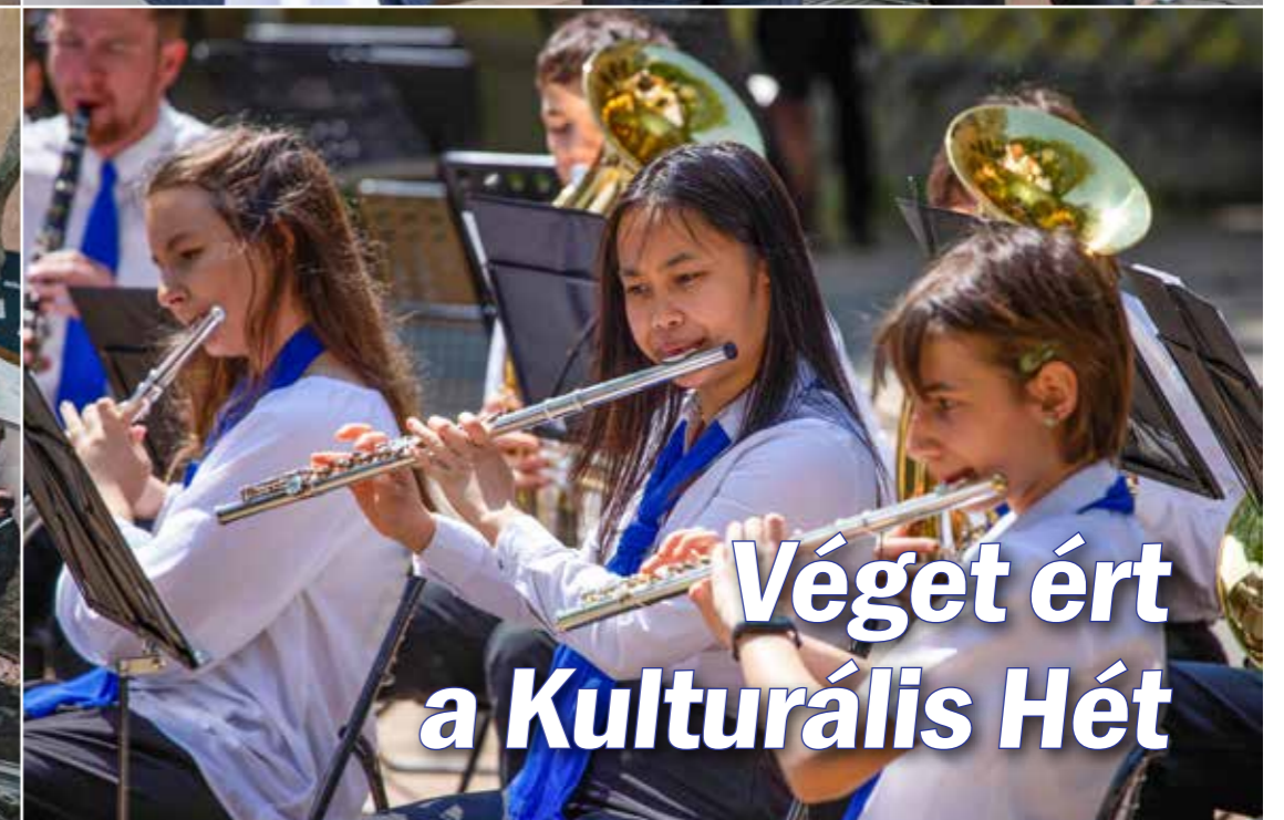
Véget ért a Kulturális Hét

Ünnepelt a KMO Művelődési Központ és Könyvtár: helytörténeti kiállítás, Kern András koncertje, színházi előadás, fűvészenekari fesztivál, középiskolás tehetségkutató, emléktábla-avató és múltidéző séta is várta az érdeklődő kispestieket május 15–20. között a népszerű közművelődési intézmény 100 éves, centenáriumi rendezvénysorozatának részeként összeállított Kulturális Hét programjai között.