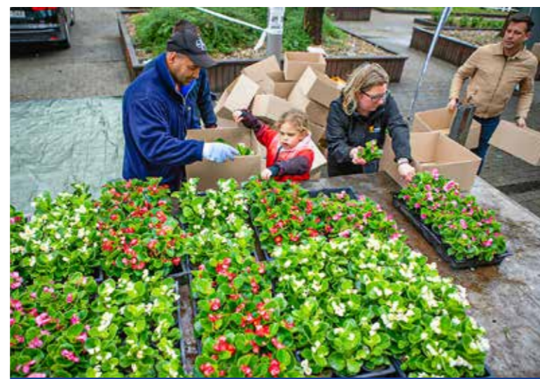
Szebb lesz Kispest