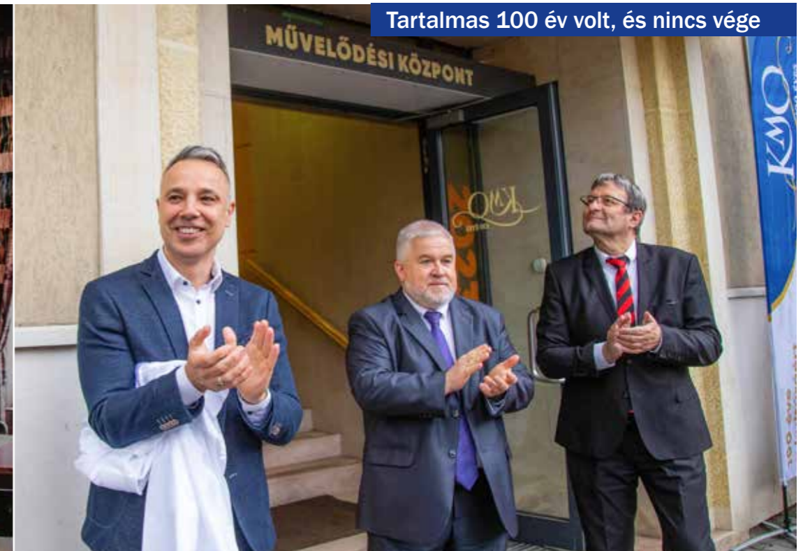
Tartalmas 100 év volt, és nincs vége