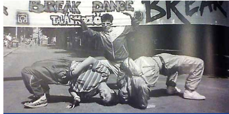
Break a KMO előtt