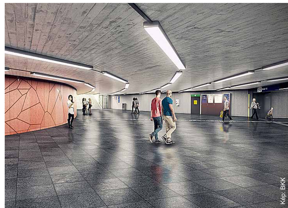
Ilyen lesz az aluljáró

nal rendszerébe illesztett segélykérő és kamerás megfigyelő berendezéseket telepítenek a biztonság fokozásáért; felvonók épülnek a felszín és az aluljáró között, így a metróállomás peronjai akadálymentesen elérhetővé válnak; átépítik a meglévő lépcsőket; megújul az utastájékoztató az utasforgalmi terekben; új, akadálymentes nyilvános mosdót létesítenek; egységes arculatú üzlethelyiségeket alakítanak ki; felújítják az utasforgalmi területen kívül a teljes üzemi teret, így korszerűsítik az aluljáró biztonságos üzemeltetéséhez szükséges berendezéseket; korszerűsítik az elektromos energiaellátást, a vízi közművet és csatornahálózatot, továbbá igazodik majd az aluljáró utastere a felújított metróállomáshoz, köszönhetően az egységes építészeti koncepciónak. A Budapesti Közlekedési Központ (BKK) tájékoztatása szerint az aluljáró üzemi terében zajló bontási munkák egyelőre nem érintik a gyalogosforgalmat. A felújítás előrehaladásáról, valamint a későbbi korlátozásokról a BKK folyamatosan tájékoztatást ad.