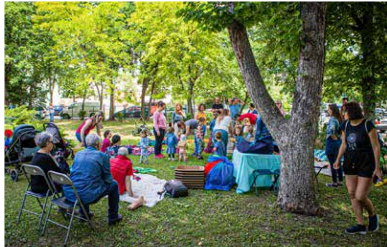
Jó hangulatú programok

Családi rendezvényre várták a kispesztieket május 22-én Wekerletelepen. A Magyar Kollégium Kulturális Egyesület szervezte a pikniket, melyet félmillió forinttal támogatott az önkormányzat.