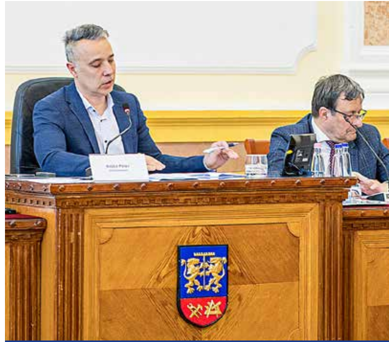
Óvodai sportpályákról is döntöttek

Vasútfejlesztési tanulmányról, a rendőrség és a tűzoltóság 2021. évi tevékenységéről szóló beszámoló elfogadásáról és óvodai ügyekről is döntöttek április végén a képviselők.