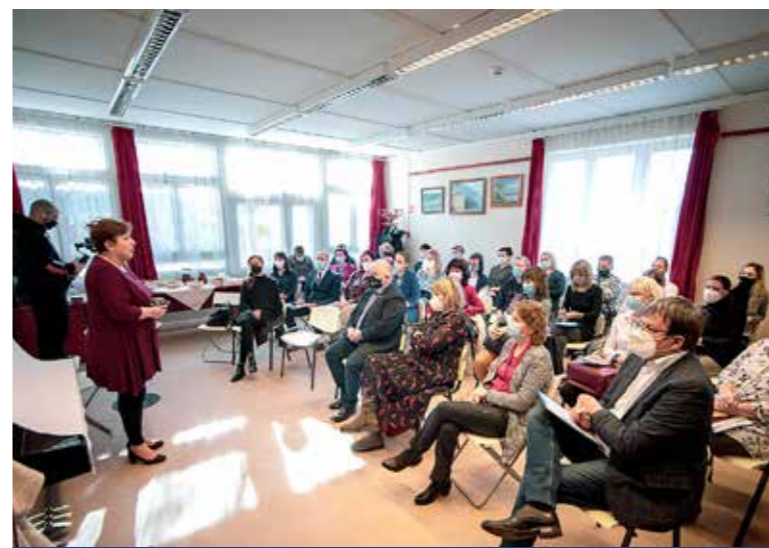
A nehézségek ellenére folyamatosan működtek az intézmények

A kispesi gyermekvédelmi és gyermekjóléti jelzőrendszer 2021. évi működését értékelték a szakemberek február végén.