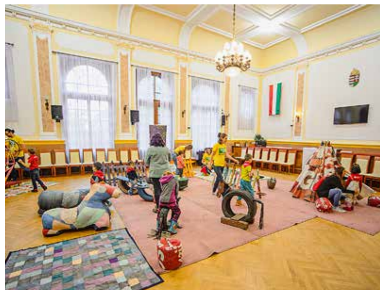
Játékos szemléletformálás az Autómentes Napon

Véget ért a KEHOP-5.4.1 (Környezeti és Energiahatékonyság Operatív Program) „Energiatudatos szemléletformálás a XIX. kerületben” című önkormányzati programsorozat. Utolsó eleme a Kispesi Szenior Akadémia idei első félévének nyitóelőadásához kapcsolódott: az idős emberek önálló életvitelét segítő okos és energiahatékony megoldásokról beszélgettek és töltötték ki kérdőívet a résztvevők.