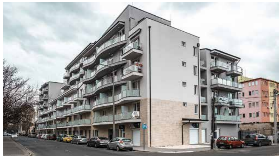
Lehel utca 6-12.

Polendakov megtiszteltetésnek nevezte, hogy a rodopei ivókút a rendezvény helyszínévé, és megköszönte az önkormányzatnak, hogy létrehozta ezt a kis bolgár sarkot Kispesten.