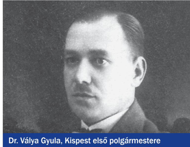
Dr. Válya Gyula, Kispest első polgármestere

És hogy mik várják a kispestieket az ünnepi évben? Április 30-ig jelentkezhetnek általános iskolás tanulók, középiskolások diákok és a kerületben élők a „Kispest arcai – Kedvenc helyeim Kispesten” című fotópályázatra. A képekből album készülhet, amely reprezentálhatja az évfordulót. Egy történetíró pályázat meghirdetését is tervezi az önkormányzat a lakosság számára. A Kispesti Helikon Kulturális Egyesület művészei a 100 éves város logójának elkészítésére