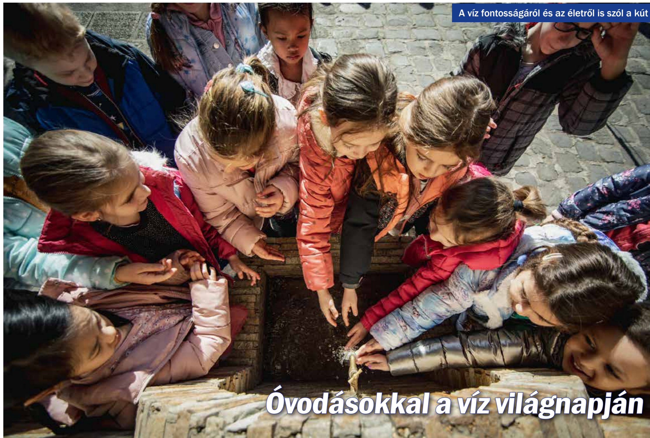
A víz fontosságáról és az életről is szól a kút