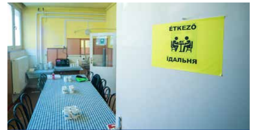
Régi bölcsődéből alakítottak ki szállást

Nagy segítséget jelentenek a napi ellátásban a Segítő Kéz Kispesti Gondozó Szolgálat, a Kispesti Szociális Szolgáltató Centrum és a Gazdasági Ellátó Szervezet munkatársai. A családok napközben nem tartózkodnak az épületben, a várakozási időt általában hivatalos okmányaik intézésével töltik. A kommunikáció ukrán és angol nyelven folyik velük. Az érkezők tartózkodási időtől függően napi háromszori étkezést kapnak dobozos formában. Vannak játékok a gyerekek számára, internetezni és tévét is tudnak nézni. A csecsemők is megfelelő ellátást kapnak. Mivel az Ukrajnában élő kisgyerekek oltási kötelezettsége eltér a hazaitól, ezért a legkisebbeket nem lehet gyerekközösségbe integrálni, de erre a rövid itt tartózkodás miatt nem is nagyon van szükség. Az utóbbi két hétben több alkalommal volt szükség orvosi és védőnői segítségre, gyógyszerre, kórházi kivizsgálásra is. Leromlott immunrendszerük erősítésére vitaminokat kaptak a menekültek. Koronavírusos