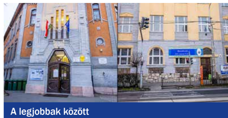
A legjobbak között

Évekkel ezelőtt kompetencia-özlőről lehetett hallani, miközben a fogalom nem egészen világos a szélesebb közönség számára. Ha leegyszerűsítjük, akkor egyik eleme a megtanult ismeretek alkalmazásának képessége. Ezt az elemet is mérik az országos mérésen matematikából és szövegértésből. Maga a mérés a közoktatásban töltött időszakban 4 al-