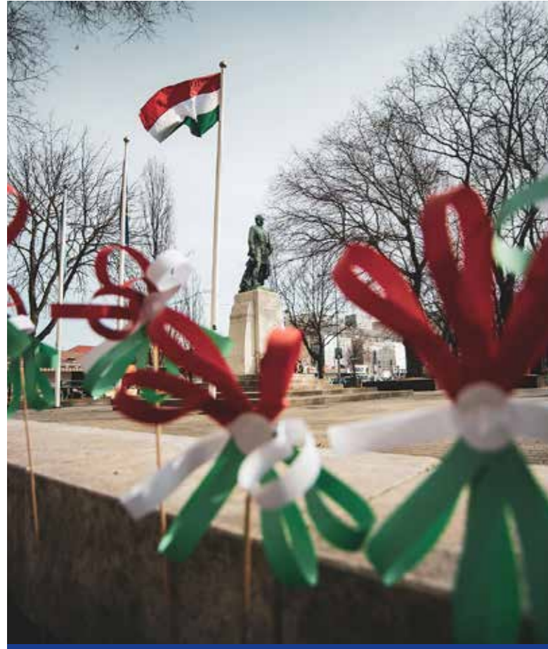
A szabadság és függetlenség eszméje vezérelte őket

A járvány miatti kétéves kényszerű szünet után újra műsorral ünnepelte az önkormányzat az 1848-as forradalom évfordulóját.