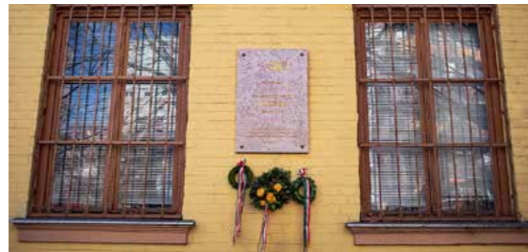
2017-ben avatták fel az emléktáblát

Az 1945-ben Kispestről a Szovjetunióba hurcolt politikai foglyok és áldozatok emlékére állított emléktáblánál tartott megemlékezést az önkormányzat a kommunizmus áldozatainak emléknapján.