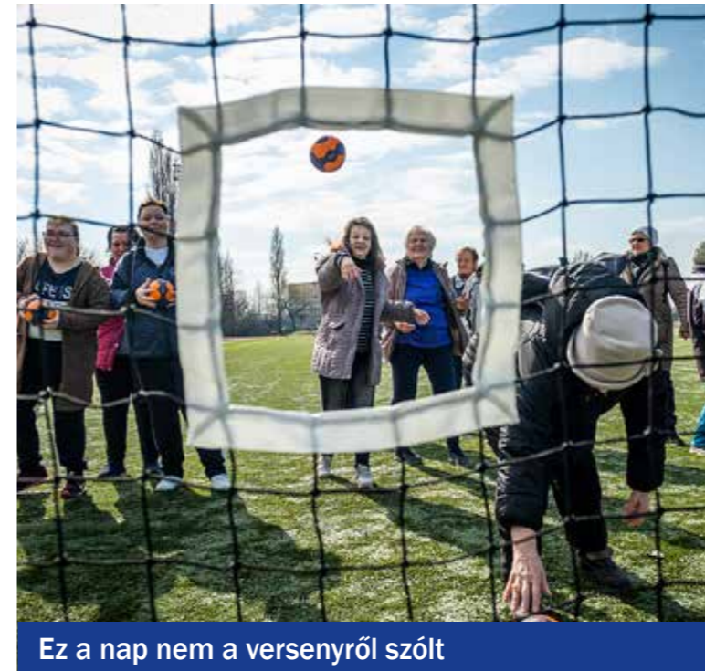
Ez a nap nem a versenyről szól

Az V. Kispesti Nőnap Sportprogramot és a IV. nyugdíjas sportnapot rendezték meg a Tichy Lajos Sportcentrumban. Összesen 170-en vettek részt a nőnap sportprogramon: délelőtt 80-an voltak a nyugdíjasok, 90-en délután a diákok (50-en a Semmelweis középiskolából, 40-en a Gábor iskolából).