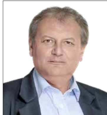
Dr. Hiller István (MSZP)

Az országgyűlési képviselői munka számomra egyik legfontosabb és legnagyobb tapasztalatot adó része a fogadóóra. Az a rendszeres találkozás, amikor kispestiek és pesterzsébetiek személyesen jönnek el, mondják el véleményüket, tapasztalataikat, kérik a segítséget egy ügy megoldásához, vagy éppenséggel kifejezik – nem egyszer kritikus – álláspontjukat az országos politika eseményeiről. Nekem sokat jelentenek ezek a találkozások. És mivel pontosan tudom, hogy senkinek sincs „választókerület-tudata”, senki sem