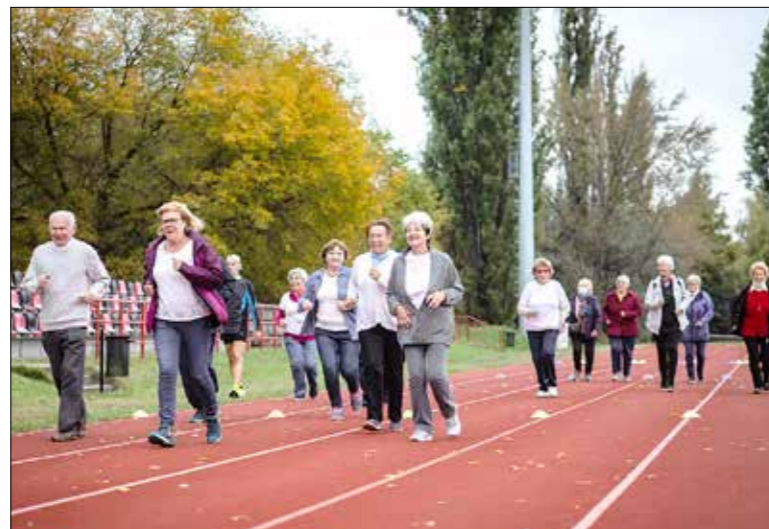
Fókuszban a mozgás

Az óvodástól a nyugdíjasig minden korosztály mozgott az Európai Sportnap kispesti állomásán és a vele együtt tartott I. Kispesti Nyugdíjas Sportna-