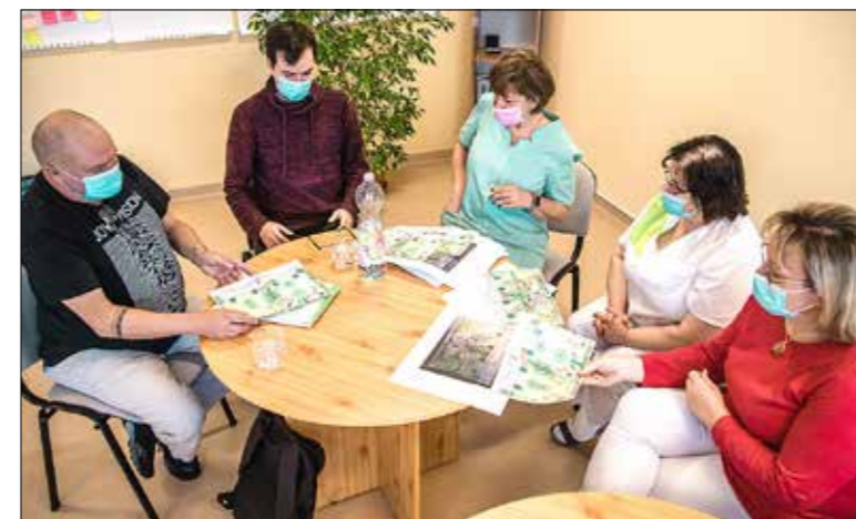
Újragondolják a játszóudvart

A Csillagfény bölcsőde játszóudvarának, kertjének újragondolásával folytatódott a dán-magyar bölcsődepedagógia program, amelyet a Villum