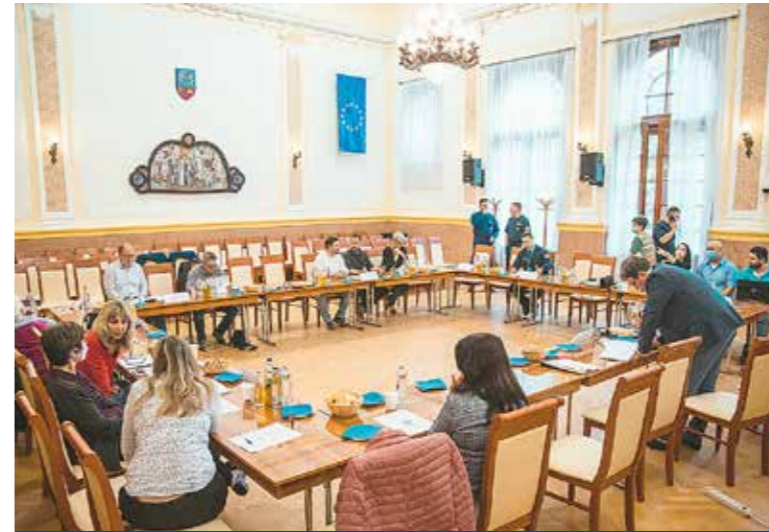
Jól teljesített a stáb

A lakosság védelmében tartott elméleti gyakorlat során a Wekerletelephez közeli IX. kerületi Illatos úti Vinyl Kft. területén bekövetkezett feltételezett vegyi balesetre – klór került a levegőbe – kellett a lehető legrövidebb időn belül reagálniuk a résztvevőknek. A felkészítés és a gyakorlat célja a vészhelyzetkezelés fejlesztése, a lakosság védelmével, személymentéssel, rendészeti feladatokkal összefüggő feladatok, a mentésre kijelölt szervezetek együttműködésének gyakorlása volt.