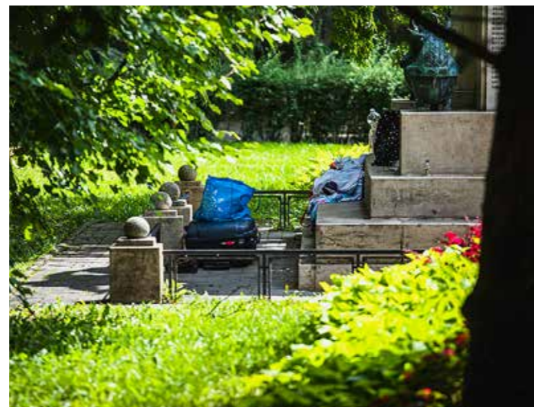
Zavaró a látvány