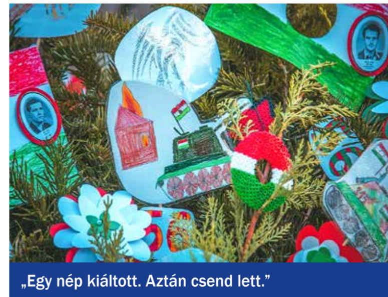
„Egy nép kiáltott. Aztán csend lett.”