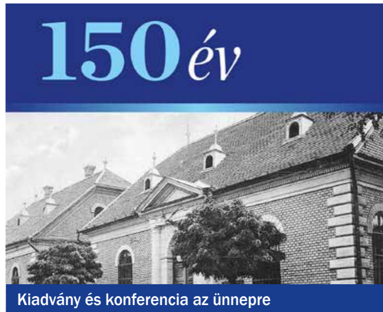
Kiadvány és konferencia az ünnepre

Művelődés és helytörténet – A lokalitás szerepe a XXI. században címmel rendezett ünnepi konferenciát az idén 150 éves Kispest tiszteletére az önkormányzat és a KMO. A program a Nemzeti Kulturális Alap támogatásával valósult meg.