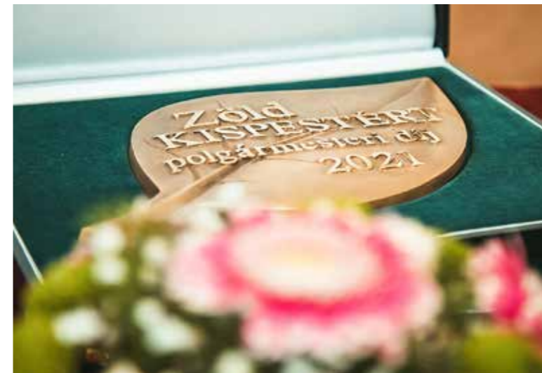
2008 óta jutalmazták a kerületszépítőket

A tavalyi és az idei díjazottak is egyszerre vehették át a kerületszépítő munkáért megítélt elismeréseket.