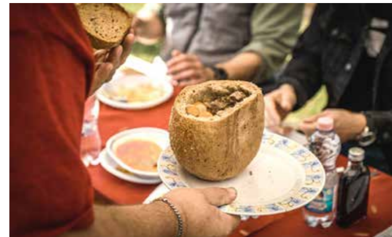
Erdészné kedvenc leve

Kilenc csapat vett részt az önkormányzat és a Kispesti Sportközpont hagyományos őszi főzőversenyén a Tichy Lajos Sportcentrumban. A B-COOL Dance Team táncosai és a Budapest Cowbells amerikaifutball-csapat játékosai szórakoztatták a szakácsokat.