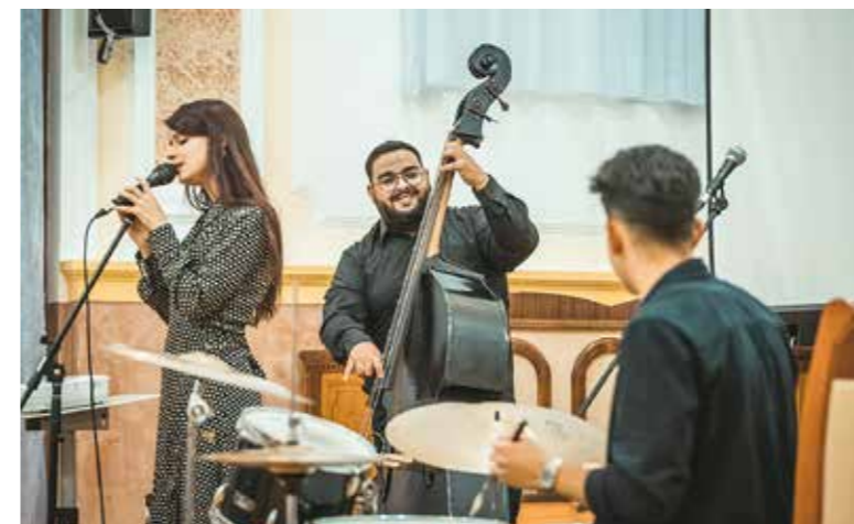
A bőgővirtuóz emléke előtt tisztelegtek

Tizenöt éve, 2006. szeptember 23-án hunyt el a kispesti születésű világhírű nagybőgőművész.