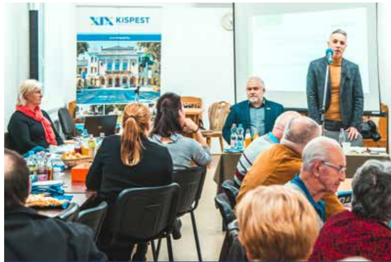
Az új Civilek Házában találkoztak

Hosszú szünet után találkoztak a kerület vezetői a civil szervezetek képviselőivel.