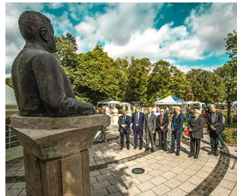
A kertvárost szívügyének tekintette Wekerle

tották meg ezt. „Mert építeni kell és nem rombolni, hinni kell, nem csüggedni” – vallotta igazi hazafiként, államférfiként Trianon után, nem sokkal halála előtt, 1921-ben Wekerle Sándor. Augusztus végén Wekerle szülővárosában, Mórton tartottak ünnepséget, amelyen az önkormányzat és a Wekerle Társaskör Egyesület (WTE) képviselői is jelen voltak. Az eseményre meghívták azoknak a városoknak (Karcag, Debrecen, Győr, Székesfehérvár, Veszprém, Mór, Tapolca, Kispeszt, Békéscsaba, Miskolc, Hódmezővásárhely, Nyíregyháza) a vezetőit, amelyekben Wekerle Sándor még életében, vagy halála után díszpolgári címet kapott. Kispeszen az önkormányzat 1996-ban adományozott díszpolgári címet a háromszoros miniszterelnöknek, Budapest főváros pedig még életében, 1894-ben.