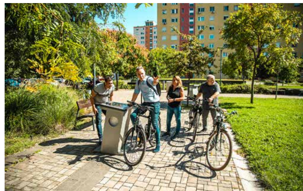
Reagálni tudnak egymás észrevételeire

zat több forrást tudott volna fordítani a kerület közterületeire, hiszen a kormányzati elvonások miatt idén erre is lényegesen kevesebb jutott. Nekünk viszont a kevesebből kell rendben tartanunk a kerületet, mert ezt várják el a kispesztiek – hangsúlyozta. Megtudtuk, a Templom tér és környéke, a Fő utca, az Atatürk park, a Kossuth tér, a KÖKI, valamint a lakótelepi kisebb, zárt par-