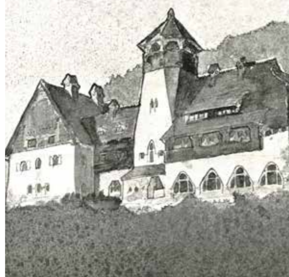
Felvidéki szálloda távlati képe