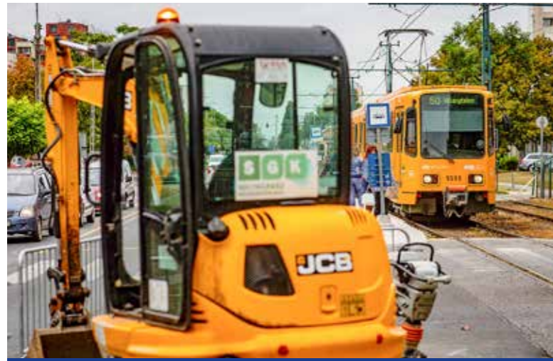
Átépitik a peronokat

Szeptember első napjaiban megkezdődött négy – köztük két kispesti – villamosmegálló akadálymentesítése az 50-es villamos vonalán. A helyszíni kiviteli munkákról, valamint a közösségi közlekedést érintő változásokról a BKK folyamatosan tájékoztatást ad.