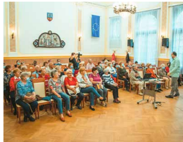
A kispesti az egyik legnépszerűbb képzés

Egyéves szünet után szeptember 21-én újra megkezdődött az oktatás a Kispesti Szenior Akadémián. Az idősek számára összeállított ingyenes előadássorozatot 2013-ban indította az önkormányzat közösen a Milton Friedman Egyetemen. A kispesti képzés az egyik legnépszerűbb az országban működő akadémiák között.