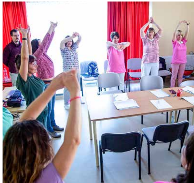
Jövő december végéig tart a program

A vírusjárvány miatt tavaly félbeszakadt a 2020 tavaszán megkezdődött dán-magyar bölcsőpedagógia program, amelyet a Villum Alapítvány támogat. A kényszerpihenő után idén ősszel, közel másfél éves kihagyás után folytatódik a dán program.