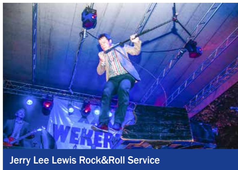
Jerry Lee Lewis Rock&Roll Service