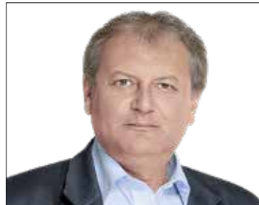
DR. HILLER ISTVÁN országgyűlési képviselő (MSZP)

Következő fogadóóra: 2021. október 14. 17 óra MSZP-székház (Kossuth Lajos u. 50.)