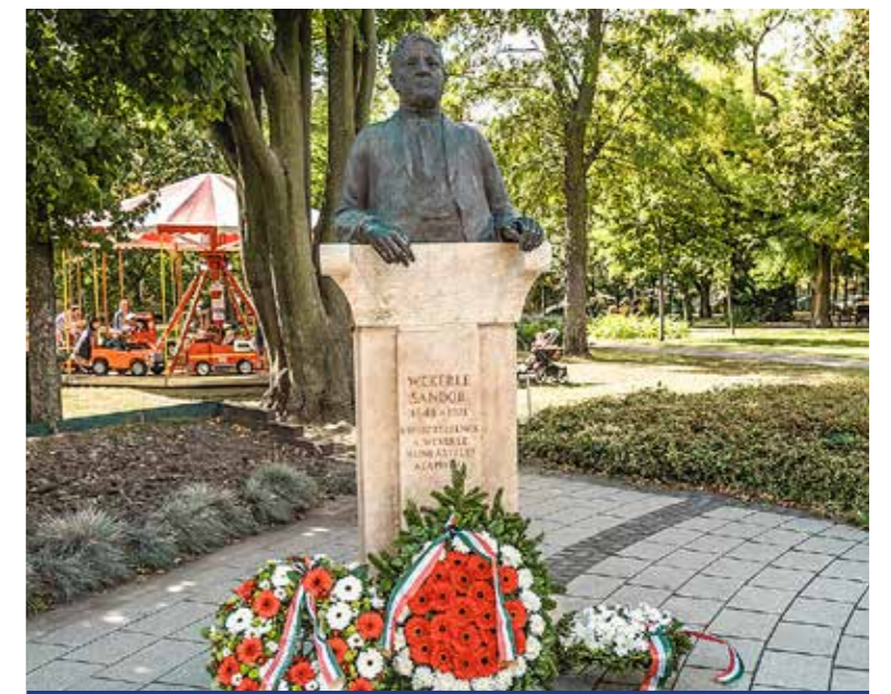
Kispeszt 1996-ban adományozta a díszpolgári címet