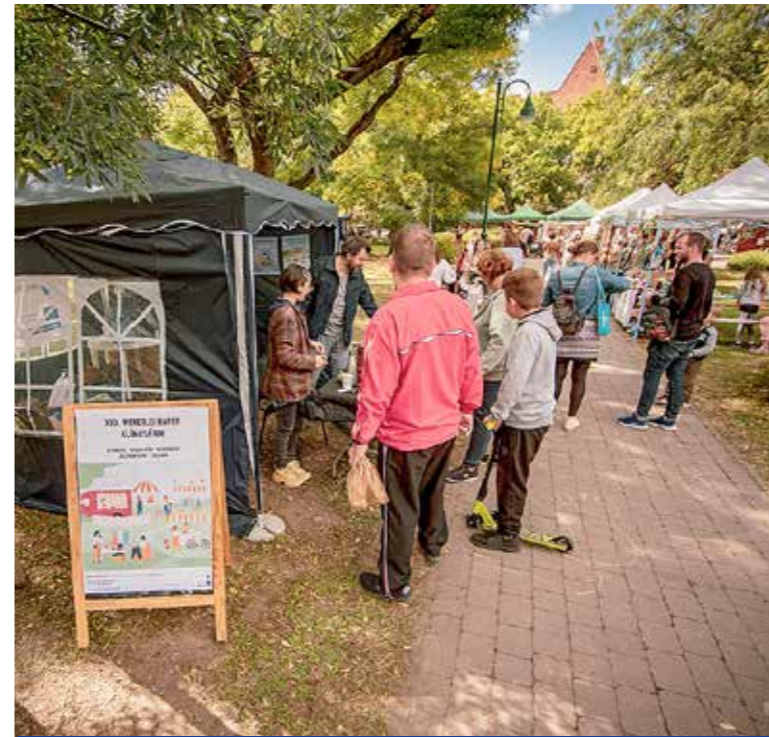
Egyre fontosabb a környezet- és klímatudatosság

Kispest Önkormányzata két zóldsátorral vett részt a XXX. Wekerlei Napok rendezvényén. A KEHOP 1.2.1 (klíma) és KEHOP 5.4.1 (energetika) pályázatok keretében szemléletformáló tanácsadást, ismeretterjesztő felvilágosítást, beszélgetést, kérdőívkitöltést szerveztek a szakemberek. Az Átalakuló Wekerle sátrában pedig többek között a komposztálás, az újrahasznosítás, az energiatudatosság fejlesztése volt a téma.