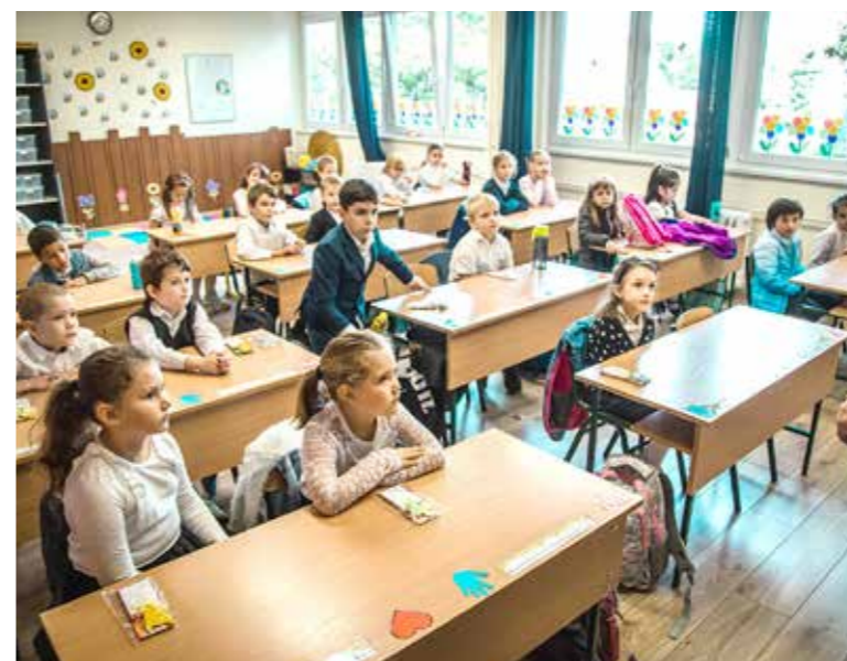
Már egy hónapja iskolások

Az idén ötödik tanévét kezdő Ady Endre Református Általános Iskola ünnepélyes évnyitójára a hagyományoknak megfelelően közösen sétáltak át a leendő elsősök a Szőlőskert Református Óvodából.