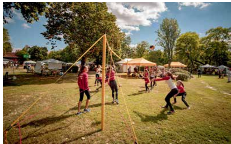
A sport is főszerepet kap