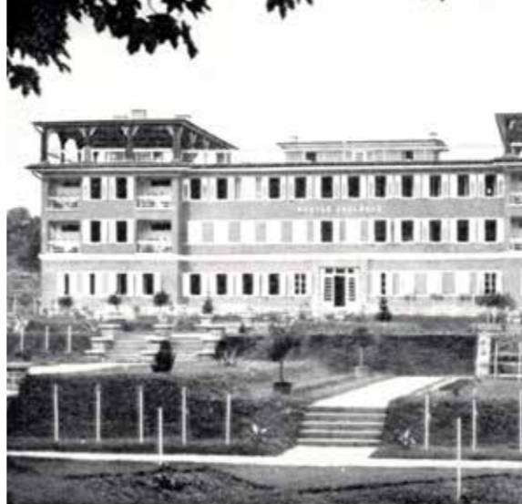
Postás üdülőház, 1937