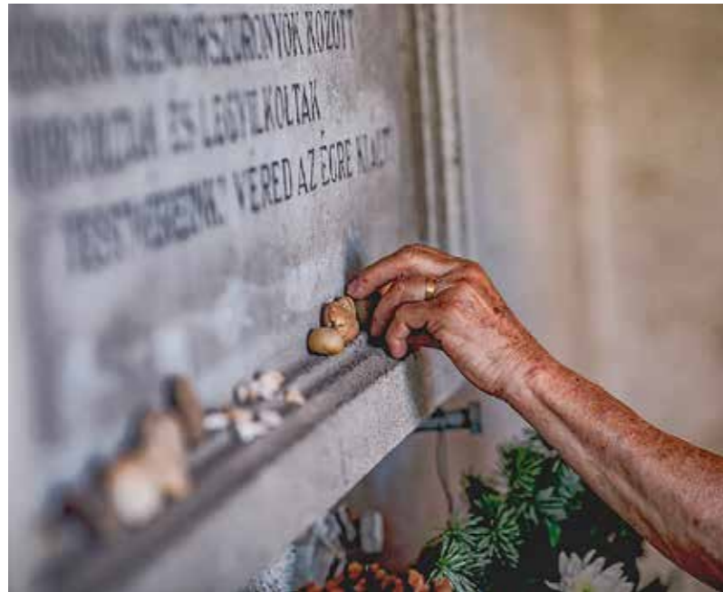
Legyen áldott a mártírok emlékezete

Az emlékezés fontosságáról szolt a koszorúzás a Kislesti Újtemető izraelita parcellájában található emléktáblánál és az istentisztelet a Méltóság Napja Templomban június 30-án. 1944-ben ezen a napon több mint háromezer zsidó és cigány származású embert deportáltak Kislestről németországi haláltáborokba. Kislest Önkormányzata gyásznappá nyilvánította június 30-át. A megemlékezést a Magyar Ellenállók és Antifasiszták Országos Szövetségének (MEASZ) kislesti szervezete és a Romák Felzárkóztatásáért Egyesület (RFE) szervezte.