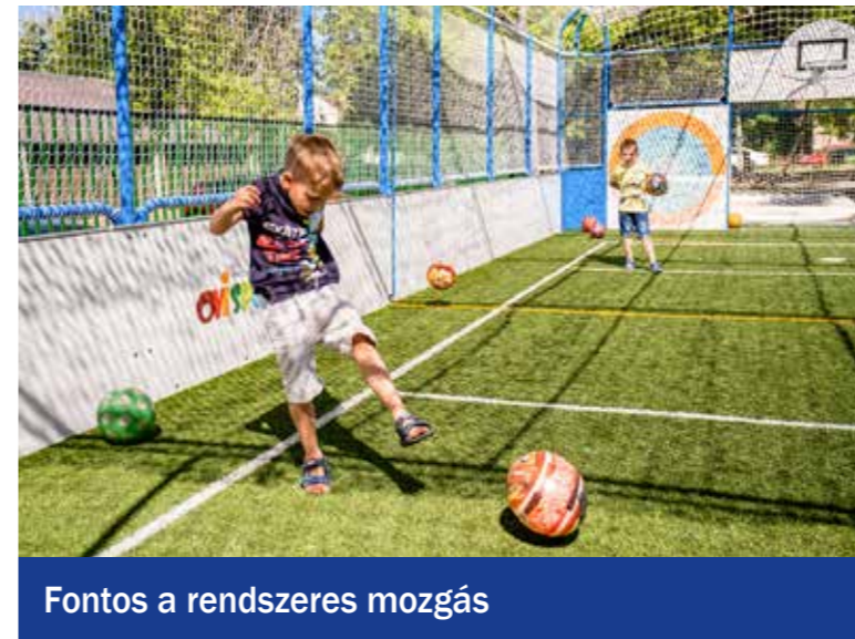
Fontos a rendszeres mozgás

Örülnek a Napraforgó és a Gyöngybagyó óvodába járó kisgyerekek a multifunkcionális udvari sportpályáknak, amelyeket az Ovi-Sport Közhasznú Alapítvánnyal közösen alakított ki az önkormányzat.