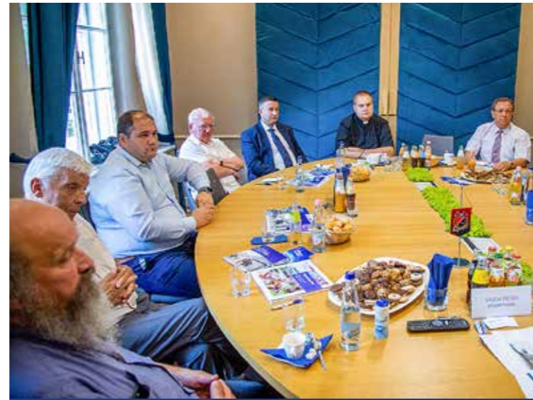
Forrás hiányában elmaradt az egyházak támogatása

A Kispesten működő egyházak vezetői ismét meghívást kaptak a Városházára, hogy megvitassák a kerület ügyeit a városvezetéssel augusztus elején.