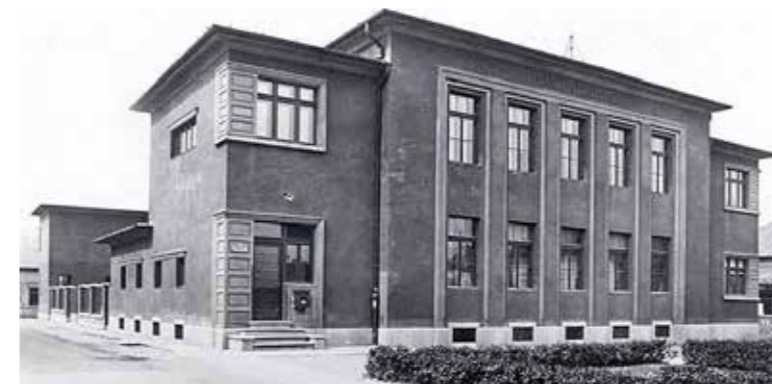
A Postapalota 1932-ben