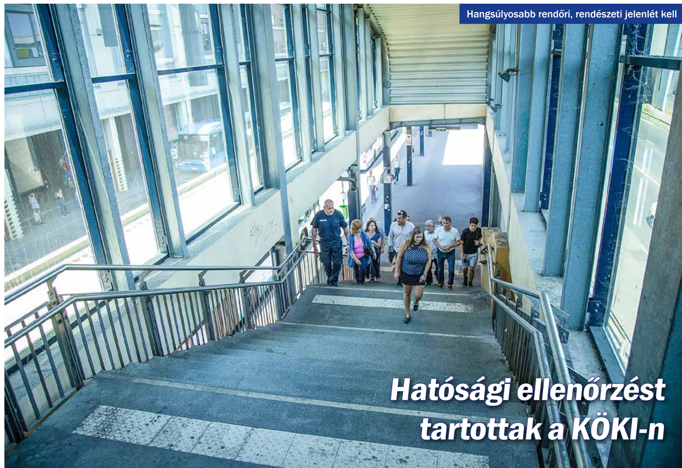
Hangsúlyosabb rendőri, rendészeti jelenlét kell