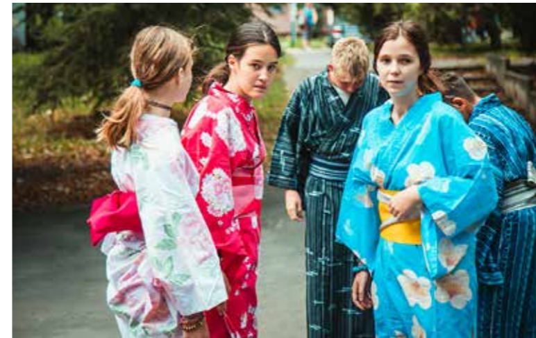
Japán jött Kispestre

A japán kultúra és az olimpia volt az idei nyári napközis tábor tematikája, így az augusztus 19-i táborzáró is ennek jegyében zajlott. A Kispesti Kóficok Kerületi Napközis Táborban, az Eötvös iskolában naponta 150-200, néha még kétszáznál is több gyerek színvonalas nyári elfoglaltságáról gondoskodtak. Az önkormányzat 14 millió forinttal támogatta a kispeszt gyerekek számára ingyenes tábort programokat.