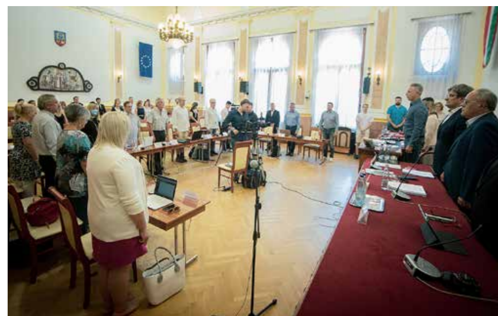
Néma felállással emlékeztek a pandémia áldozataira