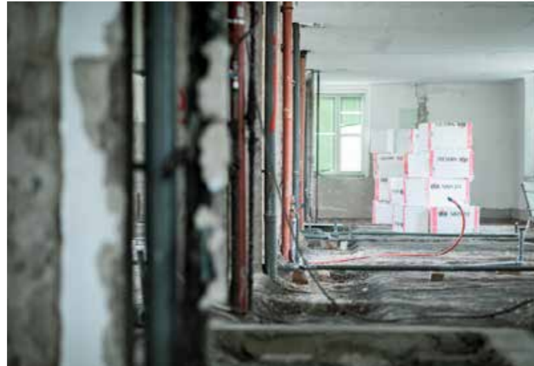
Terv szerint halad a munka

A tervek szerint halad az egynapos sebészet kialakítása a Kispesti Egészségügyi Intézet harmadik emeletén. A megvalósítást az építéssel és a műszerezéssel együtt több mint egymilliárd forinttal támogatta az Egészséges Budapest Program. Az építkezés után egy olyan tágas gyógyító részleg várja a kispesztieket, ahol két műtő is lesz.