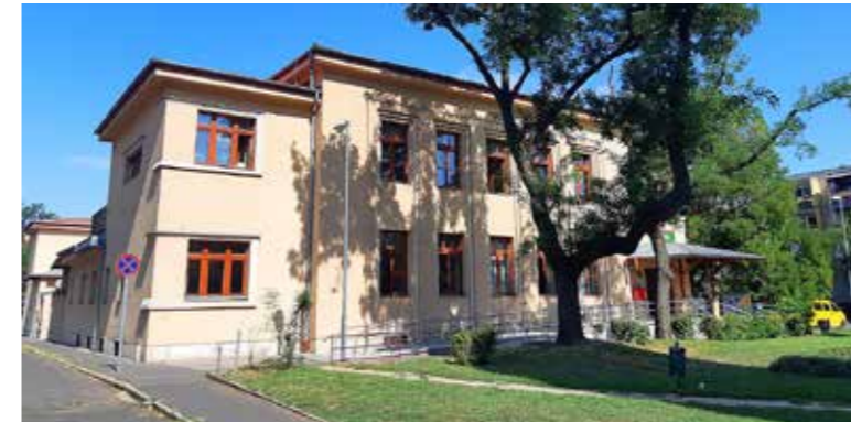
A Posta épülete napjainkban