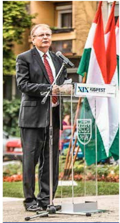
Dr. Hiller István

Az államalapítás ünnepét Szent István király kispesti szobrának avatásával tette emlékezetessé az önkormányzat.