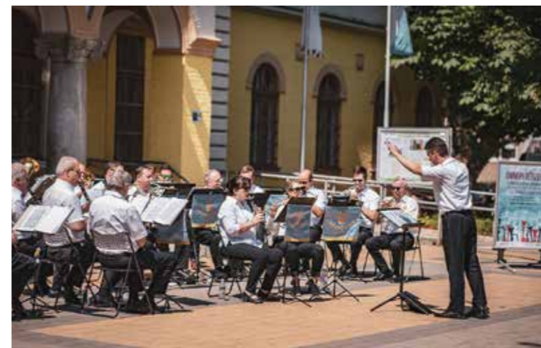
Indulók és népszerű dallamok