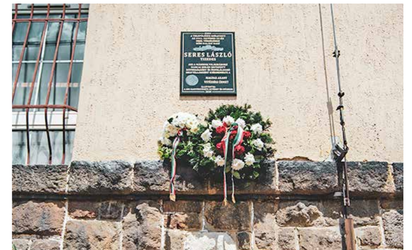
A keleti fronton esett el 1941-ben