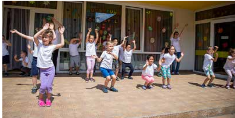
Csökken a gyereklétszám

Nem csak kispesti jelenség, de már most foglalkoznunk kell vele: egyre kevesebb gyermek veszi igénybe a kerületi óvodai és bölcsődei szolgáltatásokat – tájékoztatta lapunkat Kispeszt polgármestere.