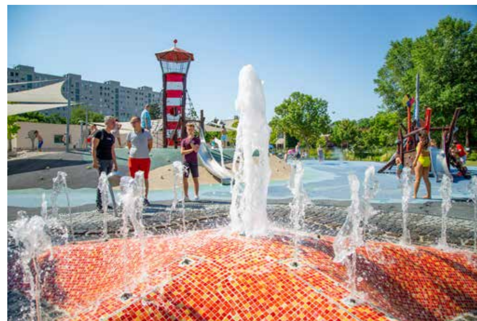
Nemcsak Kispeshten népszerű