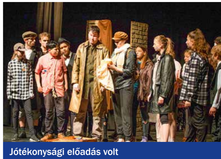
Jótekonysági előadás volt