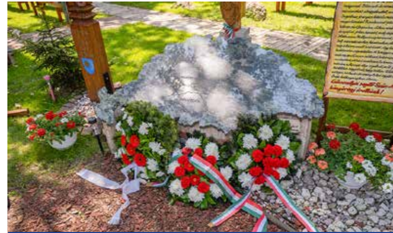
Trianon eleven seb

A Székelyország Tündérbertje látványparkban tartotta megemlékezését az önkormányzat a trianoni békeszerződés aláírásának napján.