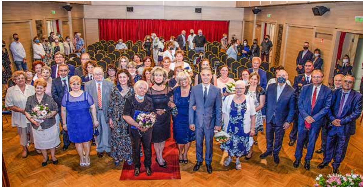
Tavaly elmaradt az ünnepelés

A három tavalyi díszpolgárt ismét megköszöntötték, tízen Kispestért Díjat, tizenöten Dicsérő Oklevelet, nyolcan pedagógusoknak járó kitüntetést vehettek át a június 11-i dísztestületi ülésen a KMO-ban. Tavaly, Kispest önálló településsé nyilvánításának 149. évfordulója alkalmából a járvány miatt elmaradt az ünnepelés, csupán a díszpolgárok vehették át az év végén Kispest város címerének rajzolatával ellátott arany emlégyűrűt.