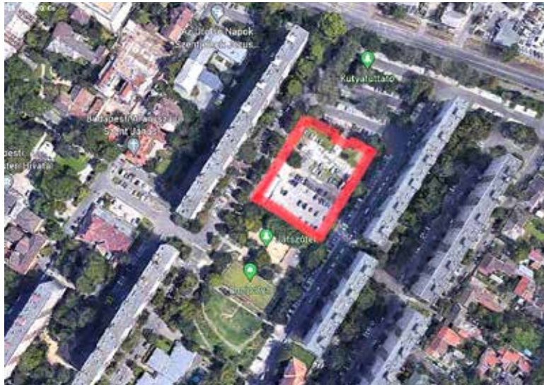
Közterületet nem veszélyeztet a beruházás

Levélben tájékoztatja Kispest polgármestere az érintett társasházak lakóit a Zrínyi utca 2. alatti magántulajdonban lévő telek ügyéről.