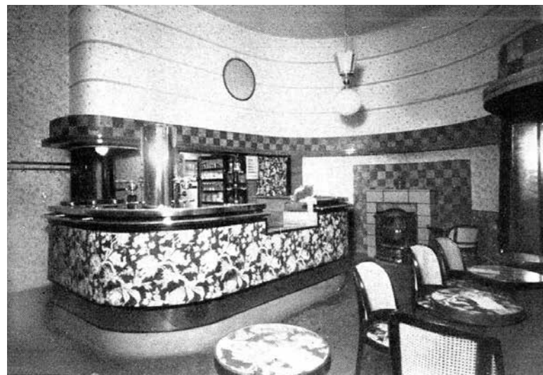
Espresso bar, Tér és Forma, 1940