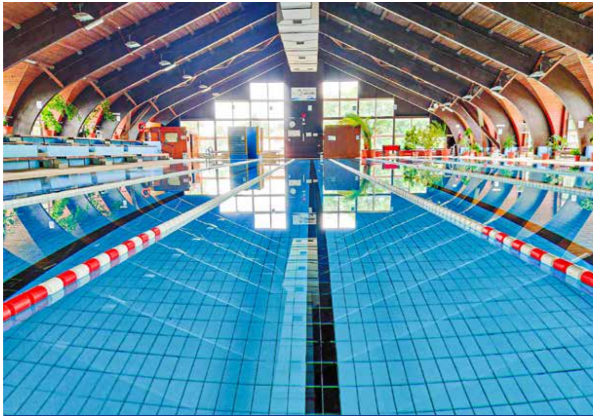
Látni a fényt az alagút végén

Egyelőre a védettségi igazolvánnyal rendelkezők és azok látogathatják a létesítményt, akik igazolni tudják, hogy átestek a koronavírusról az elmúlt 6 hónapban – tájékoztatta lapunkat az igazgató.