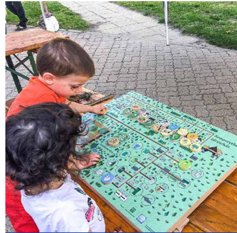
Játszva is lehet tanulni a komposztálást

A klímaváltozást Kispesten is a bőrünkön érezzük: gyakribb hőhullámokra, viharokra, hirtelen lezúduló csapadékokra számíthatunk többek között. A területnek egyrészt csökkentenie kell a széndioxid-kibocsátását (2030-ig minimum 40%-kal), hogy hozzájáruljon a még súlyosabb változások megelőzéséhez, másrészt alkalmazkodnia kell a már megváltozott éghajlati viszonyokhoz. A tavaly elfogadott kerületi Klímastratégiában részletesen olvashatnak arról, hogy mit tett eddig és mit tervez tenni a jövőben az önkormányzat a klímavédelem, a megváltozott körülményekhez való alkalmazkodás és a szemléletformálás érdekében. ( http://klima.kispest.hu/klimastrategia/ )