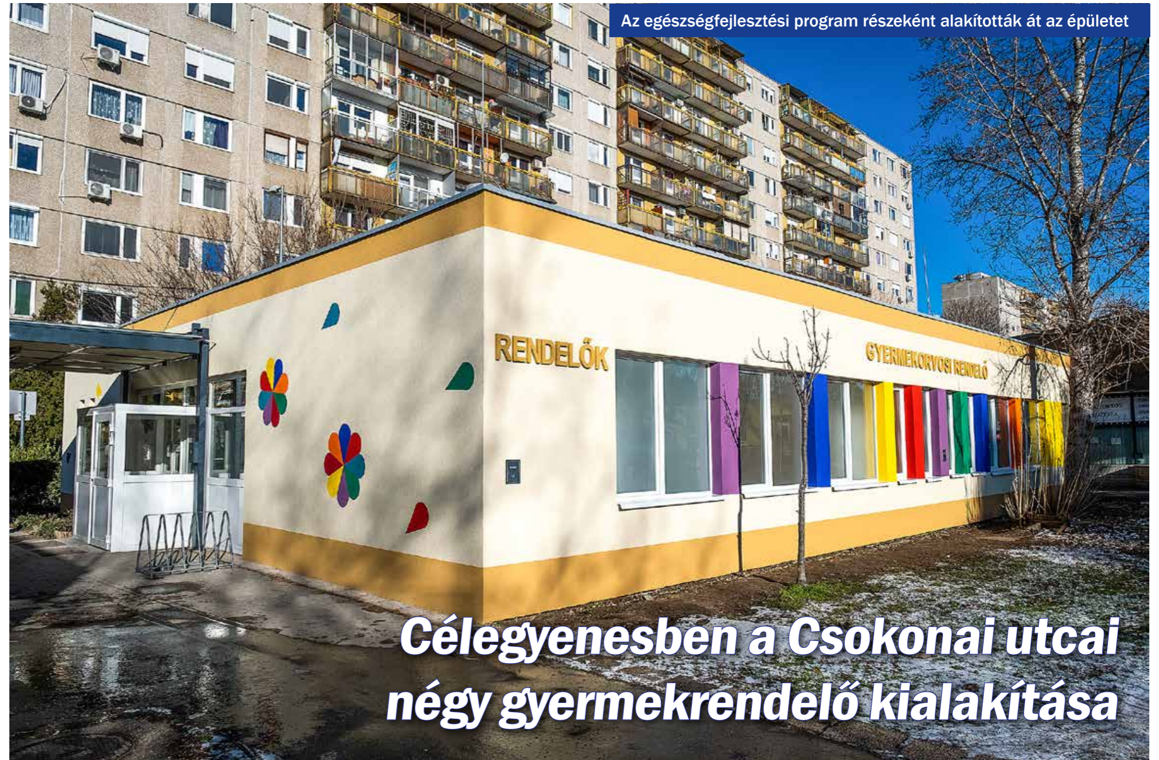
Az egészségfejlesztési program részeként alakították át az épületet

A tervek szerint márciustól már fogadják az ifjú betegeket az új Csokonai utcai gyermekorvosi rendelőben. A több mint 440 négyzetméteres komplexumban négy rendelőt, egy-egy tanácsadó helyiséget, orvosi szobát, vizsgálót, diszpécser szobát, beteg- és tanácsadói várót, valamint öltözőt és mellékhelyiségeket alakítottak ki az gyermekházi orvosok elképzeléseinek megfelelően, a hatósági előírások figyelembevételével.