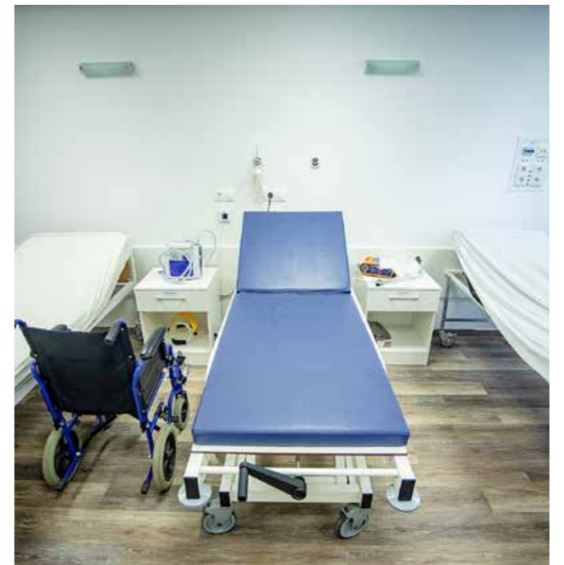
Beutalóval térítésmentesen lehet jelentkezni

vizsgálathoz is orvosi javaslat szükséges. Sajnos a jelenlegi járványhelyzetben a váróban