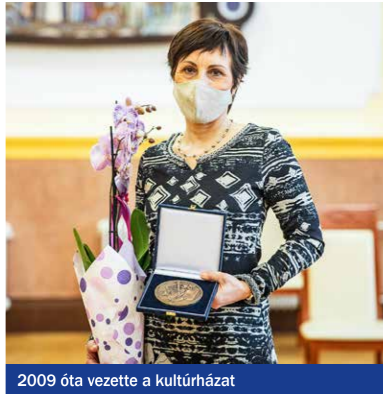
2009 óta vezette a kultúrházat