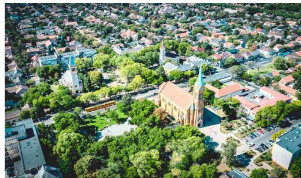
A kispestiek 2017 óta vesznek részt a tervezésben

A kispestiek közvetlen bevonása a kerületi költségvetés tervezésébe Gajda Péter polgármesteri programjában jelent meg 2014-ben, és 3 évvel később, 2017-ben valósult meg először a gyakorlatban. A kispesti közösségi költségvetés mintájára ma már a fővárosban és az ország más pontjain is megkérdezik a lakosság véleményét. Ezt jól példázza a Budapesti Corvinus Egyetem Vállalatgazdaságtani Intézet Döntésmélet Tanszékéről elindult kutatás, amely a részvételi költségvetés gyakorlati megvalósulását és elméleti háttérét vizsgálja. A kutatásról bővebben: https://corvinusonline.blog.hu/2021/01/26/hogyan_szolhatsz_be_te_is_budapest_koltsegtetesebe_kutatas_a_reszveteli_koltsegtetesrol