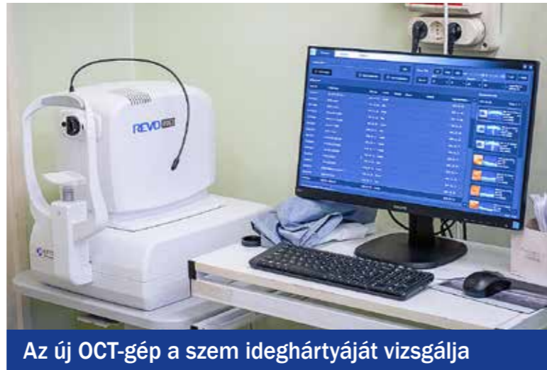
Az új OCT-gép a szem ideghártyáját vizsgálja

érkező betegek mindegyikénél elvégezhető az a vizsgálat, amely nagyon fontos mind az időskori makula-degeneráció (macula degeneratio), az éleslátásért felelős sárgafoltosorvadásos-betegség, mind pedig a zöldhályog korai felismerésében. Bár ez a vizsgálat teljes egészében az állam által nem támogatott, de a kispesztiek egészségmegőrzése érdekében az intézet átvállalta ennek költségeit – emelte ki a főorvos.