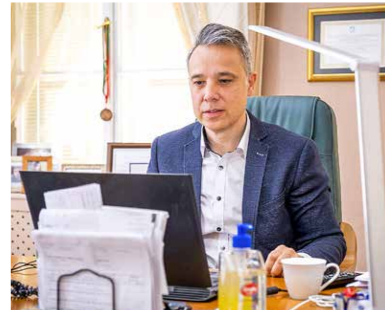
Várjuk a központi elvonások kompenzálását