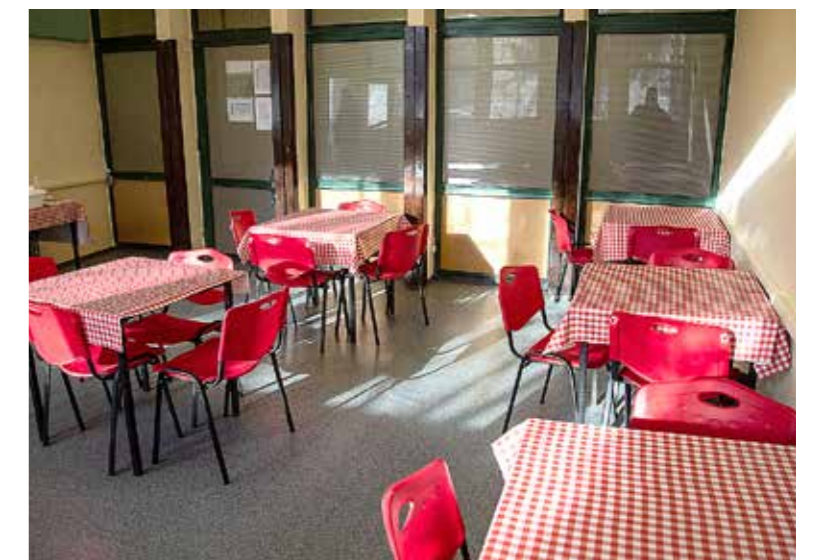
Jobban esik az étel a megújult ebédlőben