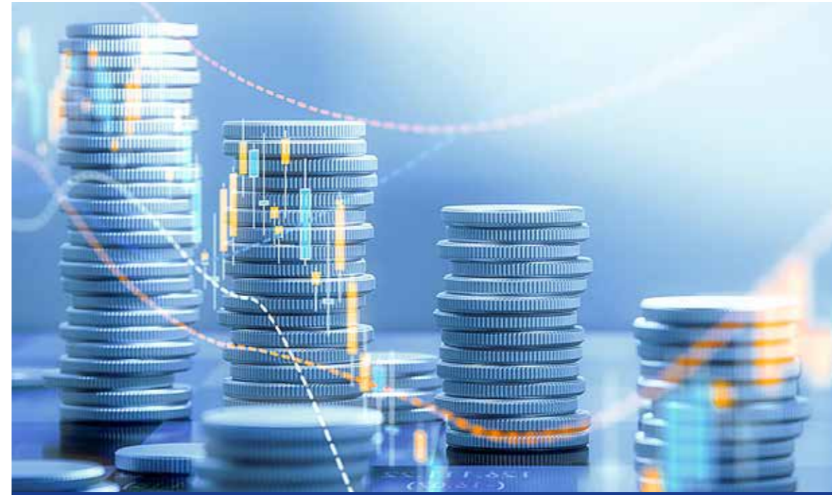
Lényegesen kevesebb pénz jut a város működtetésére, fejlesztésére

Kispest 2020. évi költségvetésében 13,5 milliárd forint áll rendelkezésre. Jövőre több mint hárommilliárd forintot vesz el a kormány a város költségvetéséből: a központi elvonás olyan mértékű, amit nem lehet egyszerűen „kigazdálkodni”.