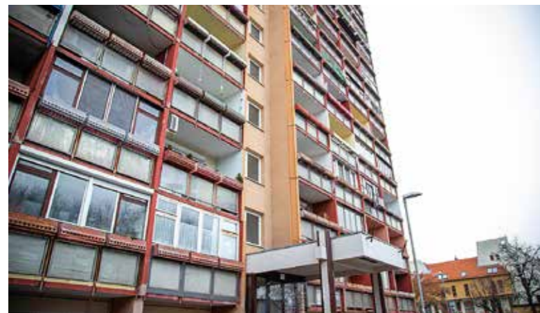
Felújított lakást biztosítanak az egyik családnak

Ideiglenes szállás biztosításával, rendkívüli gyorssegéllyel támogatja az önkormányzat a Kazinczy utcában advent első vasárnapján keletkezett paneltűz károsultjait. A tűzben több felső emeleti, magántulajdonban lévő lakást ért kár különböző mértékben, négy embert mentettek ki a tűzoltók az épületből. Akárcsak korábbi hasonló eseményeknél, az önkormányzat most is segített. A VAMŰSZ rendbe hozta azt a lakást, amit az egyik segítség-re szoruló családnak át tudunk