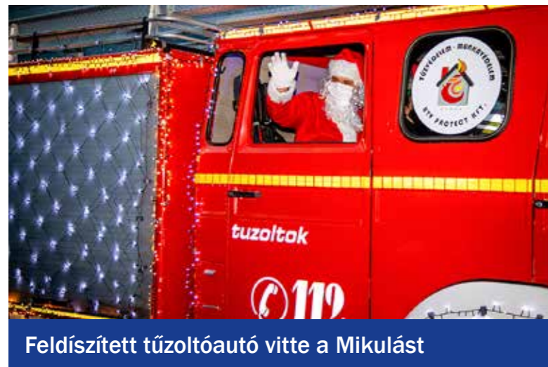
Feldíszített tűzoltóautó vitte a Mikulást