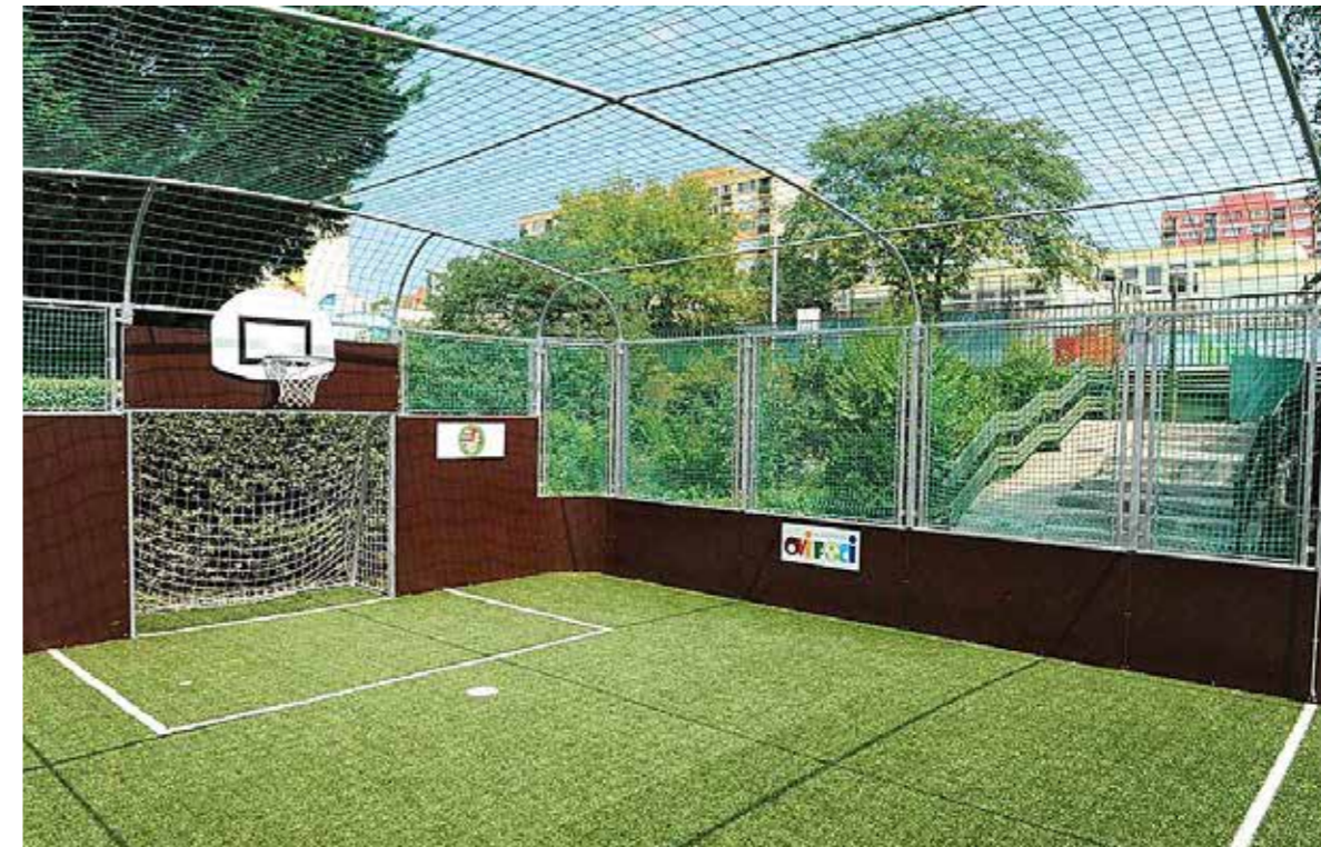
Műfüves pályát létesítenek a Gyöngyragyó és a Napraforgó óvodában

A Közpark plusztámogatásáról, a gyermeknevelési reformprogram meghosszabbításáról és óvodás sportprogram támogatásáról is döntöttek a képviselők december elején.