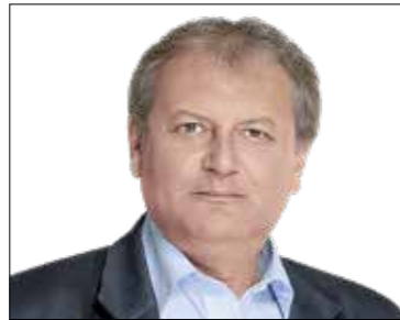
DR. HILLER ISTVÁN országgyűlési képviselő (MSZP)

Telefonos fogadóórát tart a járvány idején, a 06-1-211-3307-es telefonszámon előzetesen bejelentkezőket a fogadóóra idején visszahívja. Következő telefonos fogadóóra: 2021. január 7-én 17 órától