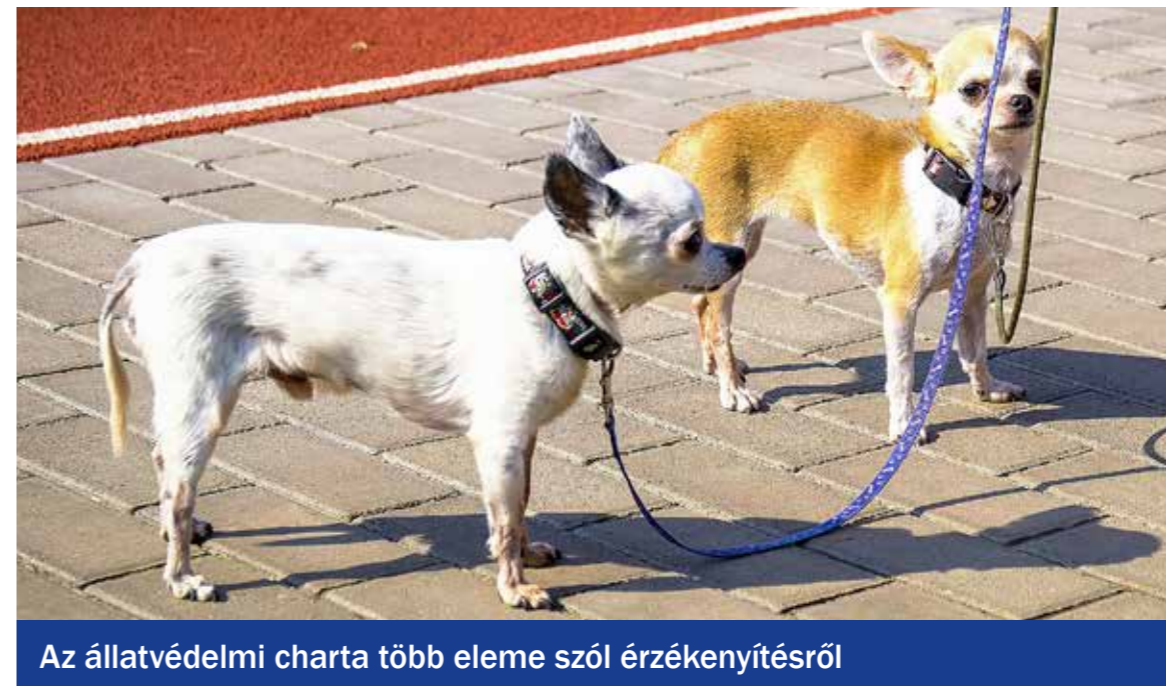
Az állatvédelmi charta több eleme szól érzékenyítésről

Idén ősztől állatvédelemért felelős főpolgármesteri megbízott ellenőrzi a Budapesti Állatvédelmi Charta célkitűzéseinek megvalósítását. Más fővárosi kerületek számára is példaértékű lehet a Kispesti Állatvédelmi Járőrszolgálat tevékenysége. Az egyesület önkéntesei az elmúlt öt évben 1800 esetben intézkedtek, és csaknem 600 állat került a gondozásunkba.