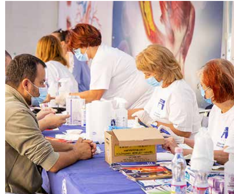
Több mint kétezer szűrést végeztek el az egésznapos rendezvényen

A Richter Gedeon Nyrt. 2009-ben indította útjára a Richter Egészségváros Programot. A szlogen – „Egészség ezreknek, milliók a kórháznak” – alapján a programsorozat célja, hogy mindenki egyszerre tehessen valamit saját maga és családja egészségéért és