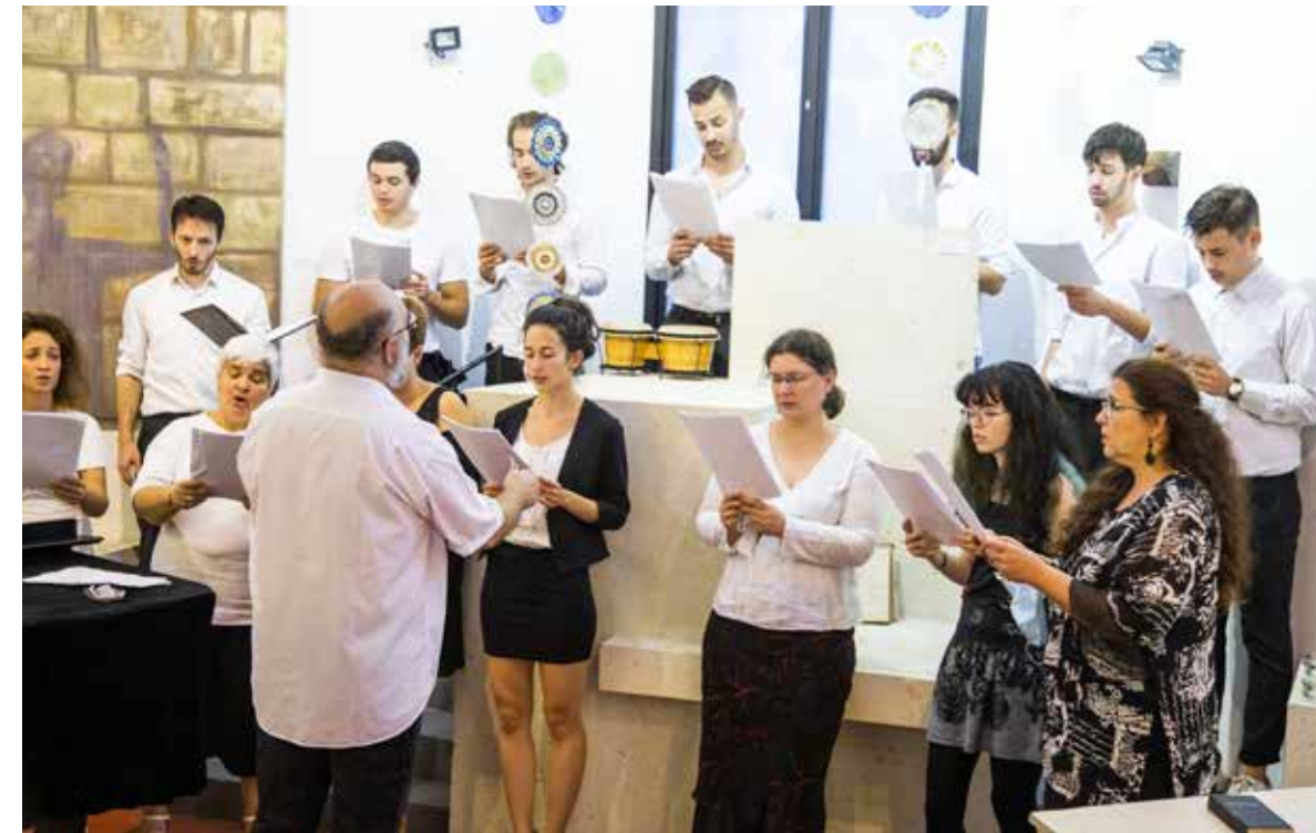
A Wesley Károly Kórus a Méltóság Napja Templomában

Mint már fél évtizede megszokott, a Kispesti Helikon Kulturális Egyesület művészeinek kiállításával és a Wesley Károly Kórus koncertjével kezdődött a kispesti Ars Sacra Fesztivál a Magyar Evangéliumi Testvérközösség Méltóság Napja Templomában.