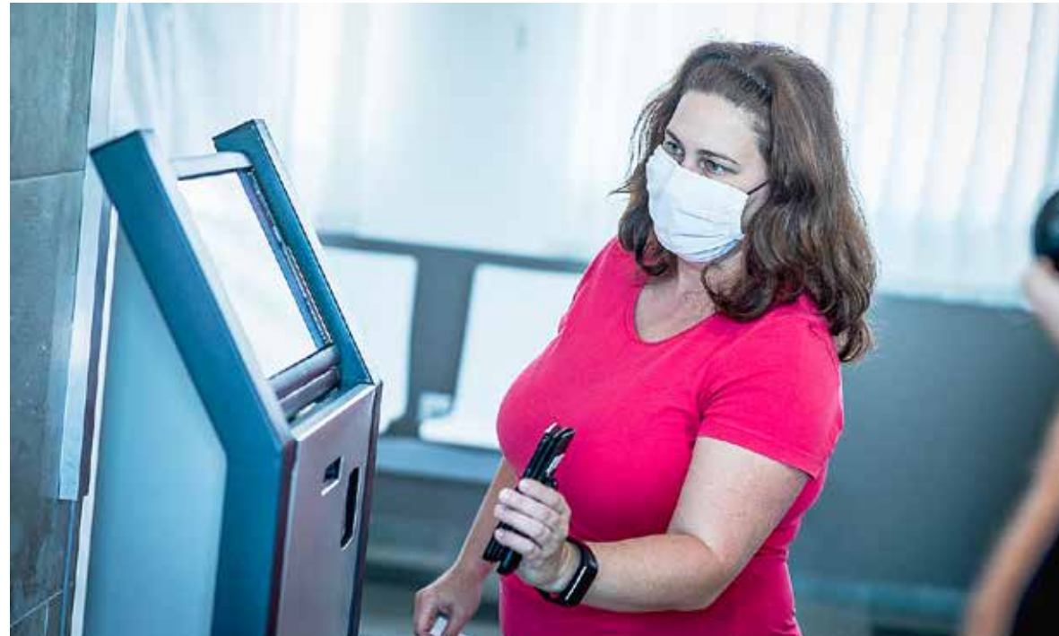
Internetes előjegyzést követő érkezetés az Egészségügyi Intézetben

A koronavírus-járvány második hulláma miatt az elmúlt hetekben újabb intézkedésekről döntött a Kispesti Operatív Törzs, új szabályokat vezettek be védekezésükben az intézményekben.