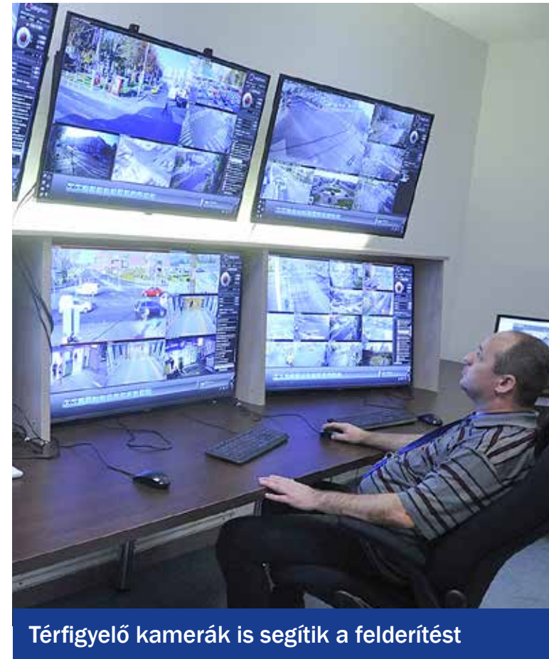
Térfigyelő kamerák is segítik a felderítést

Illegális szemetelőket ért tetten az elmúlt időszakban az év elején újra akcióba lendült Zöldkommandó, a rendőrség foglalkozik az ügyekkel.