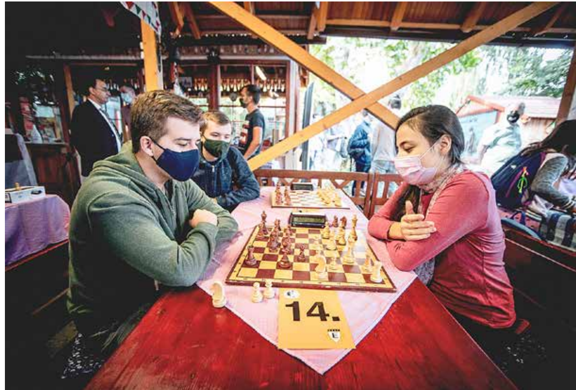
Ezúttal csak hazai versenyzők küzdöttek egymással

A Barcza Gedeon SC idén is megrendezte hagyományos sakkversenyait: a III. Ősz Gábor és az V. Ádám György Emlékversenyeket. A körülményekre való tekintettel most csak hazai csapatok vettek részt az egynapos versenyen.