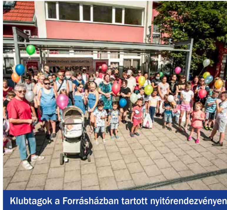
Klubtagok a Forrásházban tartott nyitórendezvényen

mogatva javítani az életükön. A Karitászi is úgy látta, hogy egyes családok a program segítségével már stabilizálták helyzetüket, másokat viszont tovább kell kísérni, segíteni. Ezért döntöttek úgy, hogy a program végeztével klubformában működnek tovább. Az „Akarom tovább” programban végzett 31 családból 24 fogadta el a meghívást a klubba,