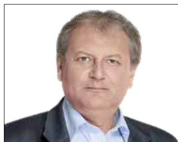
DR. HILLER ISTVÁN országgyűlési képviselő (MSZP)