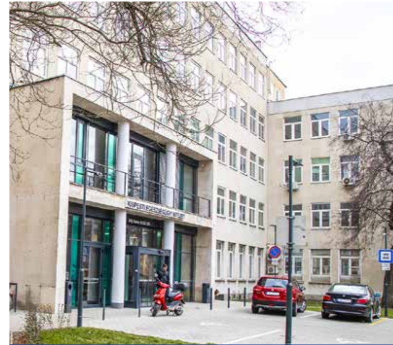
Kezdődhet a szakrendelő struktúraátalakítása

Az Egészséges Budapest Program keretében idén 931 millió forintot kap a kerület a Kispesti Egészségügyi Intézet további fejlesztésére.