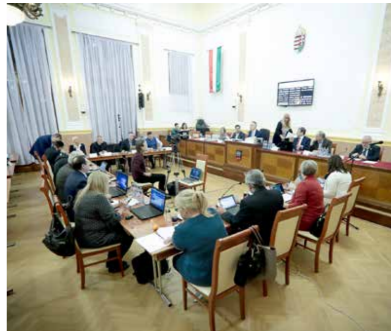
Elfogadták a testület 2020-as munkatervét is