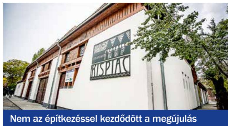
Nem az építkezéssel kezdődött a megújulás

énekkórusok és gólyalások, a biodobozosok, a paradicsompalánta-örökbefogadók, a kisüzemi kolbászosok és sajtosok, a házi pékárusok és sokan mások együtt töltötték és töltik meg ezután is színekkel, illatokkal, jó érzésekkel és gondolatokkal ezt a teret. Az önkormányzat vezetői rá is érezték a civilekkel való partneri viszony hasznára. A pályázatírástól kezdve a közösségi tervezési folyamat segítségével egészen a befejezésig és azon túl is a fejlődés motorjai a helyben élő, aktív állampolgárok voltak és lesznek. A kispia újjáépítése ezzel együtt a kispeszt fejlesztések és társadalmi egyeztetések állatorvosi lova.