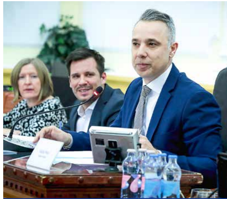
Gajda Péter polgármester a testületi ülésen

Az idei év első testületi ülésén a szakrendelő szakmai tervéről, parkolóhelyek létesítéséről, valamint antikorrupciós tényfeltáró és vizsgálóbizottság felállításáról is döntöttek a képviselők.