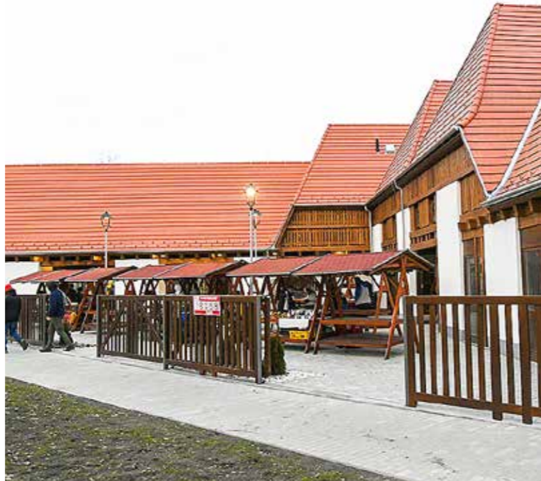
Jogerős a használatba vételi engedély

nónia út, a Nádasdy utca és a Gutenberg körút által határolt területen fekvő kispia felújítására Kispeszt önkormányzata a fővárosi önkormányzat által kiírt Tér_Köz pályázaton indult. 2013-tól folyamatosan készültek tervek a piac épületére, egyeztetést kezdtünk a piaci árusokkal, a Wekerlei Társaskörrel, a Wekerlén élőkkel, és ezzel kapcsolatban ötletbörzét tartottunk. A kiviteli tervek 2018 közepére készültek el, az építési engedélyt követően megkezdődtek az épületek részleges lebontásai és az új épületek kialakításai. A Pannónia úti oldalon változatlanul árusítottak a boltok. 2019. október 15-én a kivitelező befejezte az építést, és megindult a használatba vételi eljárás. 2020. január 31-én az épületkomplexum megkapta a használatba vételi engedélyt, amely február 3-án jogerőre emelkedett. Az új bérlőkkel megkötöttük a szerződéseket,