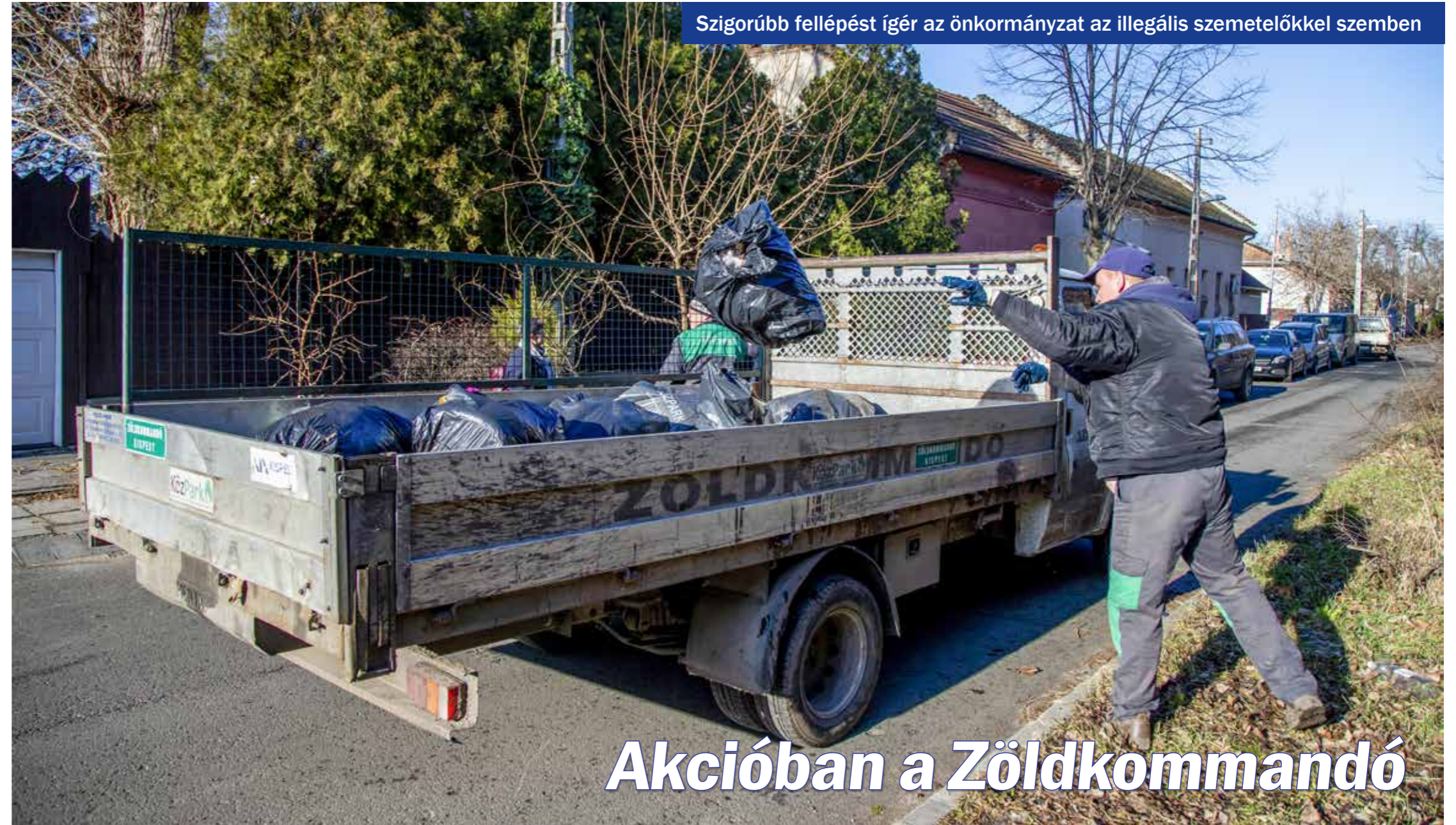
Szigorúbb fellépést ígér az önkormányzat az illegális szeméttel szemben