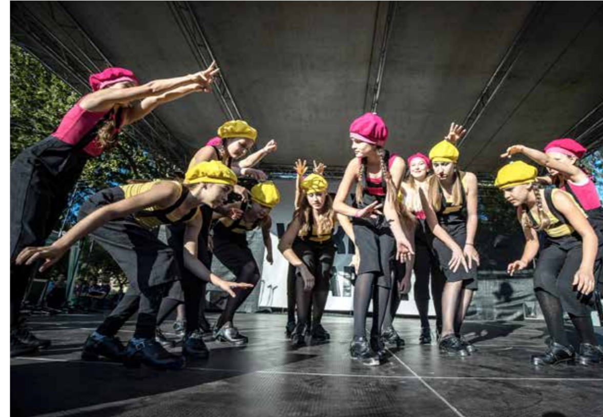
Egymást követték a látványos zenés, táncos produkciók

Huszonnyolcadik alkalommal rendezte meg Wekerletelep őszi fesztiválját az önkormányzat és más partnerek támogatásával, önkéntesek segítségével a Wekerlei Társaskör Egyesület.