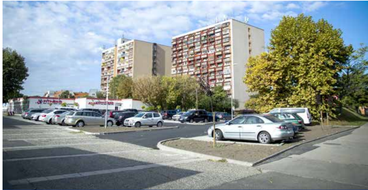
Ötven beállóhelyet építettek a pavilonok helyén

Ötven férőhelyes új parkolót épített az önkormányzat az Üllői út és a Berzsényi utca találkozásánál. A 30 millió forintos beruházással a terület rendezése mellett a környék parkolási gondjain is próbálnak enyhíteni. Látványos fejlesztések valósultak meg ezen a részen az elmúlt években.