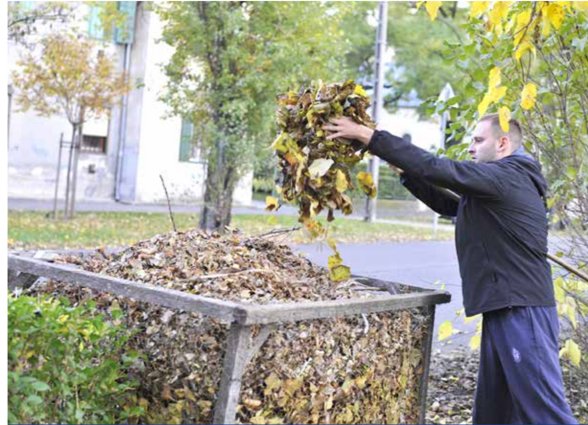
Október végén helyezik ki az avargyűjtő ketrecek

Kispest önkormányzata idén is segítséget nyújt az őszi avar összegyűjtésében és elszállításában. A 2019. évi lombgyűjtési akció időjárásától függően december közepéig tart.