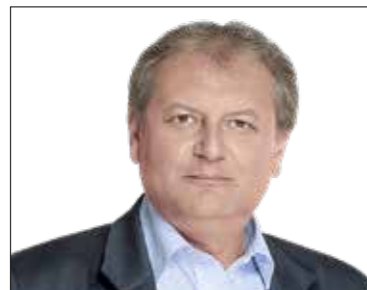
DR. HILLER ISTVÁN országgyűlési képviselő (MSZP)

Következő fogadóóráját 2019. október 10-én, csütörtökön 17 órától tartja a kispesti MSZP-irodában (XIX., Kossuth Lajos utca 50.). Előzetes bejelentkezés nem szükséges