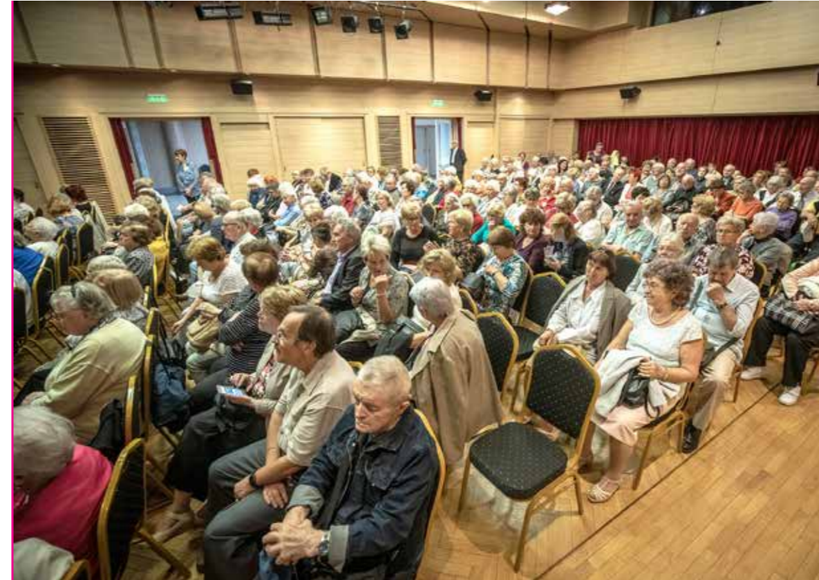
Ünnepi műsort rendeztek a KMO-ban a világnapon

Az idősek világnapján tizenegyedik alkalommal köszöntötte a kispesti időseket ünnepi műsorral az önkormányzat és a Segítő Kéz Kispesti Gondozó Szolgálat a KMO Művelődési Központban.