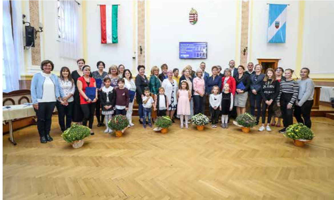
A Szébb Kispesti Környezetünkért pályázat idei díjazottjai

Az önkormányzat 21. alkalommal jutalmazta azokat a kispesti civilszervezeteket, közösségeket, intézményeket, amelyek programjai ösztönzik a legfiatalabb korosztályt a környezet ápolására, a meglévő természeti értékek megőrzésére.