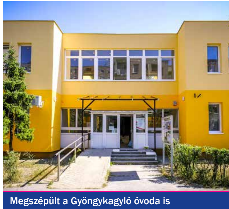
Megszépült a Gyöngyagyló óvoda is

A takarékos gazdálkodás mellett minden évben jutott forrás a kerület kiegyensúlyozott működtetésére, az intézmények színvonalas fenntartására és azokra a fejlesztésekre, melyeket a Polgármesteri Program alapján az adott évre ütemezett az önkormányzat. Összeállításunkban az elmúlt ciklusban megvalósult jelentősebb kispesti intézményfejlesztéseket vesszük sorra.