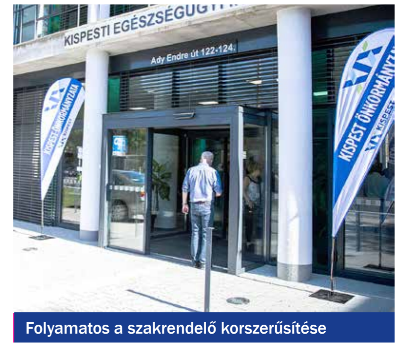
Folyamatos a szakrendelő korszerűsítése

Lakással és közösségi épülettel gyarapodott a Családok Átmeneti Otthona 2015-ben. Megújult a Segítő Kéz Kispesti Gondozó Szolgálat két egysége, az Őszirózsa Idősek Klubja és a Kertvárosi Idősek Klubja is. A tűzben megrongálódott Nyugdíjsház több tízmillió forintos kárelhárítása egyben az épület korszerűsítését is jelentette 2017-ben. Csaknem 9 millió forintot költött az önkormányzat a Magyar Vöröskereszt Ady Endre úti nappali melegedőjében lévő fürdőblokk felújítására. A Családok Átmeneti Otthonának 2018-ban megvalósult bővíté-