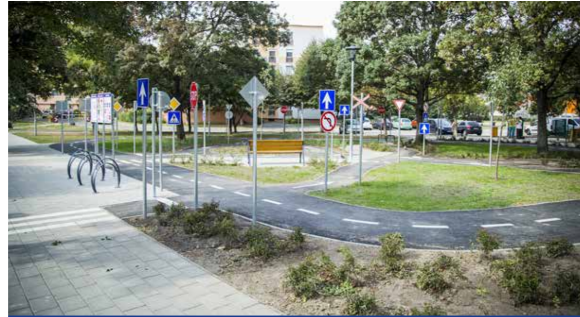
Négyezer négyzetméteres terület újult meg

Elkészült a kibővült funkciójú KRESZ-park a Kosárfonó utca – Vak Bottyán utca – Eötvös utca által határolt, csaknem 4000 négyzetméternyi területen, amelyet rövid ünnepség keretében adták át a kispesztieknek. Kétszázmillió forintból valósult meg a beruházás.