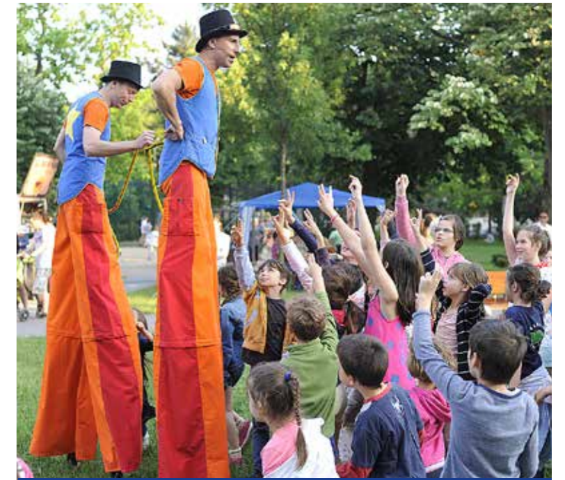
Közösségépítő hétvége Wekerlén

A dél-pesti fúvószenekarok találkozóját 2015 óta rendezi nyáron a KMO és a kultúrházban működő Obsitos Fúvószenekar, amelynek tagjai többségében egyenruhás zenekarok nyugállományba vonult hivatásos fúvószenészei. A különleges zenei programban a házigazda mellett a régió fúvósegyüttesei adnak színvonalas koncerteket. Wekerletelepen is több éves