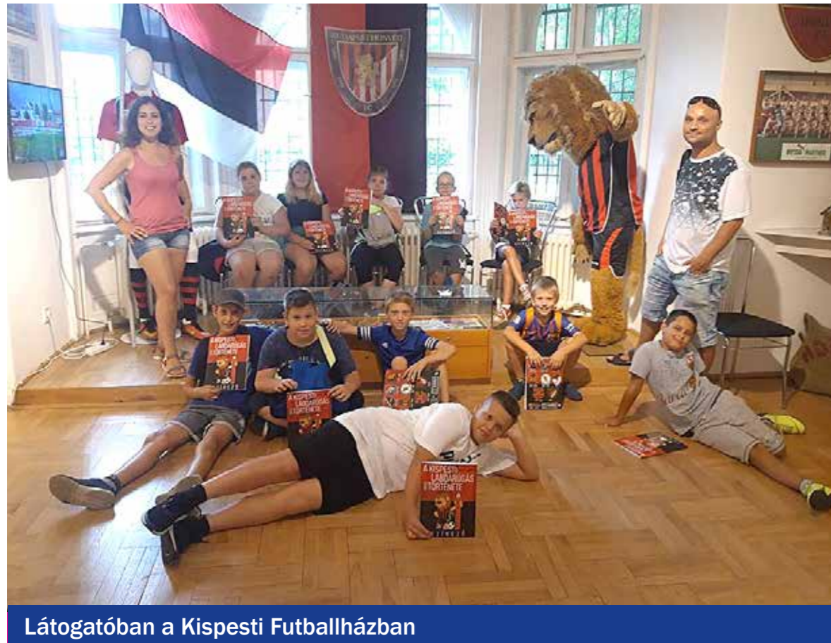
Látogatóban a Kispesti Futballházban

Lezárult a kilenches táborozás a kerület nyári napközis táborában, ahol naponta 120–150 kispesti gyerek tölthette szervezeten a vakációt. Az önkormányzati fenntartású tábor programjairól idén is a Wekerlei Kultúrház és Könyvtár munkatársai gondoskodtak.