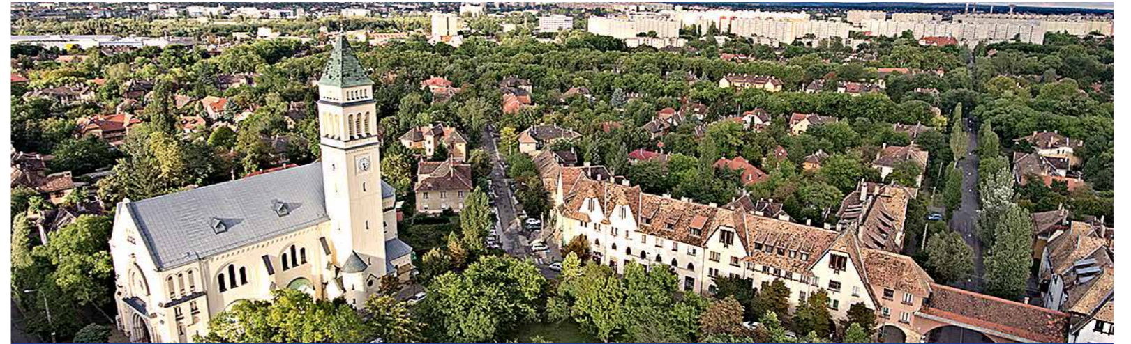
Várják a szabállyattal kapcsolatos észrevételeket

Lakossági fórumot tart az önkormányzat a Wekerletelep Kerületi Építési Szabályzatának tervezetéről augusztus 29-én 17 órától a Mátix Oktatási Központban.