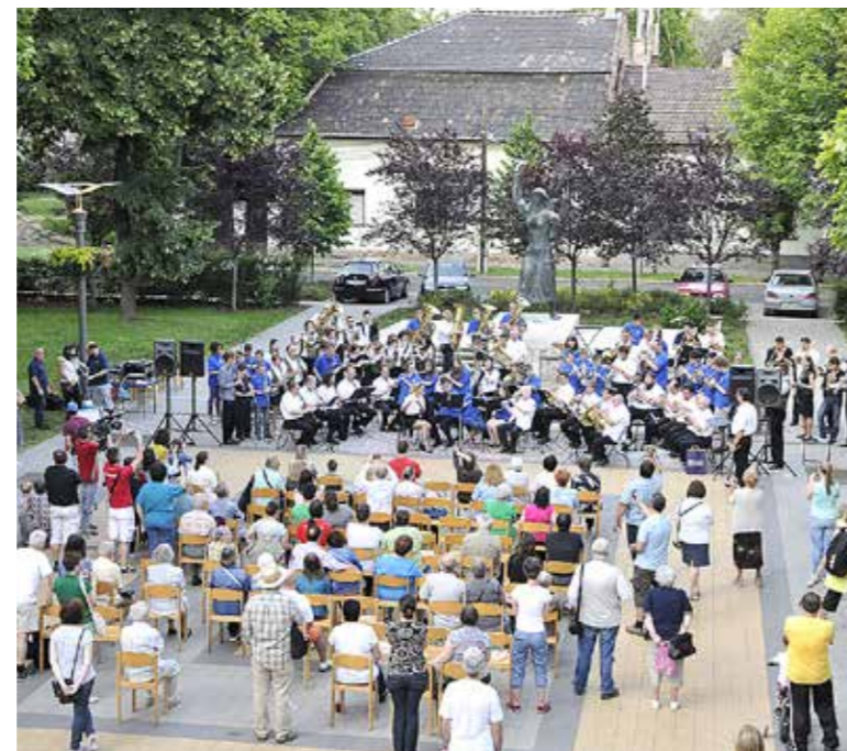
Fúvószenekari koncert a Városház téren

A Wekerleleszt Művészeti Találkozót 2011-ben indította el a Wekerlei Kultúrház és Könyvtár azzal a céllal, hogy közelebb hozza a művészetkedvelő közönséget Wekerletelep és Kispest kulturális értékeihez, az itt élő alkotókhoz és az alkotás folyamatához. A művészeti seregszemle alapvető koncepciója, hogy újszerű módon, interaktívan mutassa be a helyi művészeket. Képző- és zeneművészekkel, írókkal, költőkkel találkozhat ilyenkor a közönség. A folyamatosan