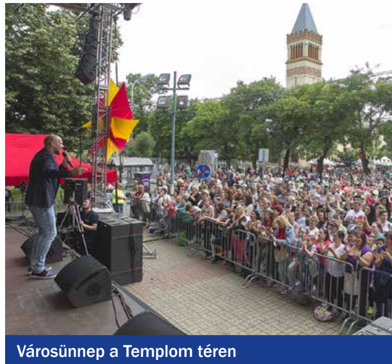
Városünnep a Templom téren

Kispest két meghatározó kulturális intézménye, a KMO Művelődési Központ, valamint a Wekerlei Kultúrház és Könyvtár Művelődési Ház (WKK) egész évben színvonalas programok sokaságával várja a kispesztieket. Népszerű szabadtéri rendezvények és fesztiválok, koncertek és ünnepek, felnőtt- és gyermekszínházi előadások, képzőművészeti kiállítások, helytörténeti tárlatok, irodalmi estek, tanfolyamok és klubok színesítik a kulturális palettát.