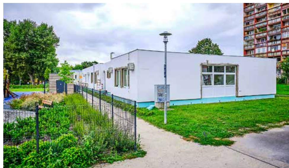
Teljes homlokzati szigetelést kap az épület

Kft. ügyvezető igazgatója. A legtöbb terméket az átlagos piaci árhoz képest 50 százalékos kedvezménnyel lehet kapni. Mivel a tanszervásárt az önkormányzat támogatja, ezért a kispestiek csak lakcímkártya felmutatásával vásárolhatnak. A gyereket nevelő családok már augusztus végén megkapják a szeptemberi családi pótlékot, a gyermekgondozást segítő ellátást és a gyermeknevelési támogatást – közölte az Emberi Erőforrások Minisztériuma. A kormány az előrehozott utalás mellett minden tanulóknak ingyen biztosítja a tankönyveket az 1–9. évfolyamokon.