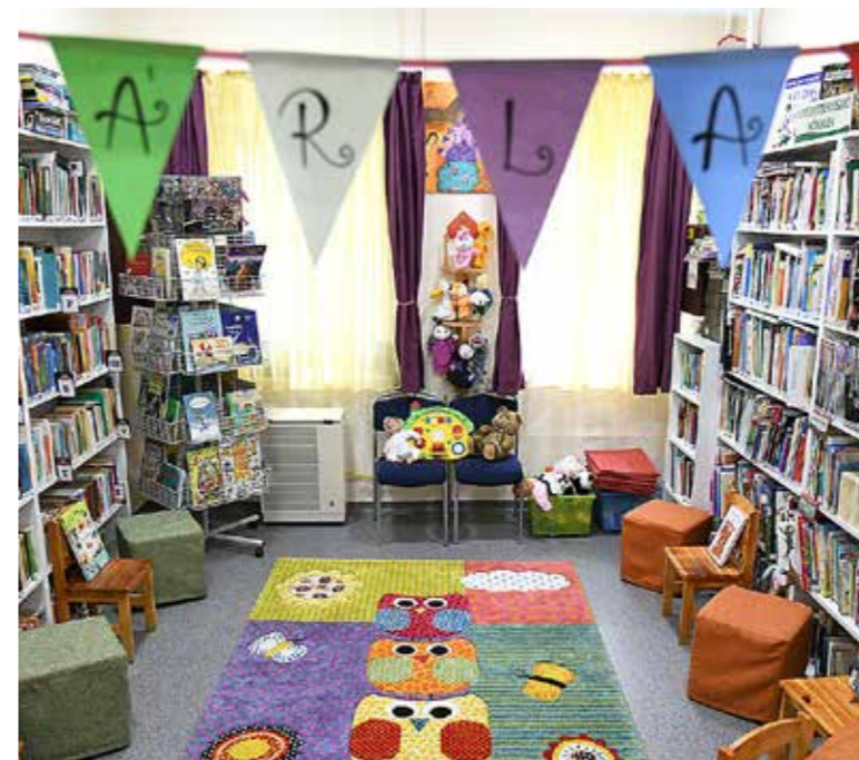
Új helyre költözött a Wekerlei Könyvtár

A kerületi képzőművészeket tömörítő Kispeshti Helikon Kulturális Egyesület tagjai egyéni és csoportos kiállításokkal színesítik Kispest kulturális életét. A kiállítások között különleges helyet foglal el a Helytörténeti Gyűjtemény állandó várostörténeti tárlata, valamint a Gyűjtők és gyűjtemények című kamarakiállítás-sorozata. A Nagy Balogh János Kiállítóteremben, a KMO Előter Galériájában és a Városháza Tárlaton a helyi alkotók mellett ismert hazai képzőművészek is bemutatkoz-