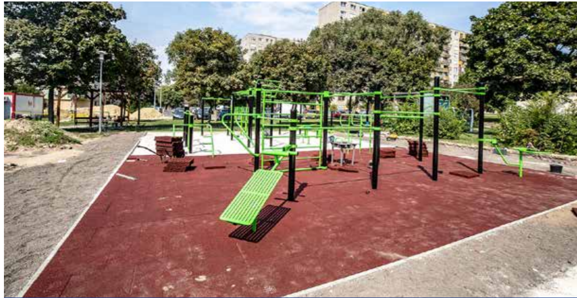
Ingyenesen lehet majd használni az eszközöket

Szeptemberben elkészül a sportpark a Csokonai utcában, a Vass iskola, a Bóbita óvoda és az Eszterlanc bölcsőde tőszomszédságában.