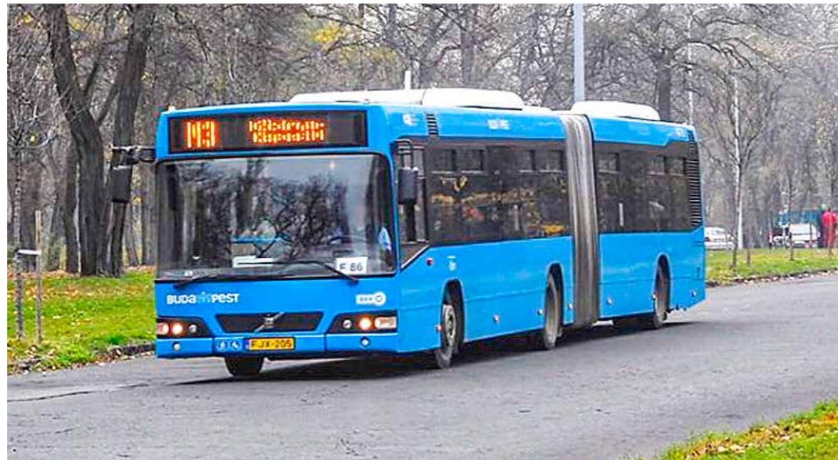
Pótlóbuszok közlekednek majd a KÖKI és a Nagyvárad tér között

Várhatóan március végén átadják a 3-as metró északi, felújított szakaszát, és egy héttel később már le is zárják a déli szakaszt. Részletes tájékoztatót adott ki a BKK a rövidesen életbe lépő változásokról.