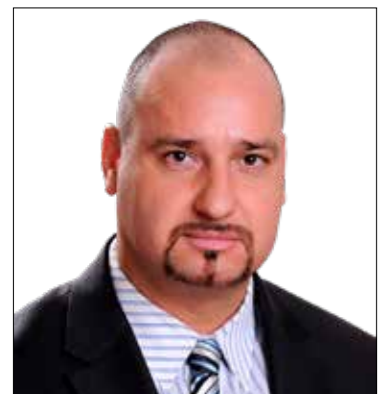
Lázár Tamás (Jobbik)

nyújtást elsősorban azok a 65 év feletti, krónikus betegségben szenvedő lakosok vehetik igénybe, akik egyedül élnek, és rosszul vagy baleset esetén nem rendelkeznek segítséggel. A szolgáltatás biztonságossá teszi az időseket, a fogyatékkal élők és pszichiátriai betegek életvitelét saját lakókörnyezetükben, és szükség esetén életet menthet. Az önkormányzat települési támogatás keretében biztosítja a 65 év feletti nyugdíjasok kutyájának kötelező veszettség elleni védőoltását is. Kiemelten fontosnak tartjuk a személyes kapcsolat ápolását is az idősekkel. Kiscesten évek óta nagy sikerrel indulnak az olyan kedvelt programok, mint az ingyenes nyelv- és számítógépes tanfolyamok vagy a Senior Akadémia, amelyek a családdal és a környezettel való könnyebb kapcsolattartást és a szellemi tréninget szolgálják. A nyugdíjasok civilszervezetei működési támogatásra pályázhatnak, összejöveteleikhez helyiséget biztosít nekik az önkormányzat, és a legalább fél évszázada együtt élő párokat is minden évben köszöntjük.