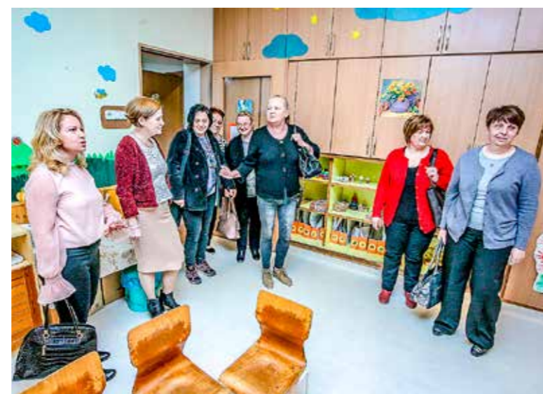
Zomborból érkeztek a Mese-Vár óvoda vendégei

és kulturális ügyekért felelős segédpolgármestere is nagy örömmel üdvözölte a kezdeményezést, egyúttal meghívta egy városlátogatásra a Mese-Vár óvoda pedagógusait. A szerb önkormányzat és a kerületi önkormányzat évek óta sokat dolgozik azért, hogy Kispest és Zombor 2002 óta élő együttműködése még színesebb és eredményesebb legyen – mondta Ruzs Boriszláv, a nemzetiségi önkormányzat elnöke a találkozón. Az óvodások magyar és szerb gyermek- és népdalokból, mondókákból adtak műsort a vendégeknek.