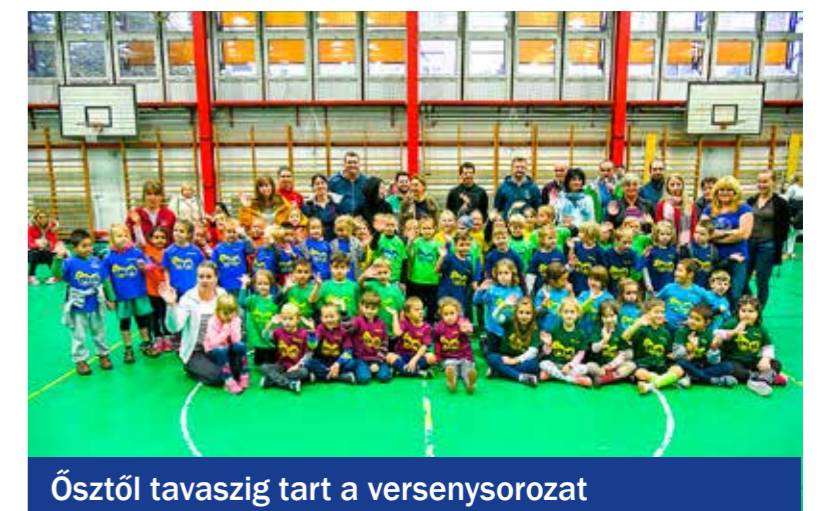
Ősztől tavaszig tart a versenysorozat

megismerhetik a sportolási lehetőségeket Kispesten, az egyesületi szakemberek pedig megfigyelhetik és kiválaszthatják a tehetségeket. A négy központi foglalkozást és az óvodai felkészítéseket követően hét versenyszámban mérkőznek meg a csapatok, a tavaszi döntőben a legjobbak mutathatják meg ügyességüket.