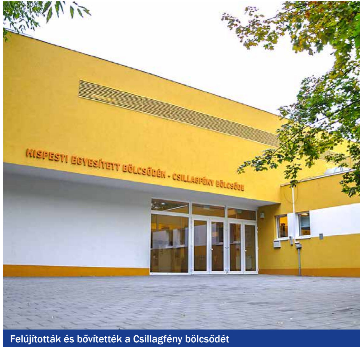
Felújították és bővítették a Csillagfény bölcsődét

nan épült földszinti szárnyában lépcsőházat, közlekedőt, tornaszobát, három csoportszobát, sószobát, orvosi fejlesztőt és mozgássérült WC-t építettek ki, emellett részlegesen felújították a melegítőkonyhát is. Az emeleti részbe költöztek az irodák, két fejlesztőszoza és egy nevelői szoba. Saját forrásból