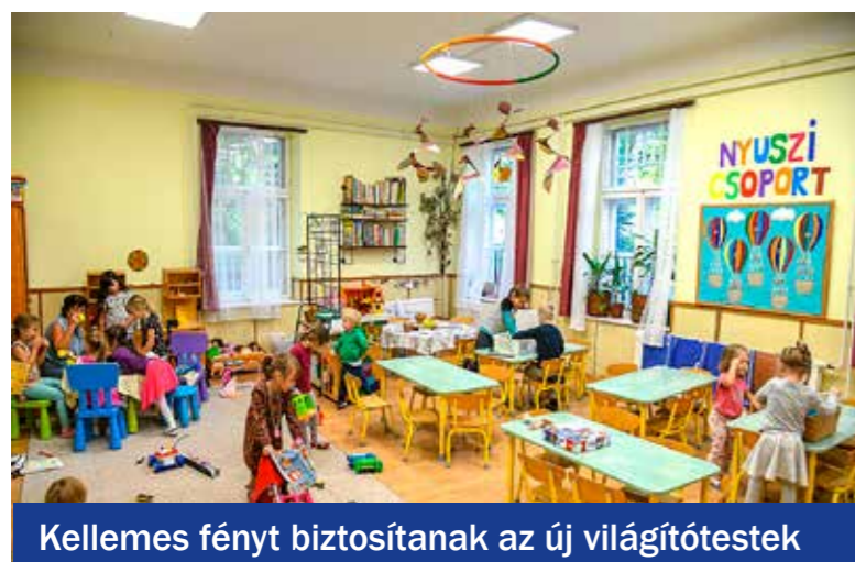
Kellemes fényt biztosítanak az új világítótestek

értékben történtek korszerűsítések, felújítások 2017-ben az Árnyas óvoda mindhárom tagintézményében, a Bóbita óvodában, a Százszorszép óvodában, a Szivárvány óvodában, a Mézeskalács óvoda Kelet utcai tagintézményében, a Mese-Vár óvodában, a Napraforgó óvodában és a Zöld Ágacska óvodában. A Mese-Vár óvoda Zrínyi utcai épületében 15 millió forint értékben új tornaszobát, öltözőt és fürdőblokkot alakítottak ki, valamint felújították a melegítőkonyhát. Négy bölcsődében – Bokréta, Csillagfény, Eszterlanc, Harangvirág – több mint 80 millió forint értékben végeztek felújításokat.