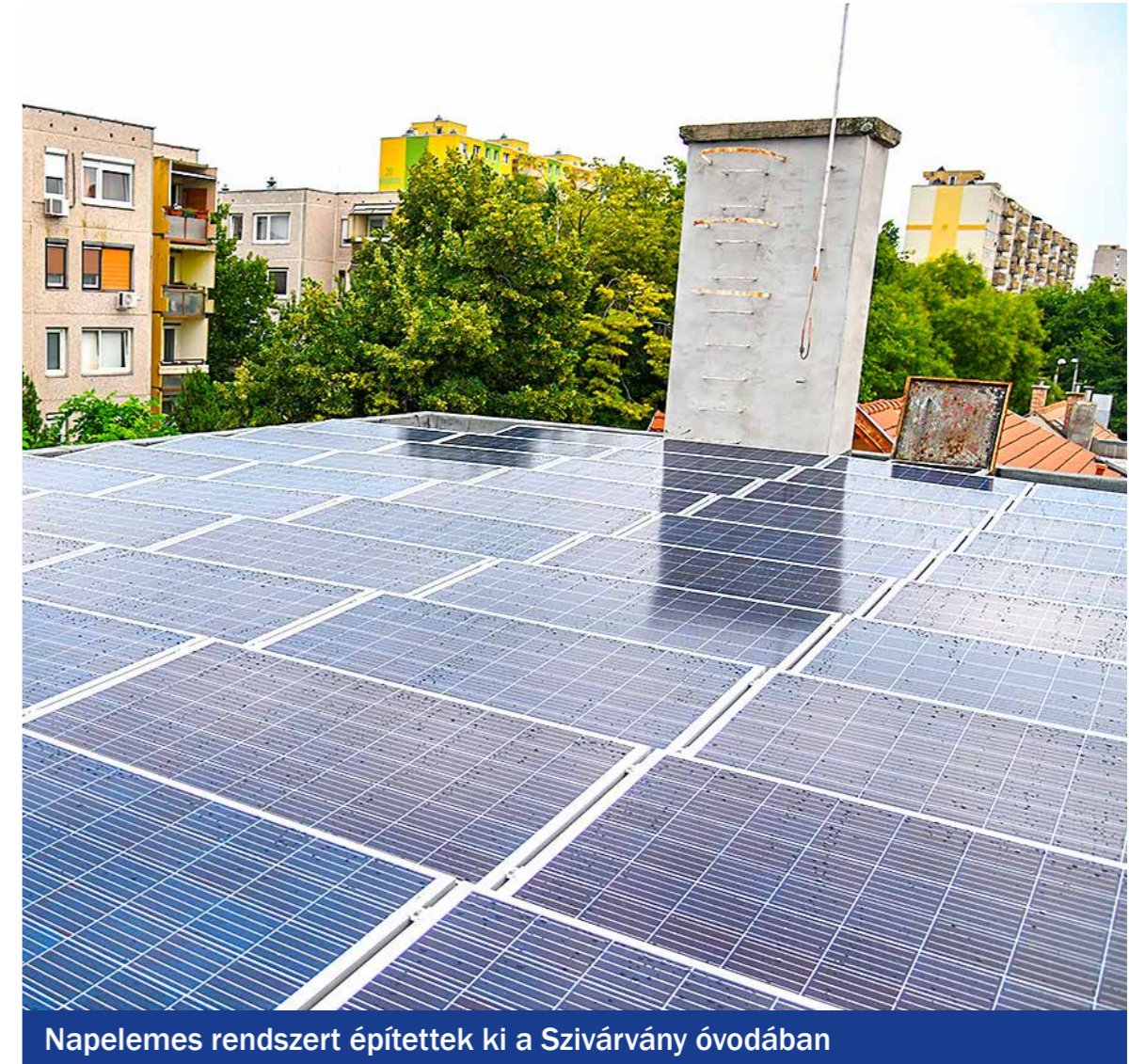
Napelemes rendszert építettek ki a Szivárvány óvodában

sítést automata öntözőrendszer telepítésével, valamint gumiburkolat készítését a játékok alá. A beltérben megtörtént a PVC-burkolat és a mázaskerámia-burkolat kialakítása a vizesblokkokban, konyhában, laminált parketta és Grabo sport lefektetése az irodákban és a tornaszobában, csempeburkolat készítése, a falfelület diszperziós festése és a felújított beltéri nyílászárók festése. A gépészeti felújítás keretében elvégezték a vízvezeték cseréjét, a megmaradt fűtési vezeték átmosását, a radiátorok cseréjét és új radiátorszelepek beépítését, a teljes elektromos hálózat felújítását és a világítás korszerűsítését LED-fényforrásokra. Ezekon kívül a konyhába és az irodák-