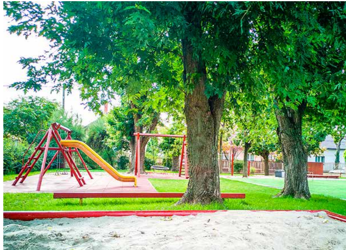
Megújult a Beszterce utcai óvoda udvara is

A kispesti általános iskolák után megkezdődött az óvodák felújításának korszerűsítése