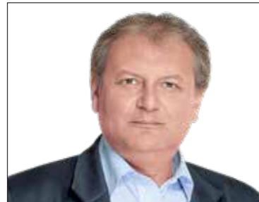
DR. HILLER ISTVÁN országgyűlési képviselő (MSZP)

Következő fogadóóráját 2019. április 11-én, csütörtökön 17 órától tartja a kispesti MSZP-irodában (XIX., Kossuth Lajos utca 50.). Előzetes bejelentkezés nem szükséges