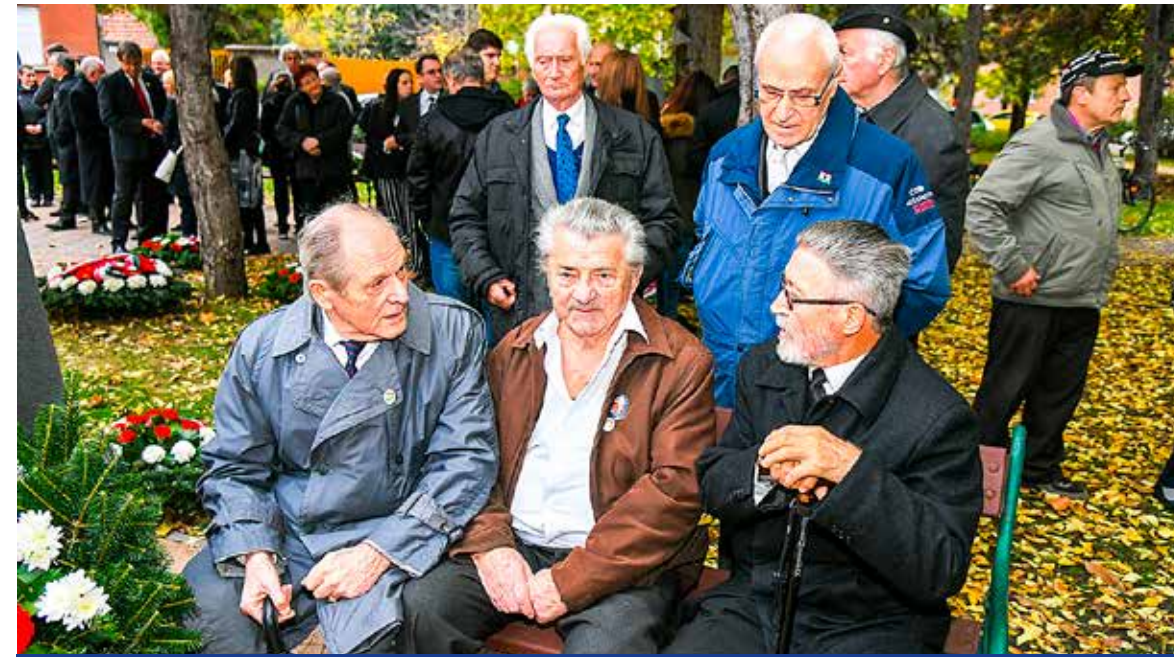
Kispeszt '56-os forradalmárok az ünnepségen

Az 1956-os forradalom és szabadságharc évfordulója alkalmából az Ötvenhatosok terén tartott ünnepséget Kispeszt Önkormányzata.