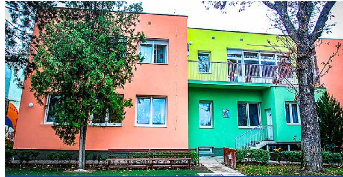
Hőszigetelést kapott a színesre festett homlokzat

Önkormányzati forrásból, állami támogatással újult meg szinte teljesen a Petőfi utcai Szivárvány óvoda. A korszerűsítés részeként napelemes rendszert építettek ki az intézményben.