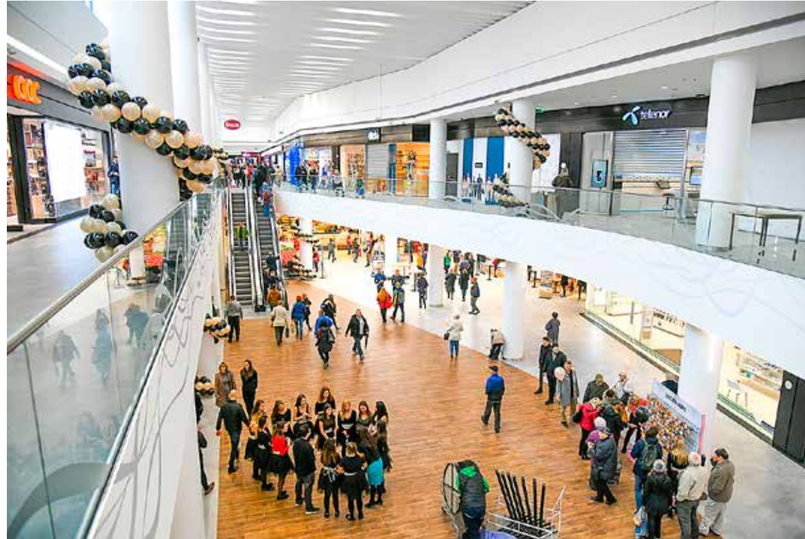
Kívül-belül megújult a több mint húszéves épület

Féléves átalakítási munka után újra megnyitotta kapuit a kerület kapujában álló, 24 ezer négyzetméteres bevásárlóközpont, a Shopmark. Magyarországon először valósult meg egy bevásárlóközpont teljes átépítése.