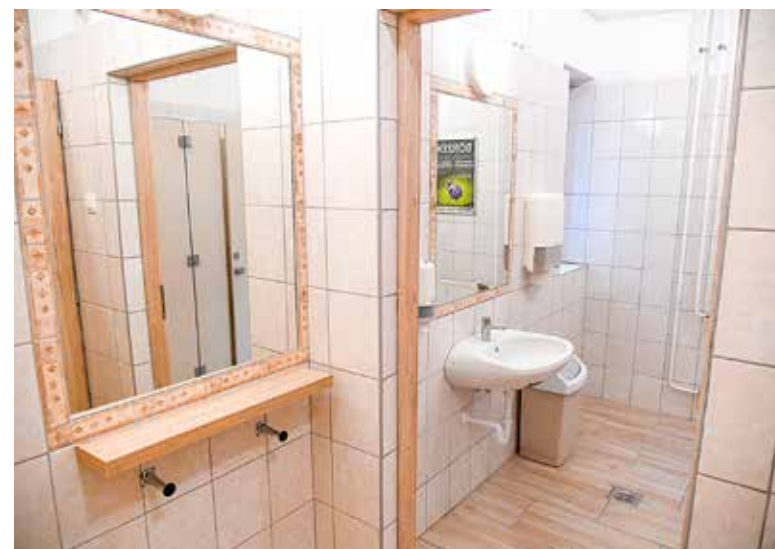
Korszerűsített vizesblokk a Teleki utcában

a Fő utcai Kispesti Kaszinóban felújították a mosdót, a Szabó Ervin utcai Mozgásműhelyben pedig a lapos tetős épületrész szigetelését végezték el. Mindig törekszünk rá, hogy megőrizzük az intézmény újszerű állapotát, hogy jól érezzék magukat nálunk a kispestiek – fogalmazott az intézményvezető.