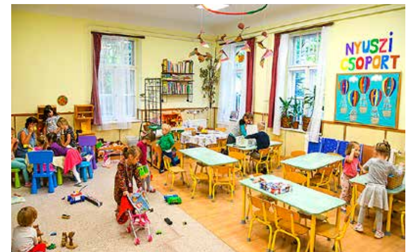
Energiaatakarékosra cserélték a teljes világítást

felújítása és a világítás korszerűsítése. Az udvar 160 négyzetméteren kapott gumiburkolatot és a hátsó homokozó körül is gumiborítást alakítottak ki, ezeken kívül 114 négyzetméternyi részt térköveztek le. Egy játszóvárat és – a régi helyett – egy új tárolót is kapott az óvoda. A több mint 300 négyzetméternyi mennyezet festése mellett a teljes világítást is energiatakarékosra cserélték: 57 LED-es lámpatest, 6 halogén izzólámpás és 4 kültéri vízmentes LED-es lámpatest biztosítja a fényt az óvodában.