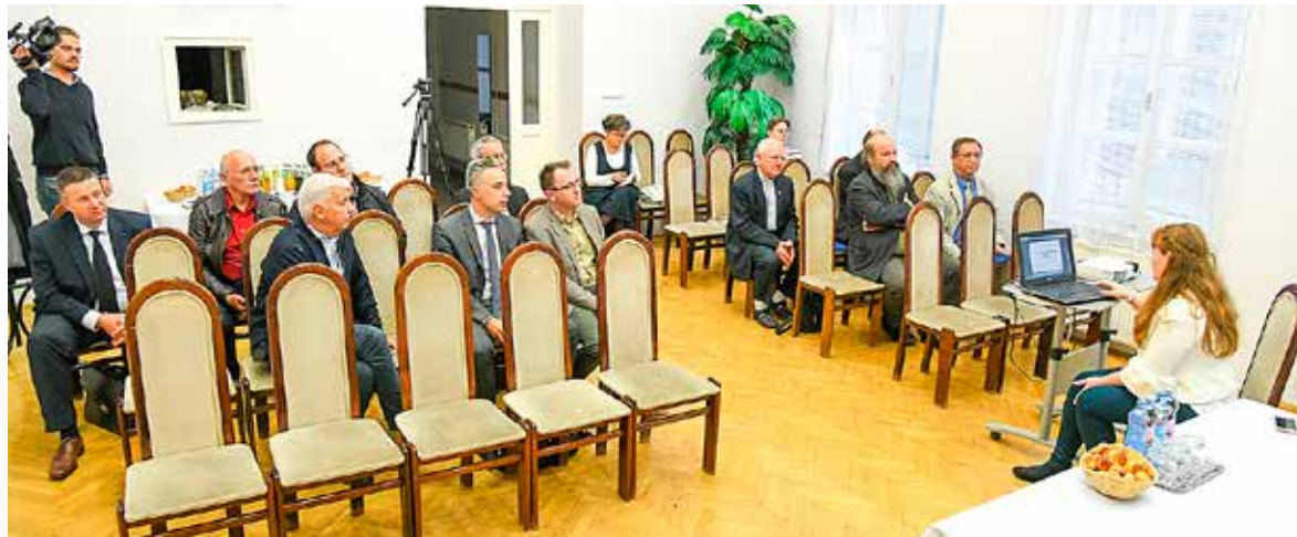
Az adományleveleket a Városházán tartott egyházi fórumon adták át

Idén összesen hatmillió forint önkormányzati támogatásra pályázhattak a kerületben működő egyházak épületeik, ingatlanjaik felújítására.