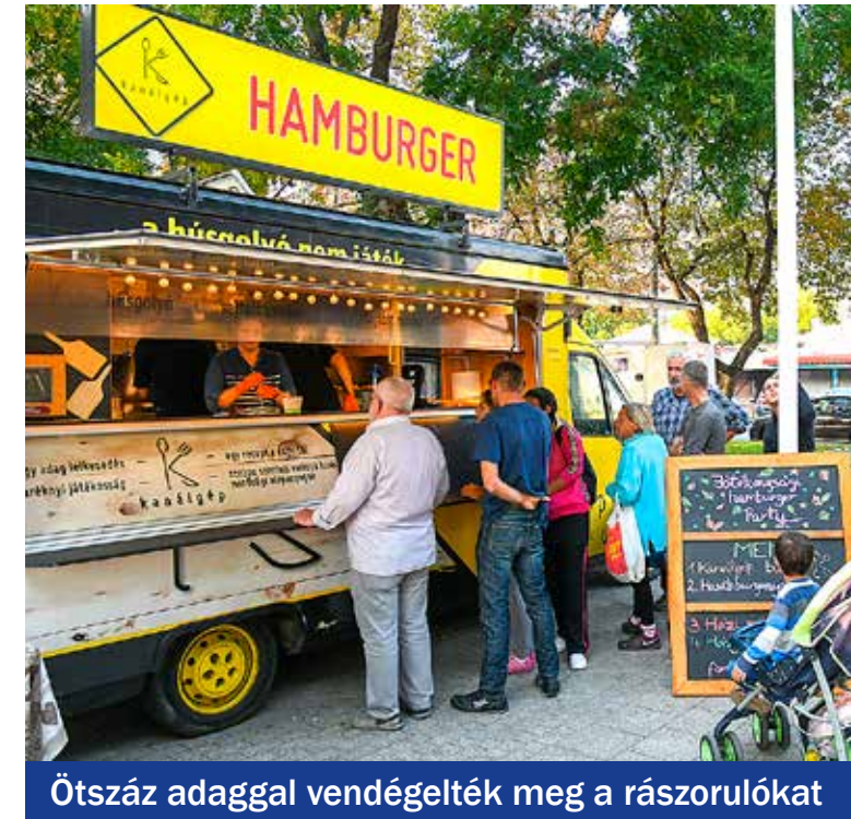
Ötszáz adaggal vendégelték meg a rászorulókat

Helyi vállalkozások, civilek és az önkormányzat összefogásával ötszáz adag étellel vendégelték meg a rászoruló kispesztieket a Kossuth téren.