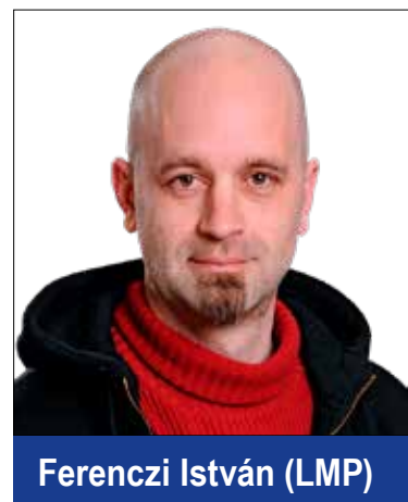
Ferenczi István (LMP)

keretösszeggel egyenként 6, összesen 42 millió forint áll rendelkezésre a megvalósításához. Már eddig is számos javaslat érkezett mind a hét területre, és október 31-ig további lehetőség van a jelölésre. Minden vélemény, javaslat fontos az önkormányzat számára, ugyanakkor az önkormányzat hatáskörén kívül álló kérések továbbításra kerülnek a fővárosi szakmai szervezeteknek. Ezúton is biztatok minden kispesztit, hogy tegyen javaslatot elképzeléseinek megvalósítására, ezzel is hozzájárulva a kerület fejlődéséhez.