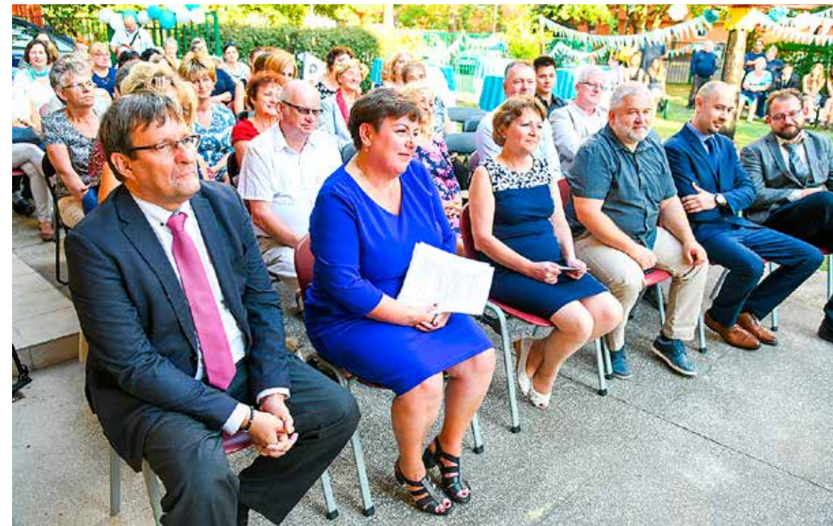
Kerti ünnepséget tartottak a Táncsics utcában

Megalakulásának 20. évfordulóját ünnepelte a Kispesti Szociális Szolgáltató Centrum.