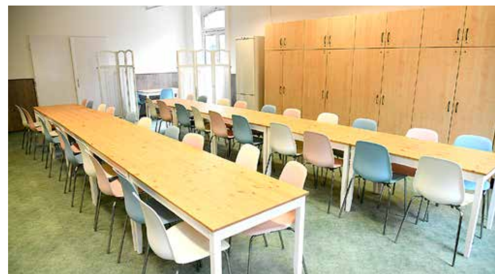
Tiszta, rendezett környezetben ebédelhetnek a gyerekek