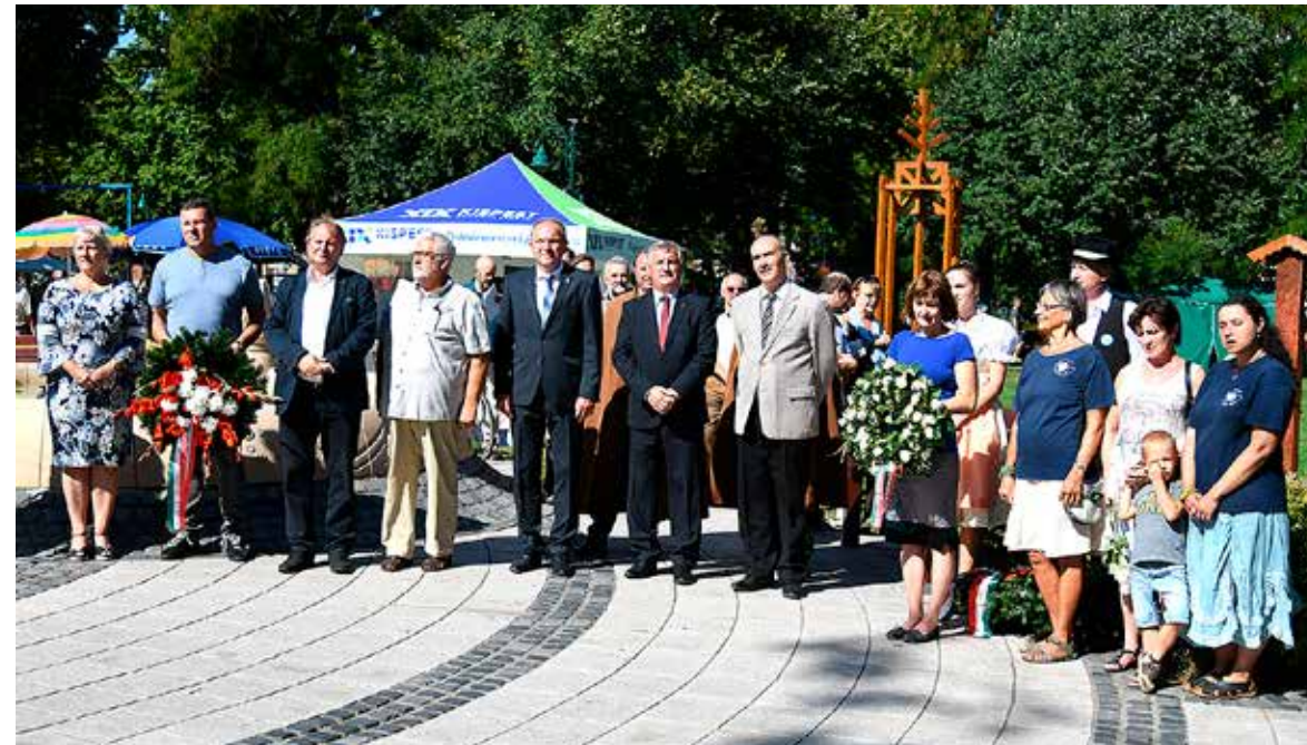
Koszorúzás Wekerle Sándor szobránál a Kós Károly téren

Huszonhetedik alkalommal rendezte meg Wekerletelep őszi kulturális fesztiválját az önkormányzat és más partnerek támogatásával, önkéntesek segítségével a Wekerlei Társaskör Egyesület szeptember harmadik hétfőjén.