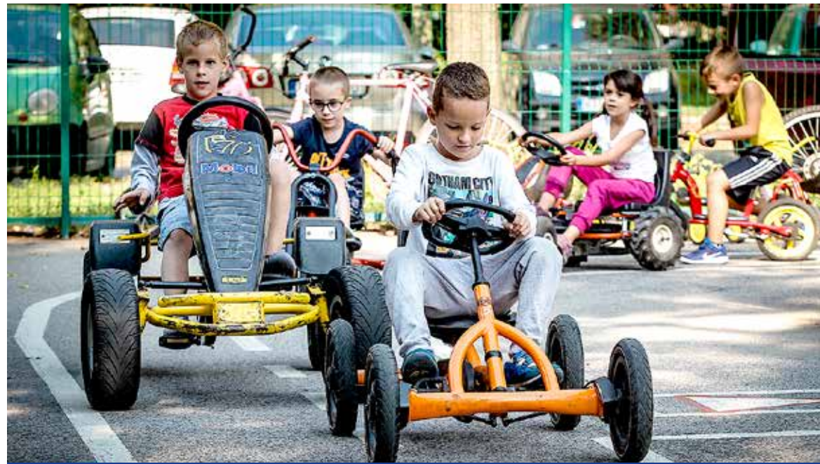
Játékos programok várták a gyerekeket

Új helyszínen, a József Attila utca és a Hunyadi utca sarkán lévő mini KRESZ-parkban tartotta az idei autómentes nap kerületi rendezvényét az önkormányzat. Négy-négy óvodából és iskolából csaknem háromezren vettek részt a programon.