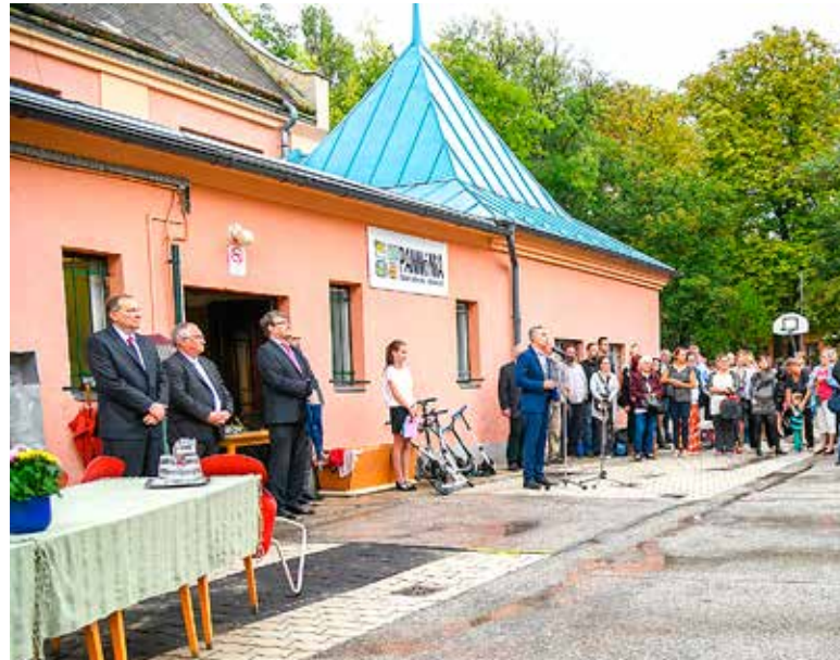
Kispesten négyszáz kisdíák kezdte az első osztályt

Hamarosan birtokba vehetik az elkészült új tantermeket a Pannónia Általános Iskola tanulói: tanévkezdetre elkészült a tetőtér-bővítés. A kerületi tanévnyitó az olykor szemerkélő esőben az iskola énekkarának és színjátszó csoportjának műsorával, valamint az elsősök szavalataival kezdődött.