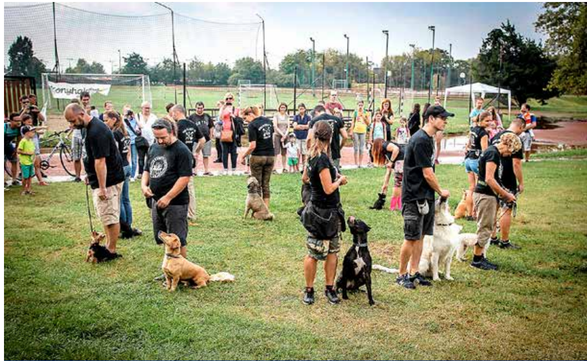
Kutyás bemutatók is színesítették a programot