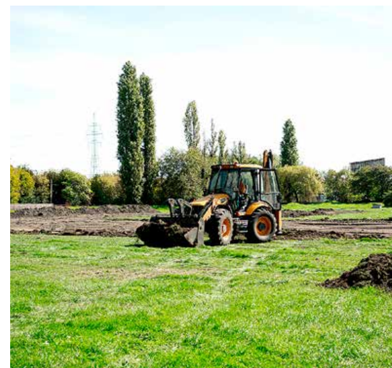
Műfüves focipályát és futókört alakítanak ki

Elindult a Katona József utcai Önkormányzati Sporttelep, a KAC-pálya felújítása. A beruházást a Magyar Labdarúgó Szövetség (MLSZ) finanszírozza, bruttó költsége 220 millió forint. Az MLSZ-szel kötött együttműködési megállapodás