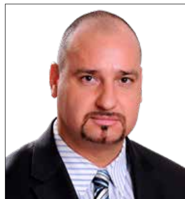
Lázár Tamás (Jobbik)

szülők számára biztosít átmeneti jelleggel lakhatást. Az egészségügyi és szociális ellátást, valamint a foglalkoztatást is integráló Forrásház működése büszkeségre ad okot, ugyanakkor külföldön jobban ismerik és elismerik, mint itthon. Külön kiemelném a helyi szervezetek és intézmények együttműködését, amely szintén hozzájárul ahhoz, hogy az országos állapotokkal szemben Kiscesten kicsit jobb a helyzet a szociális ellátás területén. Ugyanakkor a legnagyobb problémát továbbra is az jelenti, hogy a kilátástalan helyzetben lévő, mélyszegénységben élő emberek sorsának javítására nincsenek állami programok.