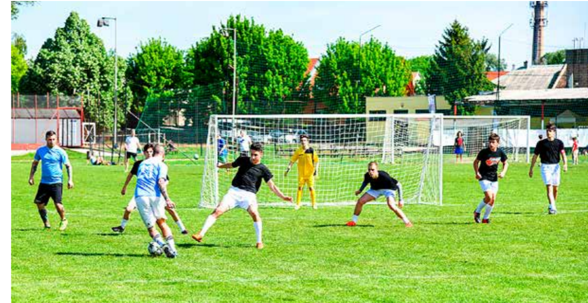
Rövidesen kezdődik a sportpálya felújítása

A jelenlegi füves futballpálya helyén nagyméretű, műfüves pályát, valamint ötsávós, szintén világítással ellátott futókört építenek, és a meglévő négy öltöző felújítása mellett két újat is kialakítanak a Katona József utcai Önkormányzati Sporttelepen.