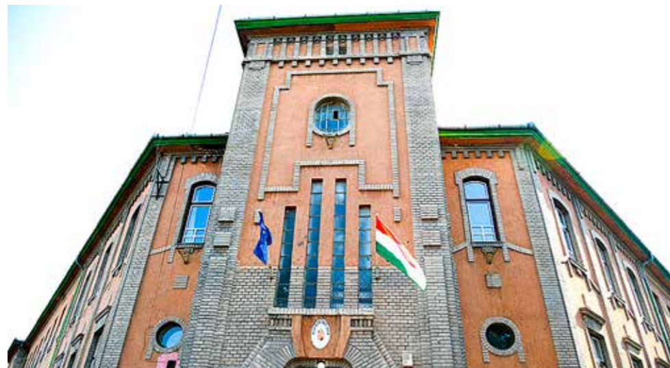
A Pannónia iskola az egyik új tetőtéri tanterembe vásárolt számítástechnikai eszközöket