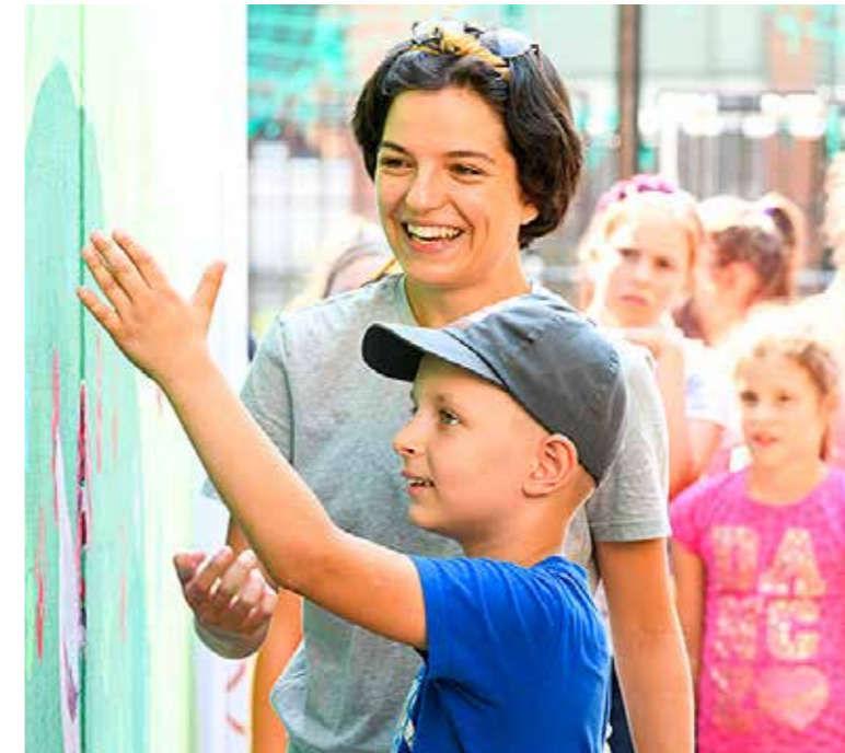
A „Kispesti Kóficok” festették színesre a Batthyány utcai épület tűzfalát

Kilenc héten keresztül tartott idén is a kerületi napközis tábor, melyet az önkormányzat támogatásával évről évre a Wekerlei Kultúrház és Könyvtár szervez. Az önkormányzati fenntartású tábor tartalmas, élménydús nyári programok helyszínévéként számtalan kalandos kirándulást, múzeumlátogatást, élményparkos és egyéb programot nyújtott a kispesti gyerekeknek.