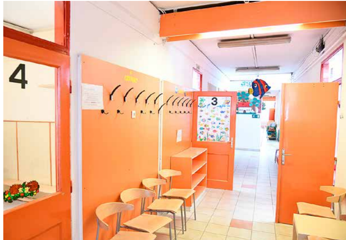
Idén is félmilliárd forintot fordít intézménykorszerűsítésre az önkormányzat

Elkötelezett szándékunk a kerület oktatási-nevelési intézményeinek folyamatos korszerűsítése, karbantartása azért, hogy gyermekeink minél jobb körülmények között tudjanak nevelkedni, fejlődni, tanulni. Ennek érdekében Kispeszt önkormányzata idén is 500 millió forintot biztosít a kerületi óvodák, bölcsődék, iskolák, egészségügyi és szociális intézmények felújítására. Az önkormányzat intézményfelújítási programjának keretében idén tavasszal korszerűsítették a Wekerlei Tipogók Bölcsőde vizesblokkját és főzőkonyháját. Nyáron befejeződött a Kispesti Mézeskalács Művészeti Modell Óvoda Beszterce utcai tagintézményének korszerűsítése, míg az óvoda Kelet utcai épületében elvégezték a vizesblokkok és a konyha felújítását. A Zöld Ágacska óvodában az udvart és a vizesblokkokat újították fel, a Szivárvány óvoda épületének tetejére napelemeket szereltek, s rövidesen befejeződik a világítás korszerűsítése és az udvar felújítása a Tarkabarka óvoda Dobó Katica utcai épületében. Az idei