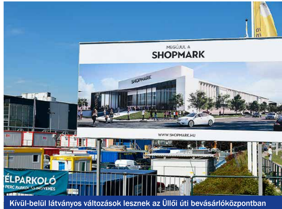
Kívül-belül látványos változások lesznek az Üllői úti bevásárlóközpontban

Az októberre tervezett nyitáskor közel 80 új üzlet és szolgáltató várja a kispestieket is a teljesen megújult Shopmarkban. Az újragondolt épület üzleteinek csaknem 90 százaléka már gazdára talált.