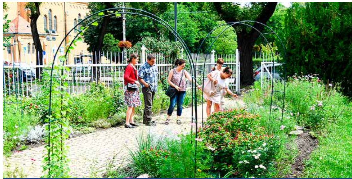
A szakmai zsűri is elismeréssel szólt a Zöldprogramról

Első helyezést ért el Kispeszt a Magyar Turisztikai Ügynökség Zrt. által meghirdetett Virágos Magyarországért környezetszépítő verseny „Legvirágosabb úti cél 2018” játékában, a budapesti kerületek közönségszavazásán. A Nagykőrösről érkezett szakmai zsűri is elismeréssel szólt a kispeshti Zöldprogramról.