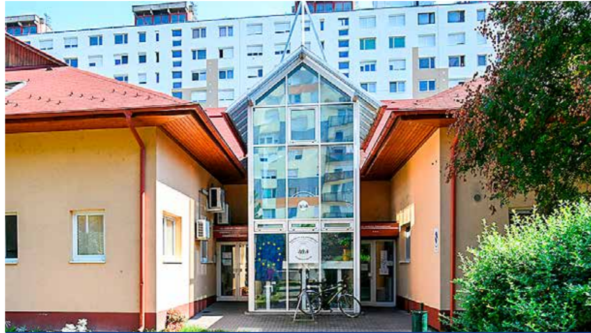
Szociálisan rászoruló családoknak nyújtanak segítséget

Kispest önkormányzata támogatást nyújt a közüzemi díjhátralék megfizetéséhez, annak érdekében, hogy a szociálisan rászorultak lakhatásának biztonságát elősegítse, a lakhatással kapcsolatos költségeiből származó adósságterheket enyhítse. Az adósságcsökkentési támogatás a szociálisan rászoruló személyek részére nyújtott, a lakhatási kiadások kapcsán keletkezett lakbér- és különszolgáltatási díj-, vezetékes gázszolgáltatási díj-,