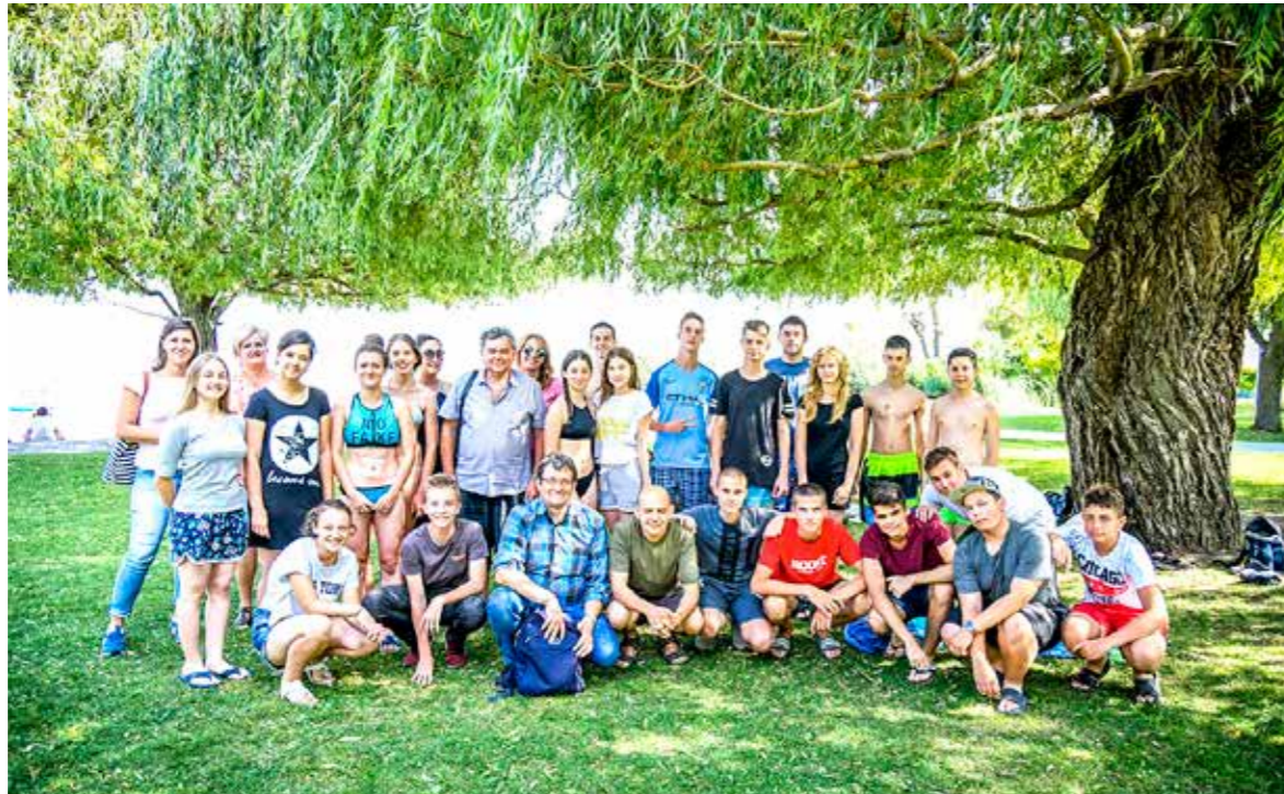
Egy hetet töltöttek a Balatonnál a külföldi fiatalok