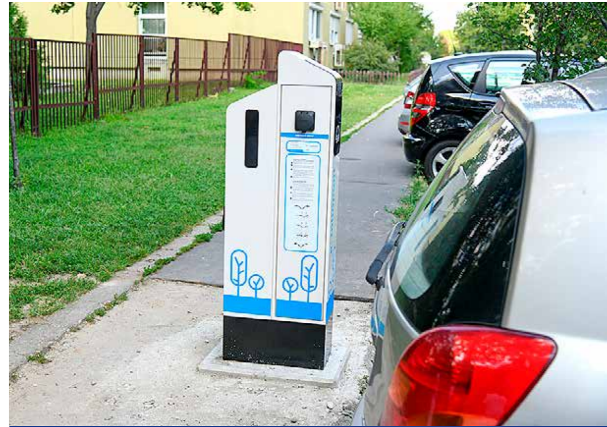
Hét helyszínen létesítenek e-kutakat a kerületben

Az elmúlt hetekben megkezdődött az elektromos töltőállomások telepítése Kispeshten. Mivel az elektromos autók elterjedése ugrásszerű lesz az elkövetkező években, ezért idén májusban döntött a képviselő-testület azokról a helyszínekről, ahol e-kutak épülhetnek.