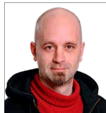
Ferenczi István (LMP)

elsősorban a nyári táborozásra, sportösztöndíjakra, testvérvárosi csereüdvözlőkre, a rászorultak ingyenes étkeztetésére, valamint a kitűnő tanulók külföldi jutalomutazására. Ami további segítséget jelentene a családoknak, az az ingyenes fűtőcsomagok kiterjesztése a 8. osztályig, most ugyanis csak 1-5. osztályig jár. Fejlesztene kéne az iskolai könyvtárakat is, hogy minden évben új könyveket tudjanak venni a gyerekeknek, és a kötelező olvasmányok minél nagyobb példányszámban álljanak rendelkezésre. Szintén hasznosnak tartanám, ha az önkormányzat felvenné a kapcsolatot a budapesti színházakkal, és gyermekeinknek kedvezményes színházlátogatást tudnánk biztosítani. A következő évi költségvetés elkészítésénél kezdeményezni fogom ezeknek a javaslatoknak az elfogadását.