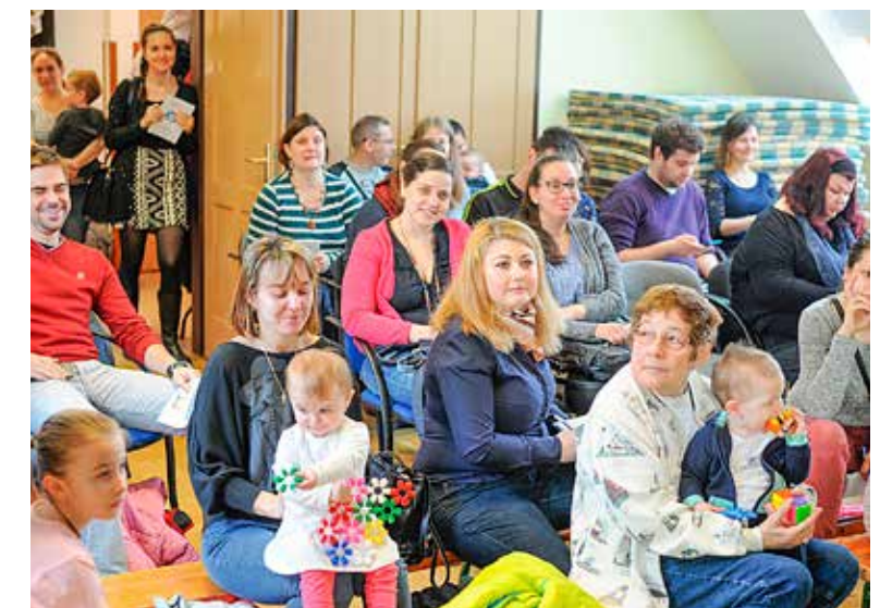
Sokan gyermekeikkel együtt érkeztek

el a gyermekek felügyeletét 6 hónapostól 3 éves korig. A gyermekfelvétel minden hónap második szerdáján 9–15 óra között a Csillagfény bölcsődében (1191 Bp., Eötvös utca 11.) történik. Az intézményvezető tájékoztatóját követően a részlegvezetők mutatták be az egyes bölcsődéket, majd az érdeklődő szülők kérdéseit válaszolták meg. Sokan gyermekeikkel együtt érkeztek, akikkel a kötetlen beszélgetés ideje alatt a játszószőnyegen tölthették el az időt. A kispesti bölcsődékkel kapcsolatos tudnivalók a www.kispest.hu honlapon olvashatók.