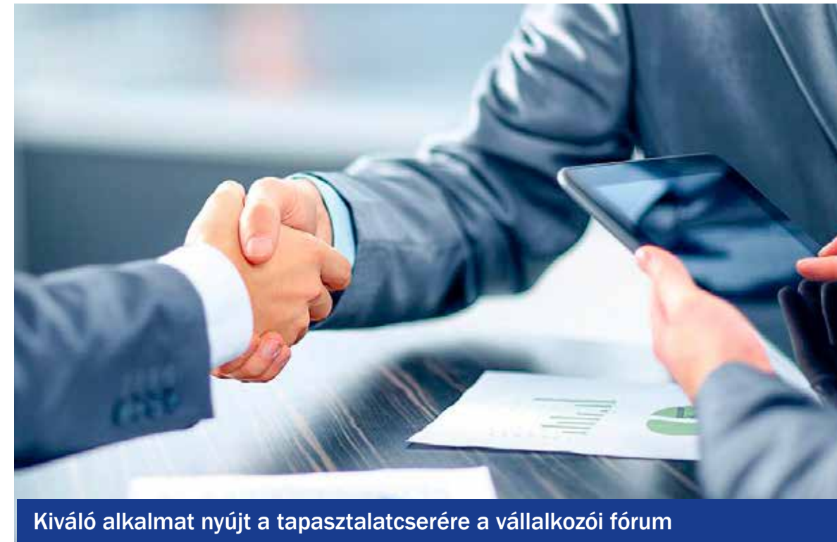
Kiváló alkalmat nyújt a tapasztalatcsere a vállalkozói fórum

„Mi fán terem a stratégia? – Első lépések a siker felé” címmel a IV. Kispesti Üzleti Találkozót rendezi Kispest Önkormányzata és a KMO Művelődési Ház 2018. március 23-án, pénteken 10 és 14 óra között a Kispesten és környékén élő és tevékenykedő vállalkozók, intézményekben dolgozók részére.