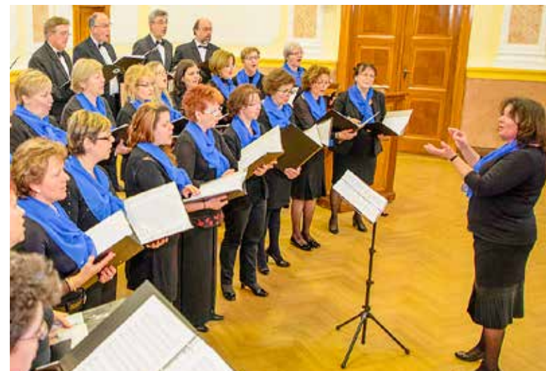
Idén a Gyöngyvirág kórus kapott elismerést

Kiemelkedő közművelődési tevékenységéért a Kispesti Vegyeskar – „Gyöngyvirág” kórus kapott elismerést a magyar kultúra napja alkalmából rendezett ünnepségen a Városházán.