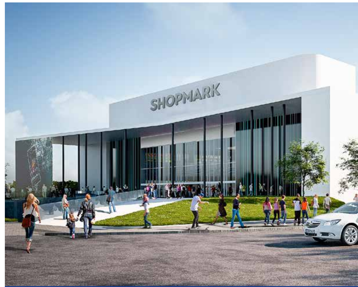
Kívül-belül látványos változásokat ígérnek

A külső kivitelezési munkálatokkal megkezdődött a Shopmark renoválása. A meghívásos, háromfordulós tender eredményeként a KÉSZ Építő Zrt. végzi a bevásárlóközpont átépítését. A külső felújítási periódus alatt, április 22-ig az épület látogatható marad a vásárlók számára.