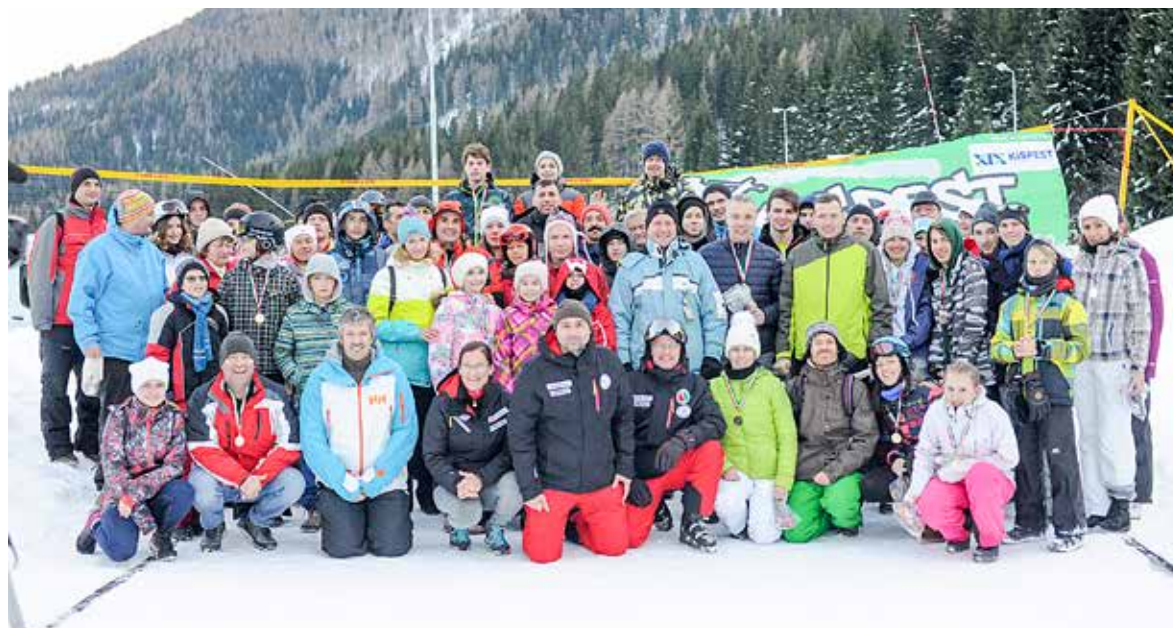
A VII. Kispesti Winter Fun résztvevői

A VII. Kispesti Winter Fun ifjúsági és felnőtt síversenyt az ausztriai Präbichlben rendezte meg az önkormányzat.