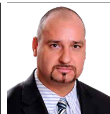
Lázár Tamás (Jobbik)

lők áldozatait, az önkormányzat tűzoltása nem pótolhatja ezt. Közismert gondot jelent a pedagógusok és a technikai munkatársak leterheltsége, magára hagyottsága, alulfizetettsége és motivációvesztése is. A kerületi iskolai körzetekből kivont egyházi iskolák kivételzettsége elősegíti az eltérő képességű és háttérű gyerekek szegregációját, tovább súlyosbítva az állami iskolákban dolgozók és tanulók helyzetét. Az önkormányzat a csekély, tűzoltásszerű segítségen túl megteheti, hogy a tankerületen keresztül folyamatosan nyomást gyakorol a kormányzatra, hogy a közoktatás mostoha helyzete érdemben változzon. Addig is pedig meg kell teremteni vagy erősíteni a helyi oktatásban dolgozók jutalmazásának és terheik csökkentésének önkormányzati eszközeit.