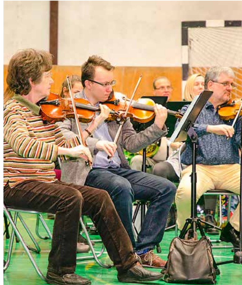
Farsangi délutánt rendeztek a Vass iskolában

mogató” segítette az ismerkedést a zenekar hangszereivel, majd estig tartó táncház következett, amelyen az iskola néptáncosai is bemutatkoztak. Az ünnepsorozat tavaly decemberben két koncert nyitotta: a szimfonikusok, majd a fúvósok adtak hangversenyt az evangélikus templomban. A farsangi program folytatásaként a fúvószenekar lépett fel a Városháza dísztermében. Tavasszal a tagozatok tartanak koncerteket az intézményben, április 23-24-én hangszer- és táncbemutatót rendeznek, április 26-27-én pedig a felvételik lesznek. Június első hetében több hangversenyt is tartanak a Városházán: fellép a szimfonikus zenekar, a fúvószenekar, tanárok, növendékek és egykori növendékek adnak koncerteket. Október 1-jére, a zene világnapjára nagyszabású hangversennyel készülnek. Az ünnepi évet karácsonyi koncert zárja majd az evangélikus templomban.