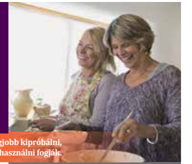
A hallókészüléket ott a legjobb kipróbálni, ahol azt valóban használni fogják.