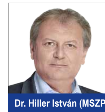
Dr. Hiller István (MSZP)

el ennyire az oktatás-nevelési intézményeket. A kispesti bölcsődék, óvodák és iskolák ugyanis szinte kivétel nélkül felújításra szorulnak, ezt a legutóbbi műszaki vizsgálat is megerősítette. A Jobbik képviselőjeként régóta szorgalmazom az elmaradt fejlesztéseket, így természetesen támogatom a források felhasználását, azt viszont nem értem, hogy miért kell erre másfél milliárd forintot elkölteni, amikor a felújítási költségek az önkormányzat korábbi számításai szerint egymilliárd forintba kerülnek. Főleg úgy, hogy az iskolák már sajnálatos módon kikerültek az önkormányzat fenntartásából.