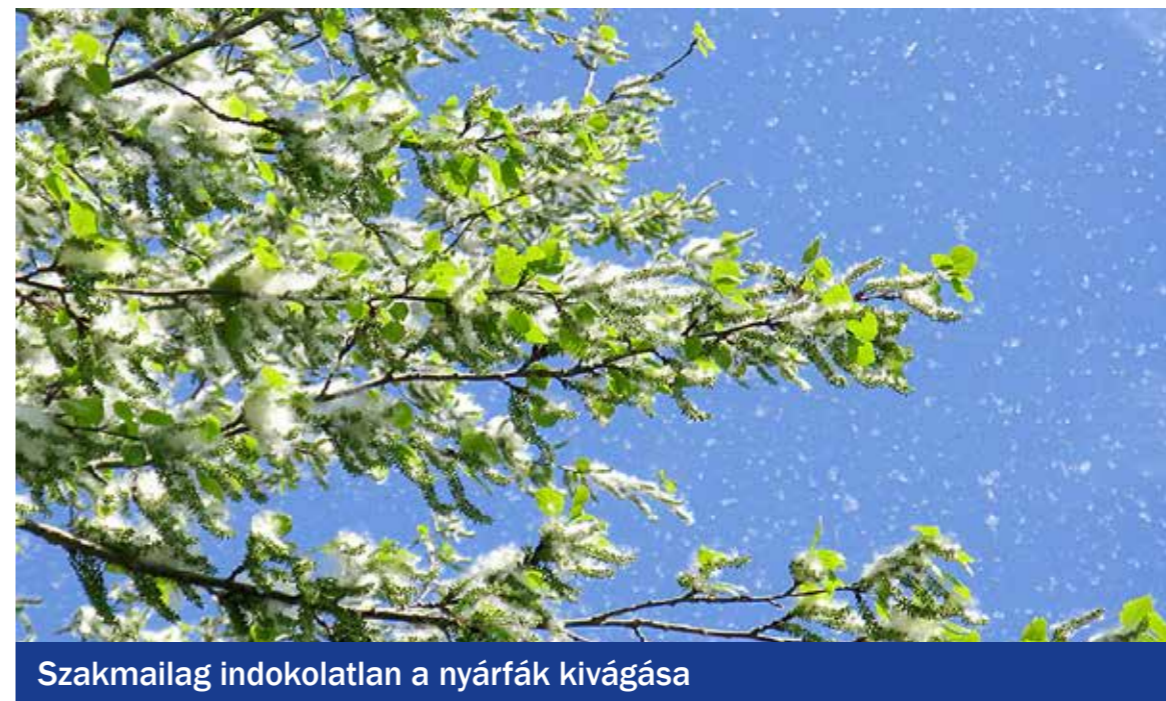
Szakmailag indokolatlan a nyárfák kivágása

Nem változott az önkormányzat Zöldprogram Irodájának évekkal ezelőtt megfogalmazott szakmai véleménye a kanadai nyárfákról annak ellenére, hogy a Fővárosi Közgyűlés kiadta az engedélyt azok teljes kivágására a főváros kezelésében álló zöldterületeken. A nyárfapamacs azon kívül, hogy idegesítő, nem allergén – állítják a szakemberek.