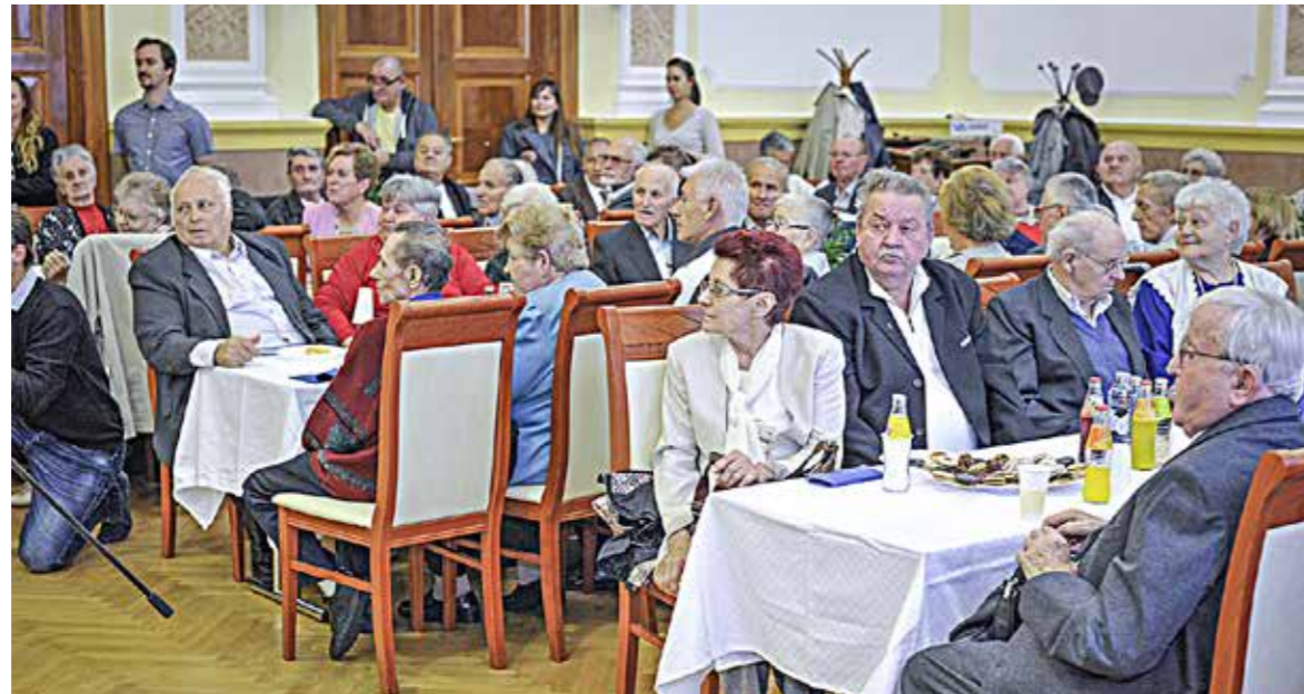
Idén rekordszámú pár jelentkezett az ünnepségre

Negyvenhat olyan kispes-ti házaspárt köszöntöttek a Városházán, akik már 50 éve vagy még annál is régebben kötöttek házasságot.