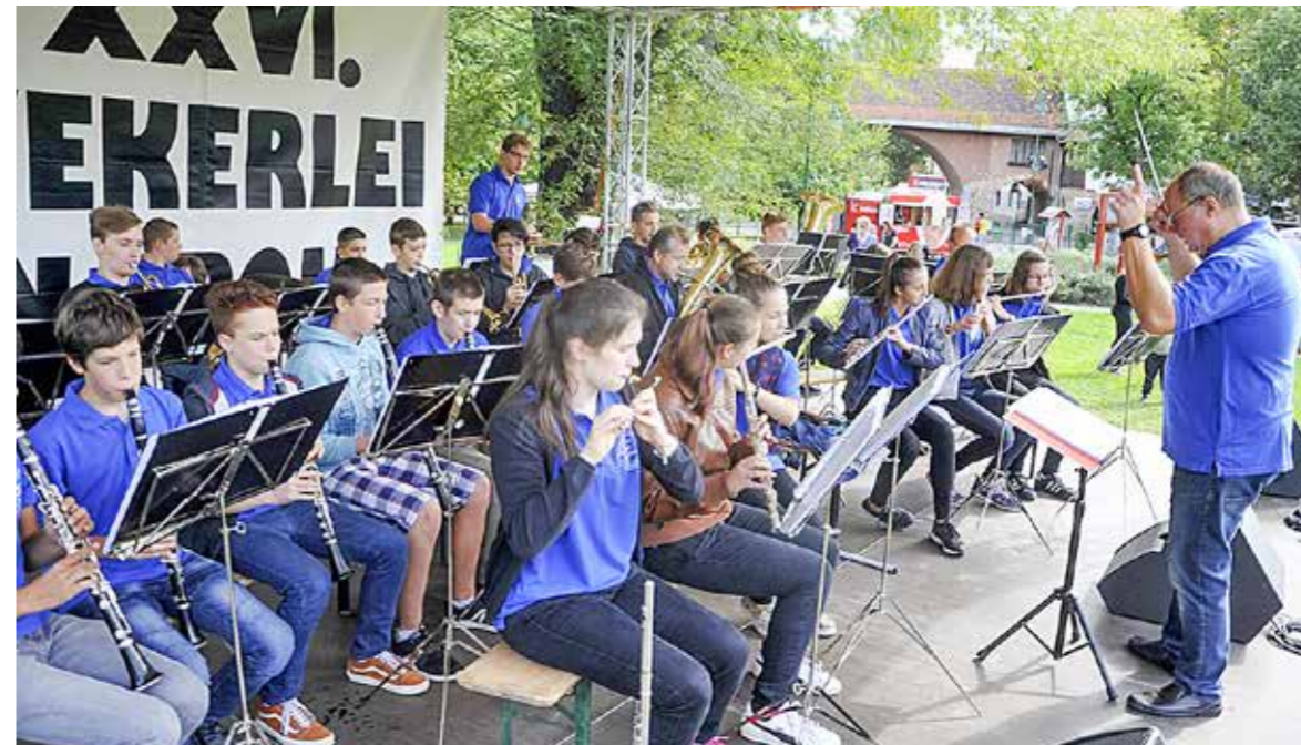
Fúvószenekari koncerttel kezdődött a program

Huszonhatodik alkalommal rendezte meg a telep őszi kulturális fesztiválját az önkormányzat és más partnerek támogatásával, önkéntesek segítségével a Wekerlei Társaskör Egyesület szeptember harmadik hétfőjén.