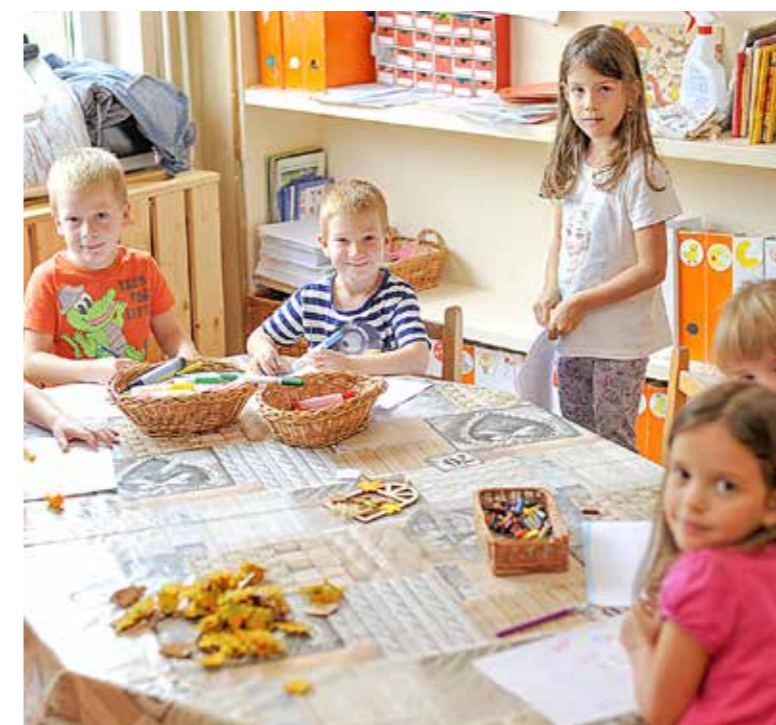
Megújult óvodába térhettek vissza a gyerekek

A nyári szünet után már a Kispesti Mézeskalács Művészeti Modell Óvoda megszépült Kelet utcai tagintézményébe térhettek vissza a kertvárosi óvodások.