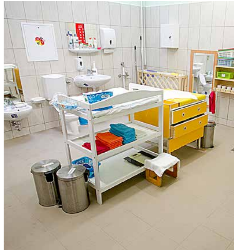
Korszerűsítették a vizesblokkokat is

A nyár végi határidőre elkészült a Bokréta bölcsőde korszerűsítése. Megújult a fűtési rendszer, kicserélték a burkolatokat, és két vizesblokk teljes felújítására is sor került.