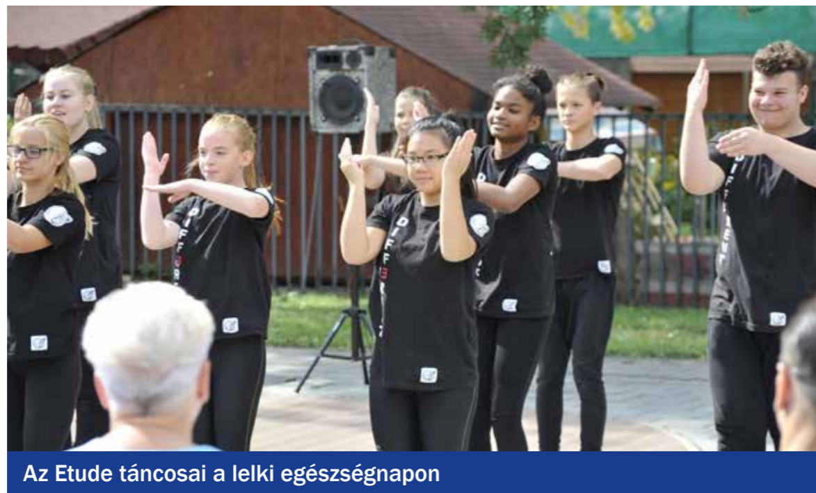
Az Etude táncosai a lelki egészségnapon