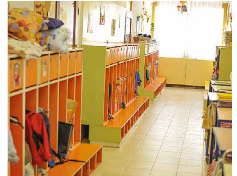
Kicserélték a közlekedők burkolatait is