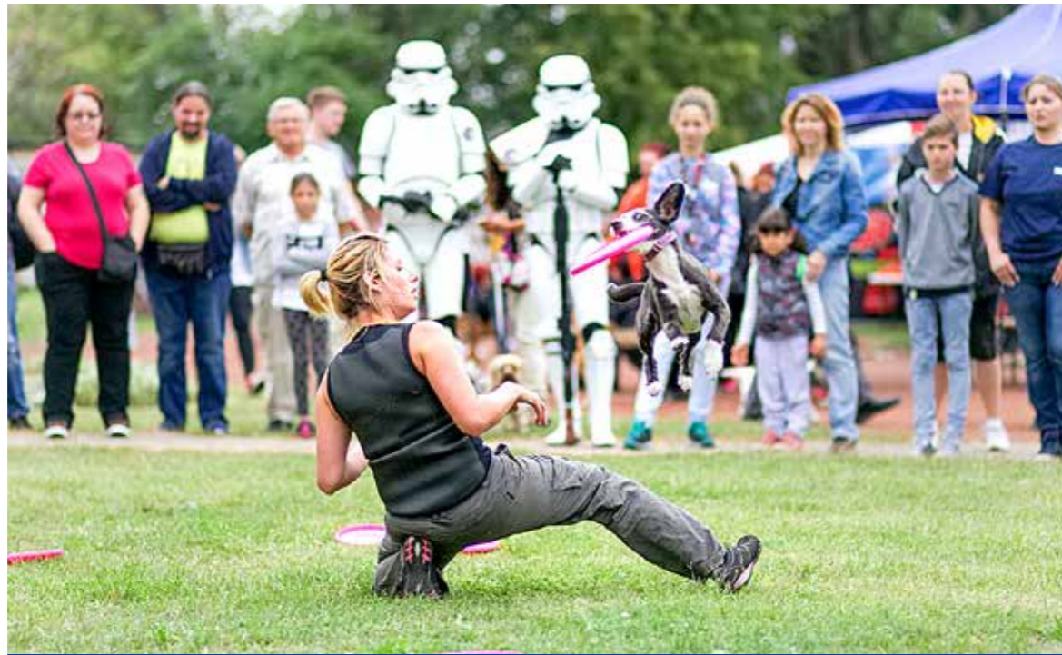
Látványos bemutató nem mindennapi közönség előtt