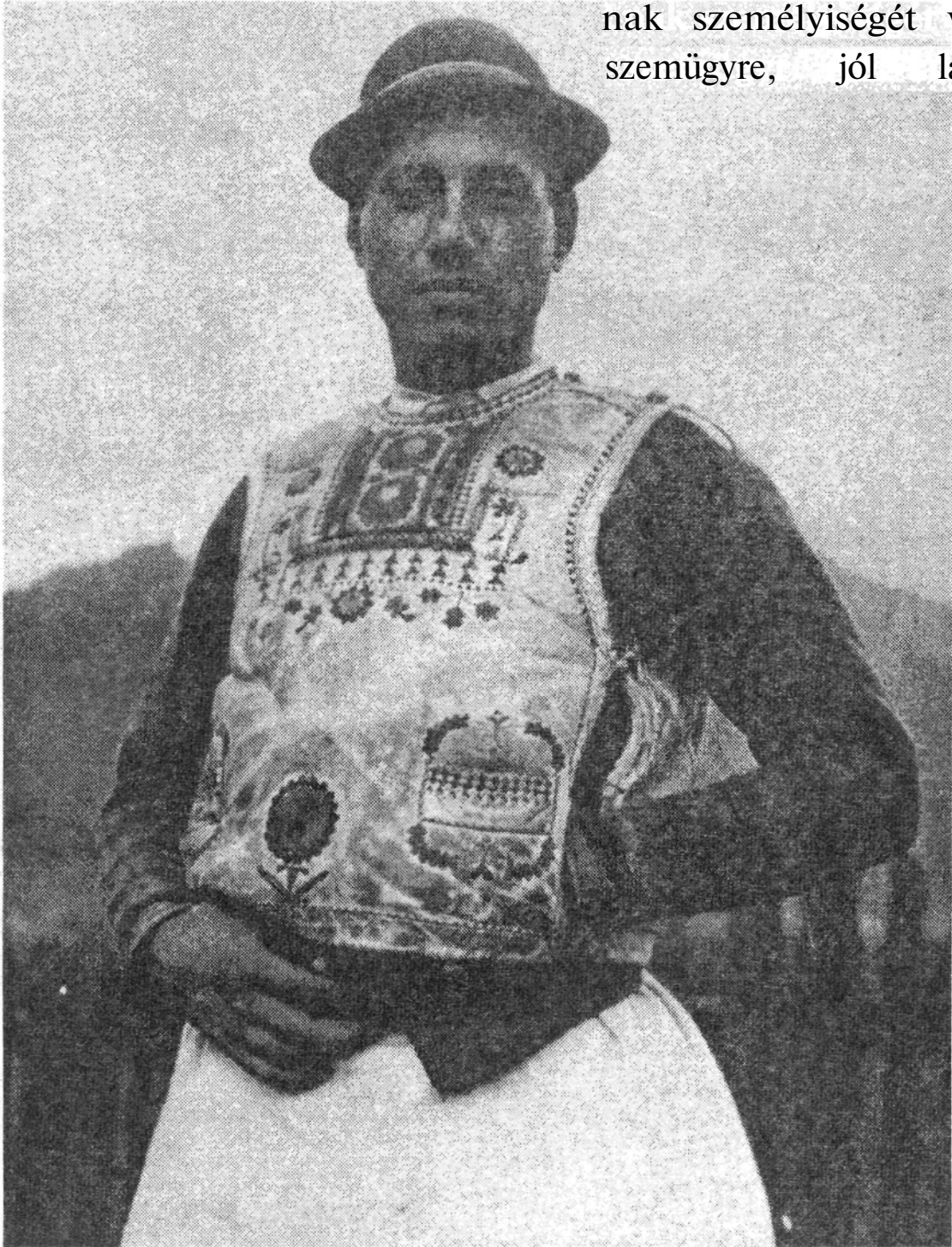
„Csángó cigánylegény” [Gyimesközéplak, Gönyi (Ébner) Sándor felvétele]

„...minden személyiségről elmondhatjuk, hogy megszabott minta szerint reagál a helyzetre, mely körülveszi. Ha az előítélettel sújtott csoportok egyes tagjainak személyiségét vesszük szemügyre, jól láthatjuk,