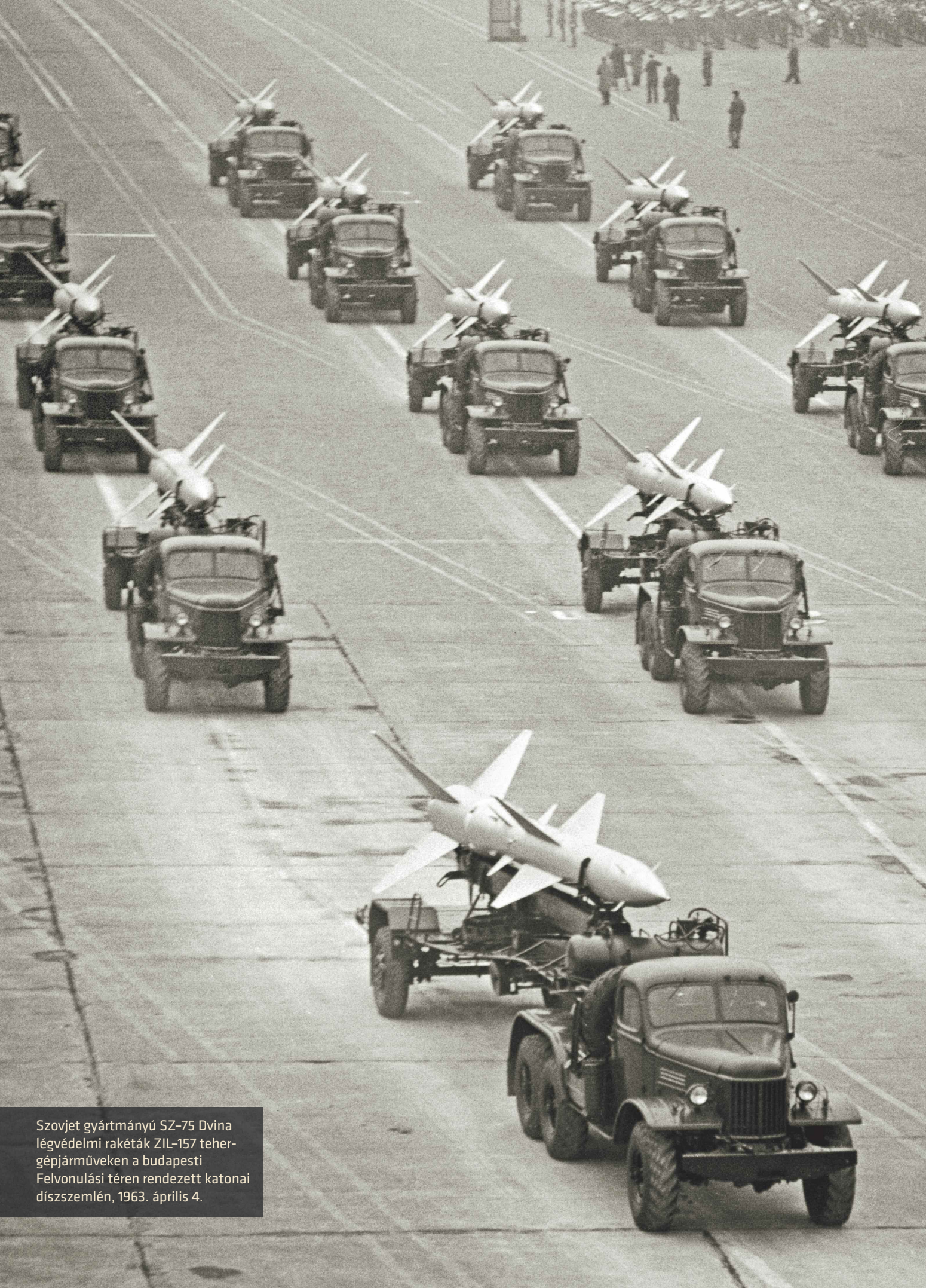
Szovjet gyártmányú SZ-75 Dvina légvédelmi rakéták ZIL-157 tehergépjárműveken a budapesti Felvonulási téren rendezett katonai díszszemlén, 1963. április 4.