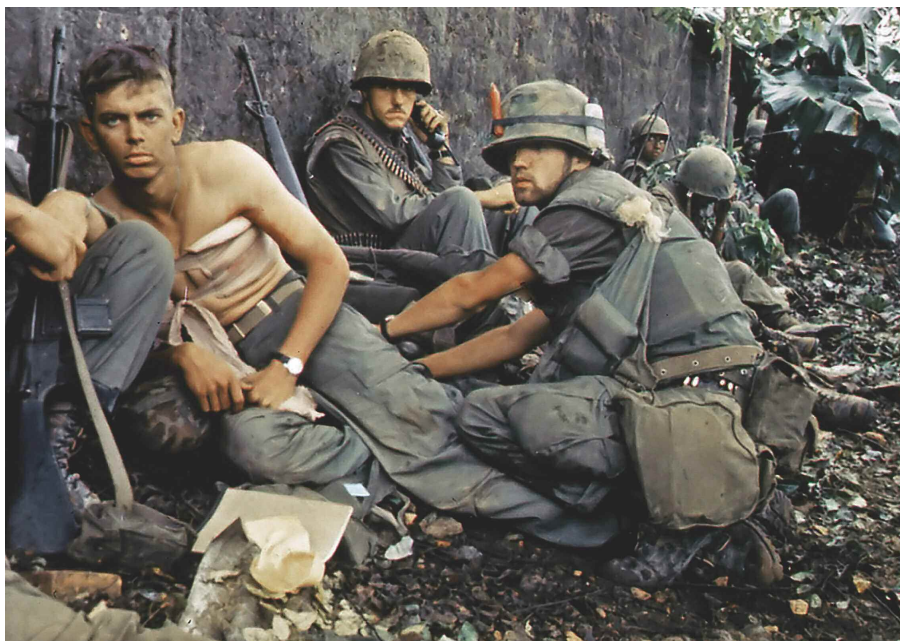
Amerikai katona sérüléseit látják el a Hue városi harcok során, 1968

szont igyekeztek mindenféle diplomáciai megoldást addig késleltetni, amíg a vietnámiak jelentős katonai győzelmeket nem aratnak az amerikaiak felett. Így míg a szovjetek támogatták a tárgyalásos megoldást, a kínaiak velük ellentétes nyomást gyakoroltak az északi vezetésre. Ebben a diplomáciai játékban jelentős szerepe volt Lengyelországnak és Magyarországnak, amelyek a háború későbbi szakaszában rész vettek a rendezésben.