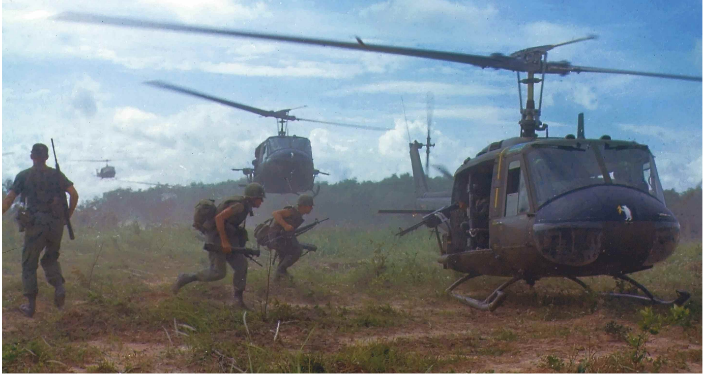
Amerikai katonák harci cselekmények közben, Vietnám, 1968

dzsai területek igénybevétele miatt. Ezért került sor egy újabb genfi tárgyalási körre, amelynek eredményeként 1962-ben megegyezést írtak alá Laosz semlegességéről. Az egyezményt azonban nem tartották be a felek, Laosz fontos logisztikai szereplő maradt egészen a háború 1975-ös lezárulásáig.