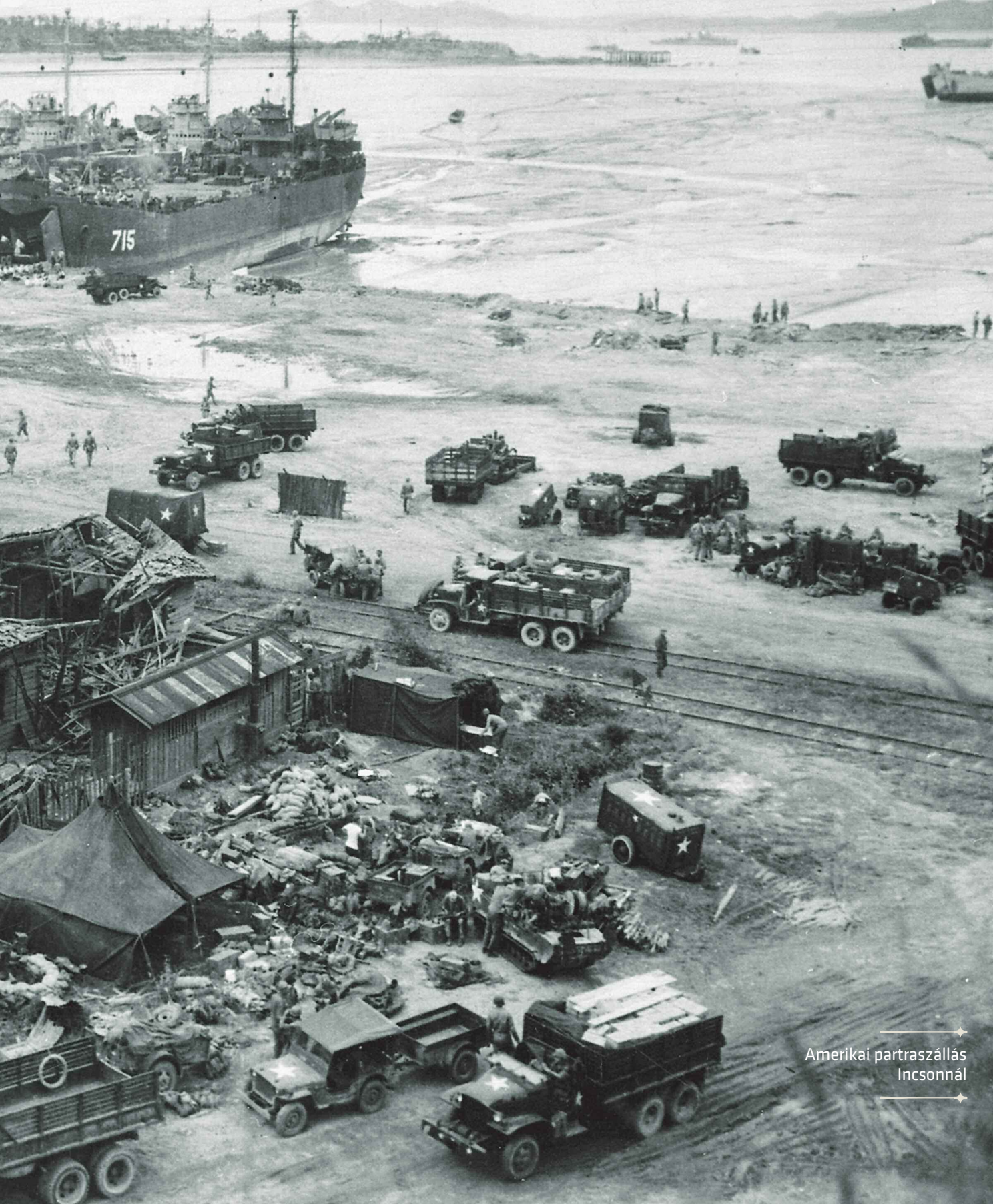
Amerikai partraszállás Incsonnál

mellett – egyúttal a szuperhatalmak hidegháborús játszmáinak fontos próbatétele lett. Eredményeképpen Északkelet-Ázsia stratégiai viszonyaiban a bipoláris korszakon jócskán túlmutató változások következtek be, hatásai így máig érezhetők.