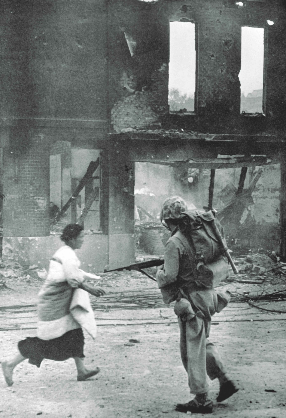
Koreai asszony és egy amerikai katona

ből fakadó fiaskóval. Ezek a vélemények túlzottan alábecsülték a szovjet külpolitikát. Sztálin számára a koreai válság kitűnő alkalmat jelentett arra, hogy letesztelje, meddig mennek el az amerikaiak kelet-ázsiai barátaik védelmében, egyúttal információkat szerezzen a szovjet és az amerikai haditechnika hatékonyságáról. Mindezt pedig úgy, hogy a Szovjetunióknak sem komoly kockázatot, sem számottevő áldozatot nem kell vállalnia. A koreai háború egyik sajátossága az volt tehát, hogy bár koreai nemzeti célok nevében indult és mindkét hidegháborús tömb