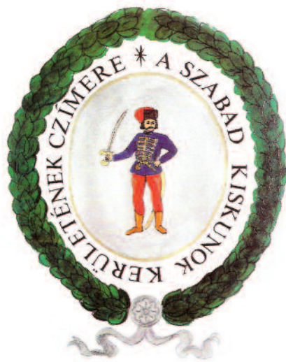
Szabad kiskunok címere

A jászkunok legfőbb döntéshozó testülete, a generális közgyűlés látszólag megfelelt a vármegyék közgyűléseinek. Összetétele és működése azonban eltért a vármegyék nemesiből és a megye területén lévő szabad királyi városok küldötteiből álló nemesi közgyűlésétől. A generális közgyűlésen jelen voltak a Jászkun kerület magisztrátusának tagjai, a particularis kerületek elöljárói, a nádori táblabírák és a települések küldöttei. Utóbbinak állandó tagja volt a főbíró és a jegyző, de mellettük eseti küldöttek is lehettek. Az üléseket a főkapitány, távollétében az alkaptány vezette. A helységek egy-egy szavazattal,