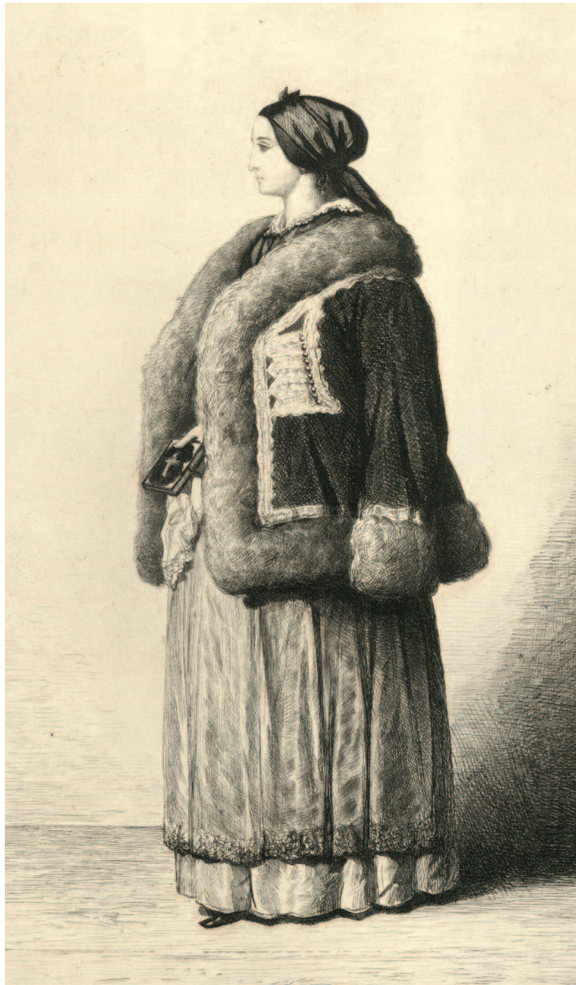
Árokszállási asszony. Theodore Valerio rézkarca, 1853

1786 és 1790 között II. József uralkodói rendelete az igazságszolgáltatást és