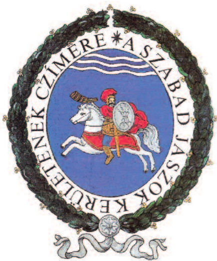
Szabad jászok címere

a közigazgatást elválasztotta. A bűnügyek Pest vármegye bíróságához kerültek, a községek bírósági jogköre is megszűnt. Polgári ügyekben a Jászberényben létrehozott polgári bíróság ítélkezett, ahonnan fellebbvitel az eperjesi kerületi táblához, onnan pedig a királyi táblához történhetett. A generális közgyűlést eltörölték, a kerületek élére állított jászkunági kapitány közvetítette Pest vármegye rendeleteit. Megszűnt a helyi tanácsok bíróválasztáshoz kapcsolódó jelölési joga, a helységek bírját az particularis kerületek kapitányai jelölhették. A rendelkezések – rövid idejű érvényességük miatt – nem okoztak maradandó sebet. 1790 októberében helyreállt a jászkun autonómia korábbi rendje, s a generális közgyűlés visszalította az 1786 előtti választási módot.