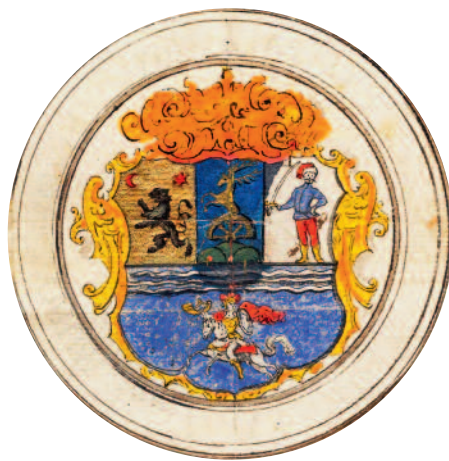
A Jászkun kerület címere

A százsok szervezett, keresztény népessége magyarországi befogadása idején már túljutott a kunok nemzetségi