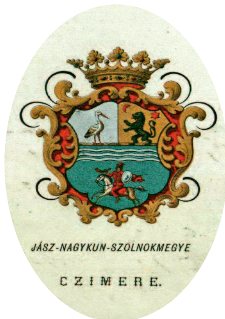
Jász-Nagykun-Szolnok megye címere