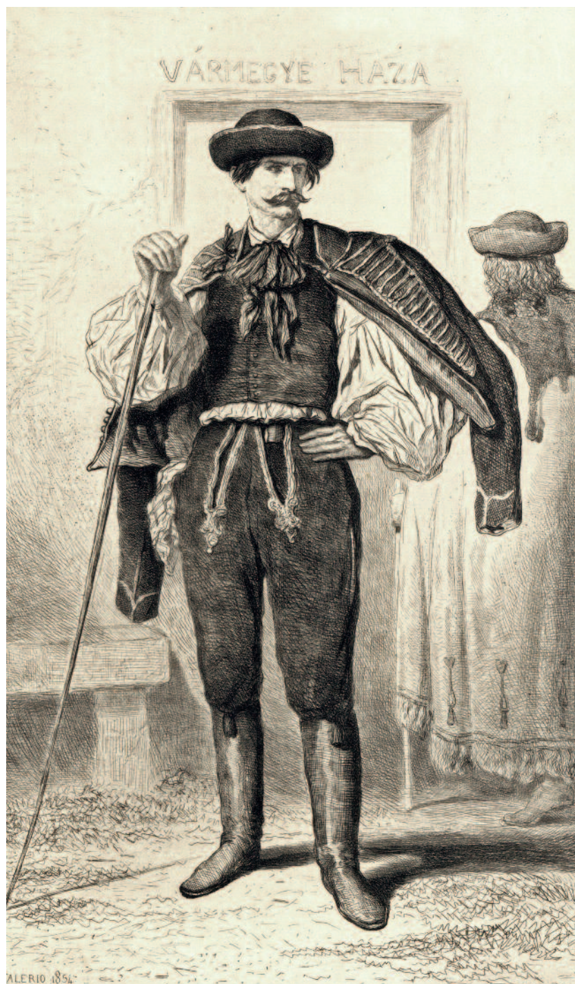
Árokszállási hajdú. Theodore Valerio rézkarca, 1854

sőbb a földesúri hatalommal szemben tanúsított ellenállás és viszonylagos szabadságaik megóvása következtében inkább a szabad királyi városokhoz hasonultak. Koronabirtoki jogállásukat, ősi választói jogukat soha nem adták fel teljesen. A Jászkun kerület népe választott vezetőinek irányításával megőrizte a legfontosabb önkormányzati vonásokat, fizette a hadiadót és a földesúri adót, de a földesúri robotkényszer bevezetését megakadályozta, nem mondott le a beneficiumokról, tizedet nem adott, és megőrizte szabad költözködési jogát is.