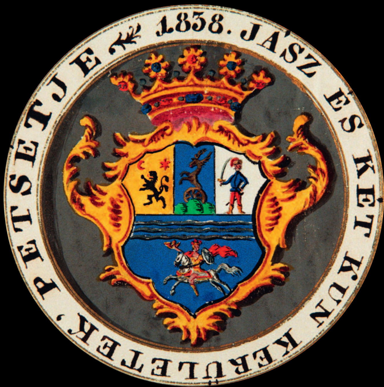
A Jászkun kerület pecsétje