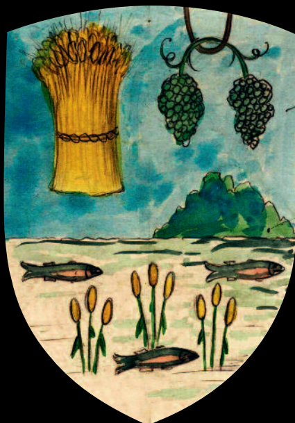
Bihar vármegye címere

csatlakozását. 1732-ben III. Károly döntött úgy, hogy a Partium területét megosztja, így már csak Kraszna és Közép-Szolnok vármegyék tartoztak a Habsburg-fennhatóság alatti Erdély területéhez. A Partium mint terület s maga az elnevezés is a kiegyezés után, az 1868. évi törvények alapján szűnt meg végérvényesen.