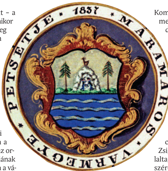
Maramaros vármegye pecsétje, 1837 Bihar vármegye pecsétje, 1838

Fráter György két ízben kísérelte meg korrigálni hibáját. Előbb 1541-ben a gyalui egyezmény révén igyekezett Habsburg-fennhatóság alá vonni a rábízott keleti országrészt, majd 1549-ben a nyírbátori egyezmény szerint akarta ismét megkísérelni az ország területi egyesítésének elősegítését. A Habsburg katonai beavatkozás erőtlensége mindkét próbálkozását értelmetlenné tette,