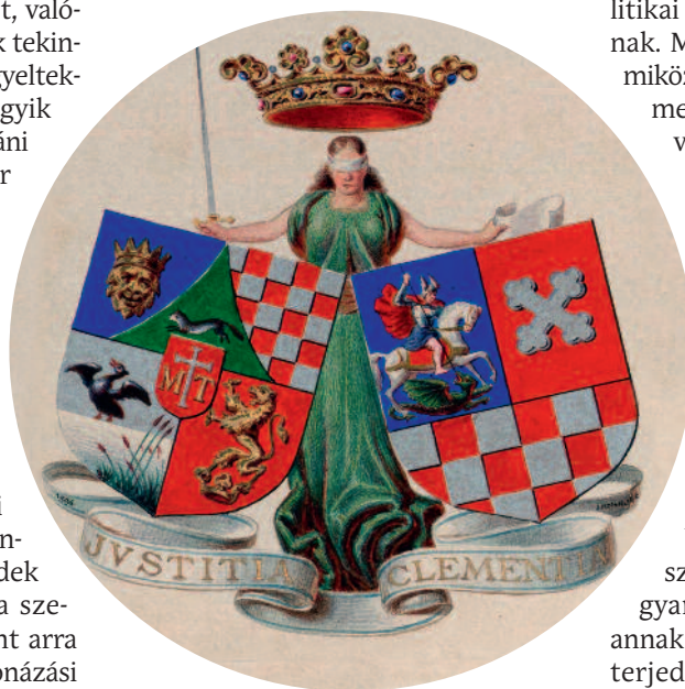
Belovár-Kőrös vármegye címere

méltóságra, ám Erdődyhez hasonlóan ő sem járt sikerrel. Nem úgy elődje, Draskovich János, aki 1646-ban a báni posztot hagyta ott a nádori tisztségért. Ezek az esetek jól példázzák, hogy a báni tisztség valóságos gyengesége ellenére is komoly méltóságot jelentett a hivatalok között, a nagyobb udvari ceremóniák, koronázások, temetések alkalmával pedig a bánok ugyancsak elmaradhatatlan szereplőknek számítottak.