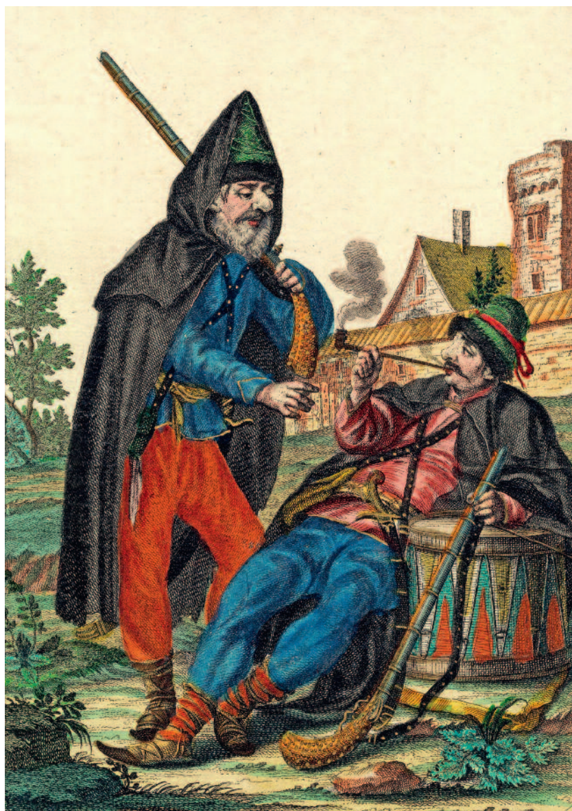
Délvidéki határőr katonák, 17. század vége

Mindez egy természetes erőkoncentráció volt a Habsburg-politika részéről, hiszen csak akkor lehetett esély megvédeni a tartományt és biztosítani a köz- és jogbiztonságot, ha a bánnak kellett erőforrások álltak rendelkezésére. A szigetvári Zrínyi Miklós nem véletlenül követelte Ferdinándtól, hogy a környéken a leggazdagabbnak számító zágrábi püspökség jövedelmeit csatolják a bánok szolgálati birtokához, s ezek felett is a mindenkor bán diszponáljon. Ez az elképzelés ebben a formában nem valósult meg, ám jelzésértékű, hogy Drasko-