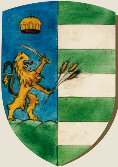
Békés vármegye címere