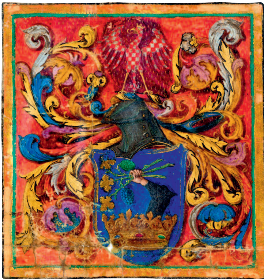
Somogy megye címere, 1498

Új megyei feladatok jelentek meg. Abban az évben, amikor Somogy címeradományban részesült, átalakították az ország katonai rendszerét. A megyék immár rendszeresen állítottak ki bandériumokat az ország védelmére. A megyei hadak élére kapitányokat választottak.