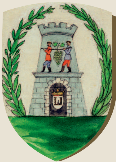
Baranya vármegye címere