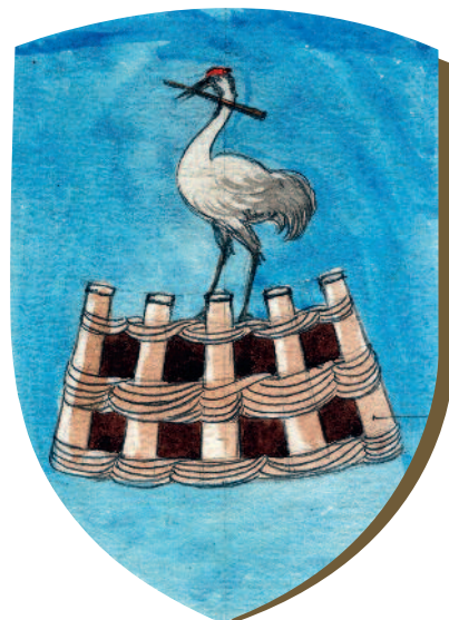
Vas vármegye címere

nemesek széke és a szepesi szászok közössége. A történelmi atlaszok állandó hibája, hogy ilyen területként ábrázolják a Jászságot is. Jász falvak valóban voltak az egykori Heves és Szolnok megyében, a Jászság azonban csak az újkorban jött létre.