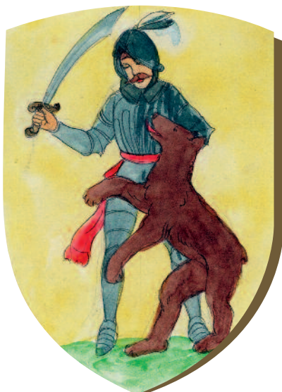
Komárom vármegye címere

fennhatósága alól, csupán a megye bíráskodási joga csorbult némileg, hiszen a nemesek büntetőügyeiben az lett volna az illetékes. A pallosjogú úriszékek tárgyalásain pedig éppúgy ott ültek a szolgabírák, mint másokon.