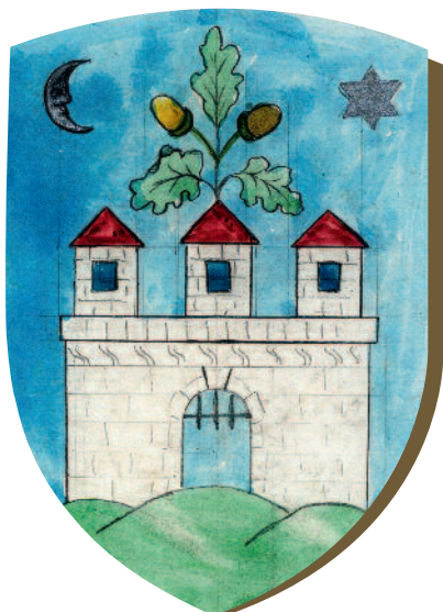
Veszprém vármegye címere

A megyét az ispán és a szolgabírák együttesen képviselték. Külön-külön egyikük sem léphetett fel a megye nevében, nem szolgálthatott igazságot sem. Az ispánt helyettesítő alispán részvétele a munkában azonban annyira mindennapos volt, hogy a megyékhez szóló parancsleveleket mindig az ispánhoz vagy az alispánhoz címezték. Rajtuk és a jegyzőn kívül azonban mindig voltak más segítők is. Nem tudjuk, hogy eseti vagy állandó megbízást kaptak-e azok a megyei emberek, akik a királyi bíróságok vagy a