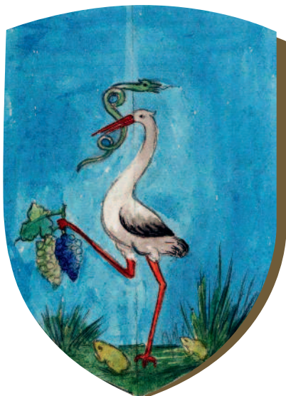
Heves vármegye címere

Az Anjou-kor elején még sok olyan királyi uradalom volt, amely nem tartozott egyetlen megyéhez sem, és élükön ispánok álltak. Két út állt előttük: vagy önálló megyévé váltak, vagy beolvadtak egy már meglévő megyébe. Ez utóbbi