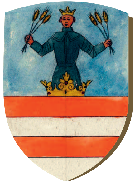
Ung vármegye címere

gainak az 1222. évi Aranybullában történt becikkelyezése – egyebek mellett – olyan kiváltságokat is biztosított ennek a társadalmi csoportnak, amelyek a királyi vármegye hagyományos rendjének felbomlását sietteték: a királyi szerviensek kikerültek a megyésispánok bírói és katonai joghatósága alól, azaz voltaképpen elváltak a megyétől.