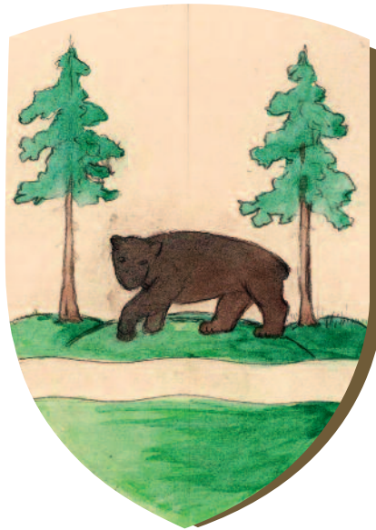
Árva vármegye címere