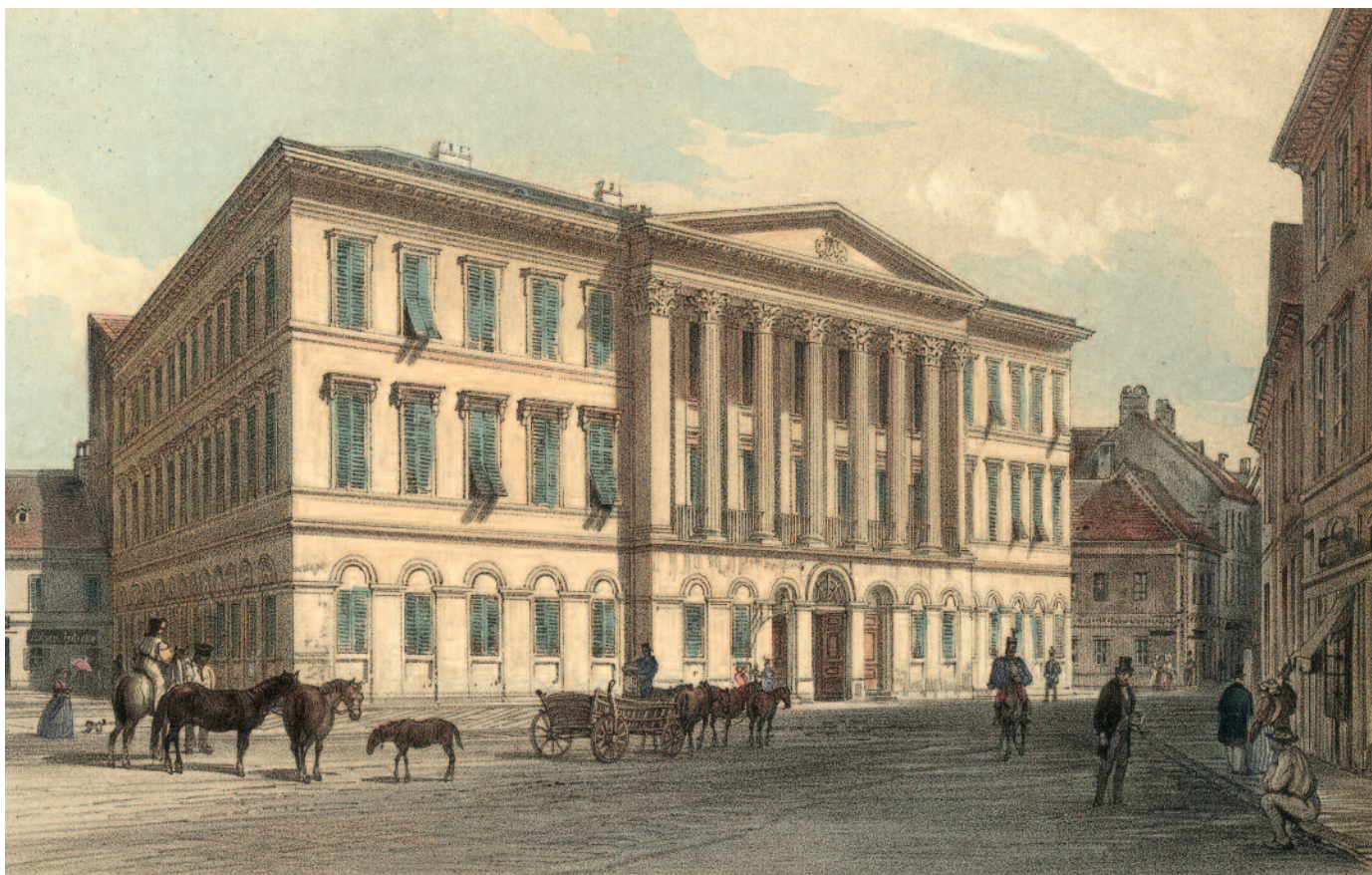
A Vármegyeház Pesten, 1840-es évek. Rudolf Alt (1812–1905) után Franz Xaver Sandmann (1805–1856) színezett litográfiája

Hunyadi Mátyás megerősíti azt az elvet is, hogy a király a hatalmát az országgyűléssel és a megyékkel együtt kell hogy gyakorolja. A rendi államban a király kénytelen a hatalmát megsz-