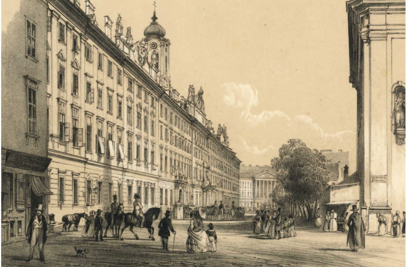
Az Invalidusok Háza és megyeház Pesten, 1845. Rudolf Alt (1812–1905) után Franz Xaver Sandmann (1805–1856) színezett litográfiája

tani a rendekkel. A királyt a rendi országgyűlésen választják meg, s megválasztása fejében esküt tesz a rendi alkotmányra, és hitlevelet bocsát ki, amelyben ígéretet tesz az őt megválasztó rendeknek, hogy a nemzet jogait tiszteletben tartva gyakorolja hatalmát.