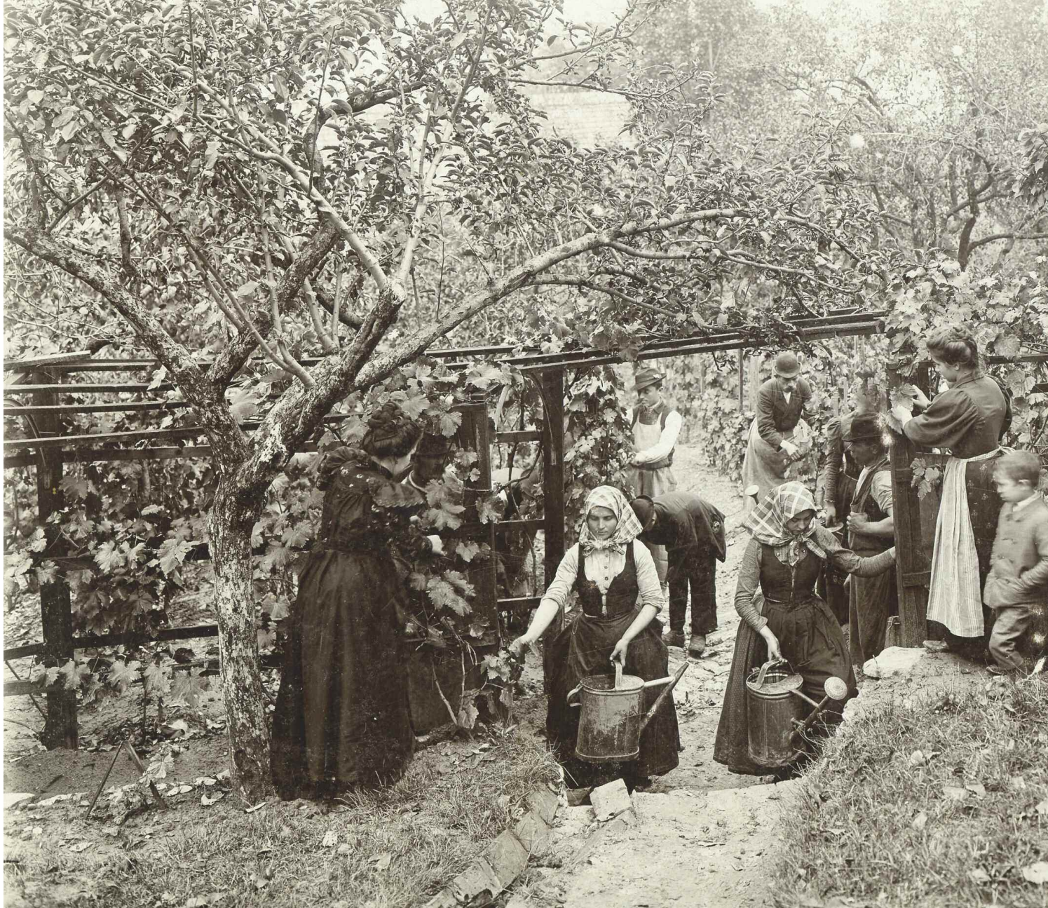
◆ Szüret a Svábhegyen, 1892. Az előtérben Jókai Mór az unokájával

zán eredeti ötletet eszelt ki arra, hogy miként őrizze meg a fagy elől szőlőtermését. Tudvalevőleg a szőlő május elején kivirágzik, ám ugyanekkor jön fagyosságok korszaka, összeesik a szőlővirágzás idejével. Ilyen lehűléskor füstölni szoktak a szőlőkertekben, Jókai azonban azt nem tartotta helyesnek, mert szerinte a füst is feljebb száll, a fagy meg a dér pedig teljesen a talajmentén támadja meg a szőlőt. Ezért furfangos tervet eszelt ki.