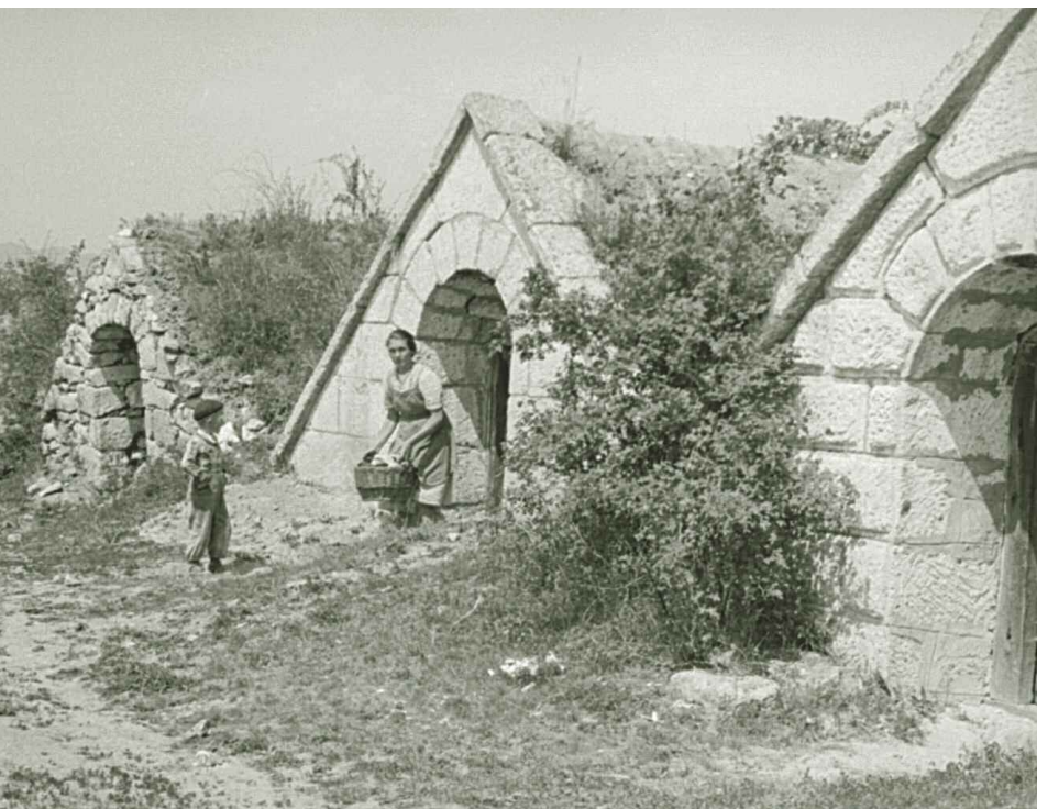
A hercegiúti pincesor, 1957

A bevétel fokozása érdekében a kincstár kísérletezett a (vélekedése szerint rosszban sántikáló s a borharmincadolást megkerülő) magyar ter-