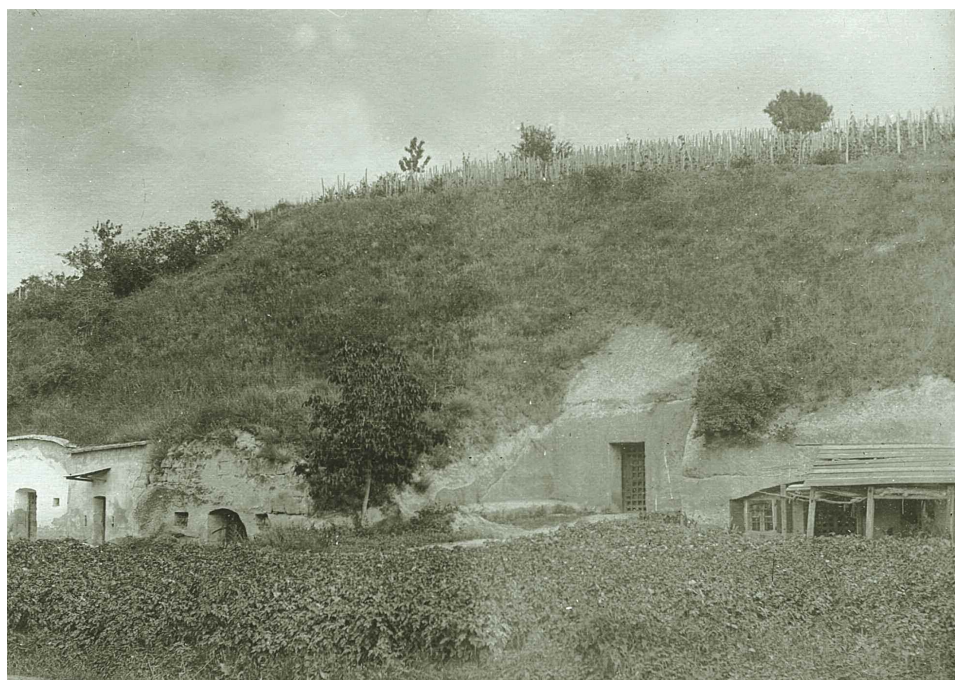
Pincék a szőlőhegy oldalában, Eger, 1915

A fennmaradt források tanúsága szerint egyébként is a dézsma- és kilencedszedők visszaéléseitől volt han-