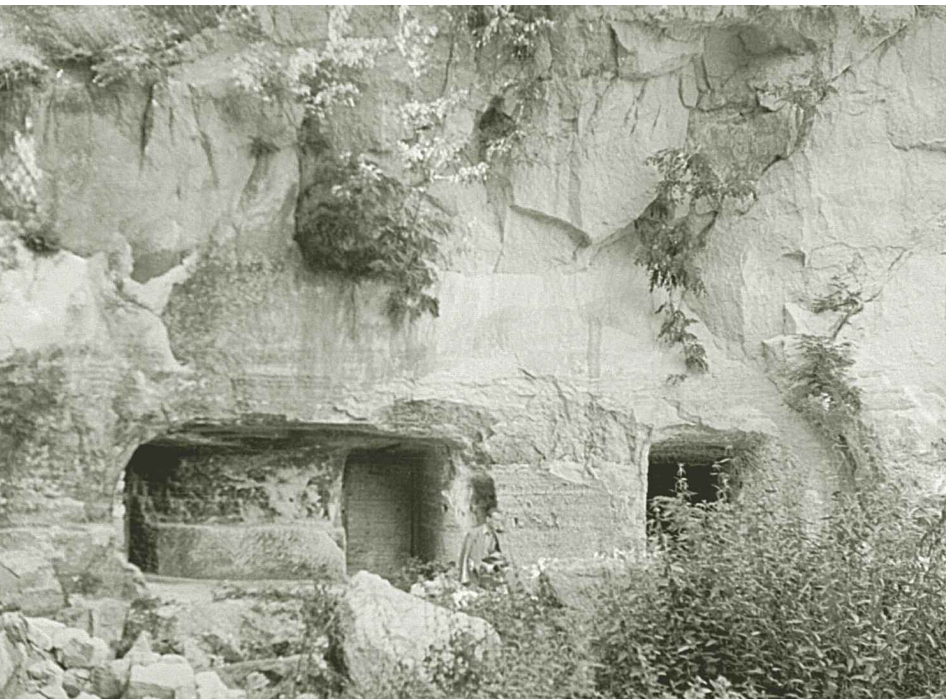
Lyukpincék Bükkzsércen, 1958

során az alattvalóktól kíséretük számára az elszállásolás mellett ételre, italra. A meglehetősen nagy terhet jelentő beszállásolással szemben már a 12. században megindult a küzdelem, s az Aranybulla átmeneti szabályozását követően a nemesség teljesen megszabadult ettől a teheről. A 15. századra jóformán valamennyi nagybirtok elérte a descensus alóli mentességet. Végül már csak a szabad királyi városok számára maradt fenn korlátozott formában az étellel-itallal ellátás kötelezettsége.