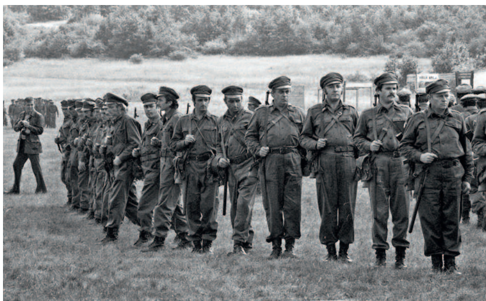
A Munkásőrség tömegosztatási gyakorlata az 1970-es években