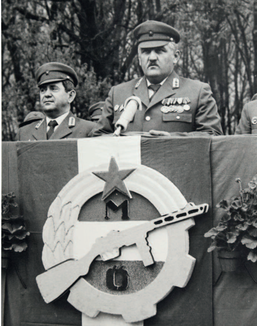
A Központi Ellátó Parancsnokság csapatzászló-átadási ünnepsége, Fót, 1984

átvállalnia háttországvédelmi feladatokat, hogy – a szovjet elvárásoknak megfelelően – növelni lehessen a Magyar Néphadsereg támadóerejét. Az új feladatokhoz új eszközöket is kaptak, többek között két magyar fejlesztésű Kalasnyikov-típust, az AMP-69-et és az AMD-65-öt. A kiképzés színvonalának emelésére Budapesten felépítették a Munkásőr Aleggység-parancsnoki Iskolát.