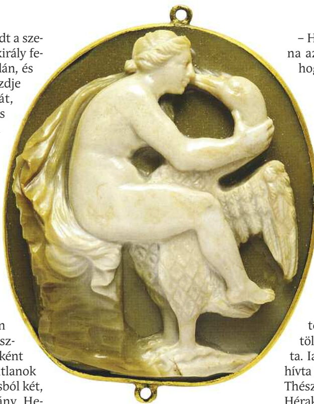
Tündareósz spártai király feleségét, Lédát Zeusz hattyú képében tette magáévá. Négy gyermeke közül kettő isteni, kettő pedig emberi származású volt. Faragott féldrágakő, vagyis káma.

Z eusznak egyszer megakadt a szeme Tündareósz spártai király feleségén, a szépséges Lédán, és el akarta csábítani. Hogy leküzdje az asszony bizalmatlanságát, hattyú képét öltötte magára, s így közelítette meg őt. Magával ragadta és a Taügetosz csúcsa alatt egyesült vele. Lédát kínozta a lelkiismerete, és félt, hogy áldott állapotba került, holott nem is volt együtt férjével, ezért még aznap este Tündareószsal is együtt hált, s végül négyes ikreket fogant. Kilenc hónap elteltével két tojást hozott a világra. Az egyikből két fiú, Kasztór és Polüdeukész bújt elő (nevük latin formája, Castor és Pollux talán jobban ismert), őket még dioszkuroszokként, vagyis Zeusz fiaiként is ismerik, mivel elválaszthatatlanok voltak egymástól. A másik tojásból két, később nagyon híressé vált lány, Helené és Klütaimnésztra jött a világra.