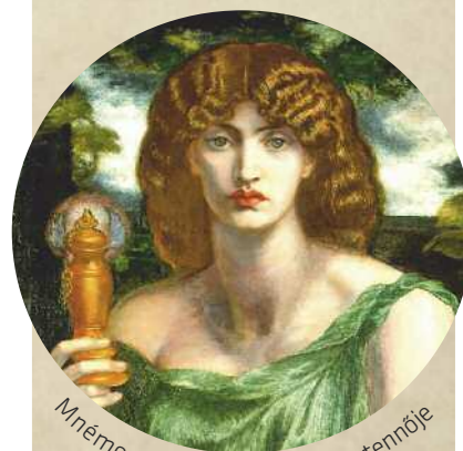
Mnémoszüné, az emlékezés istennője

ÓKEANOSZ KOIOSZ KRIOSZ HÜPERIÓN IAPETOSZ KRONOSZ