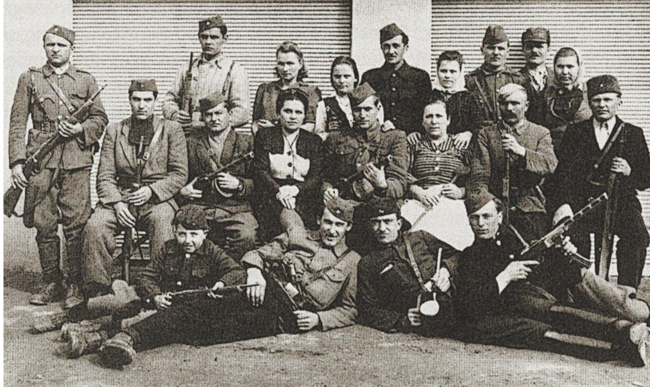
Temerini partizánok, 1944

a következő sorokat: „A kisebbségi kisebbségérzetét csak egy erős nyelvbe és népi kultúrába ültetett nemzetiségi öntudat tudja ellensúlyozni.” Vajon sikerült-e neki ehhez hozzájárulni? Nyelvművelő munkássága révén a maga eszközeivel igyekezett a fenti sorok szellemében dolgozni. Utolsó, posztumusz könyvének címe: Kettős idegenségben . A cím eredetileg arra utal, hogy az idegen (angol, francia stb.) szavak szerb közvetítéssel kerülnek át a vajdasági magyar nyelvbe. A kötet sajtó alá rendezője a cím kapcsán elmondta: „Hazai magyar nyelvünkben ma már jelentéstani megosztás következik be: az egyetemes magyar köznyelvtől való eltávolodás, ami a kultúránk egészére nézve súlyos következményekkel jár.” Így a könyv címe, a Kettős idegenségben bizony mást is jelent: kisebbségiként idegennek lenni és elidegenedni az anyaországtól is.