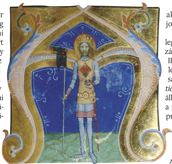
Szent László király iniciálé (Országos Széchényi Könyvtár, Képes krónika , 47r)