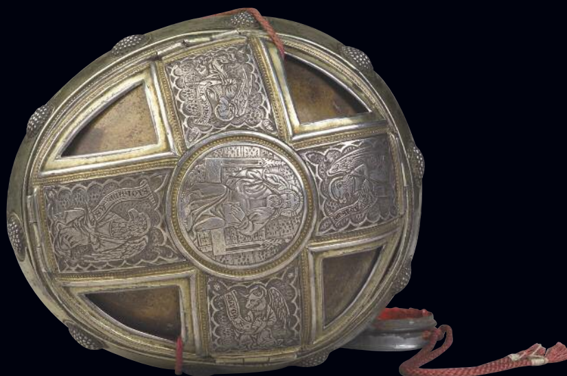
A Szent László-herma (bal oldalon) és belső ereklyetartója a király koponyájával (fent)

„Bűnös vagyok, mert a földi hatalmat a legsúlyosabb vétkek nélkül nem lehet gyakorolni.” A citátum Szent László király (1077–1095) leveléből való. Az idézett részlet a kor felfogásával összhangban fogalmazta meg a halandó ember, a bűn és a hatalom kapcsolatát. Itt azonban ennél többről van szó: egy keresztény uralkodó önkritikus vallomásáról. László bűnösnek érezte magát, ám kortársai becsülték, a legnagyobbak közé számították, és hamarosan kialakult tisztelete szentté avatásához vezetett. Ez a tanulmány három kérdésre kíván választ adni. Hová temették László királyt? Hogyan bontakozott ki kultusza? Miként avatták szentté?