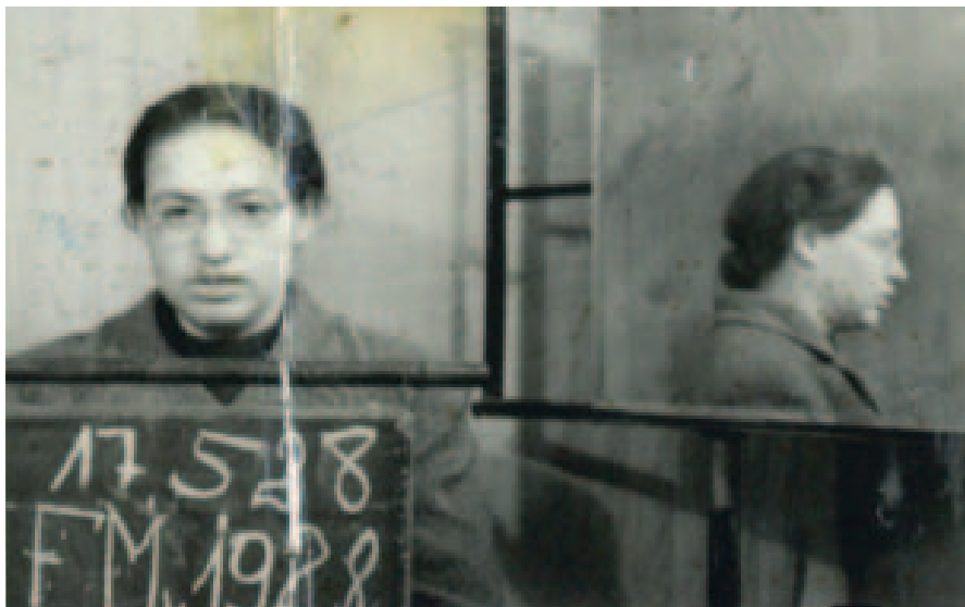
Forró Marianna rabosítási fotója

1957 szeptemberének elején „Szilvási” megbízói utasításának megfelelően azzal az ajánlattal jelent meg, hogy hajlandó Tumbászt Nyugatra szöktetni, azonban csak a fiút vinné, menyasszonyáról szó sem lehet. Ebben a formában a fiú nem volt hajlan-