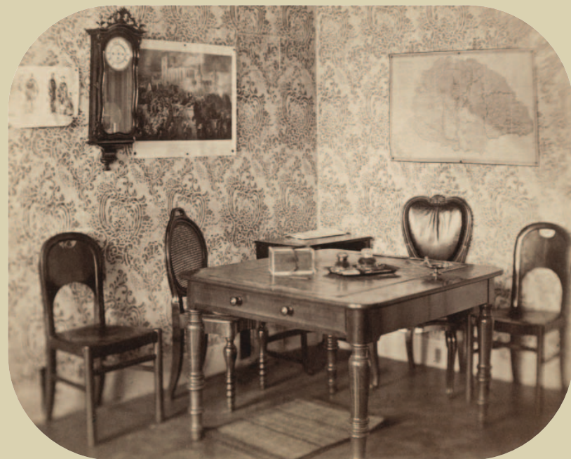
Az íróasztal, melyen a Blick született, s rajta sakk-készlete (lent)