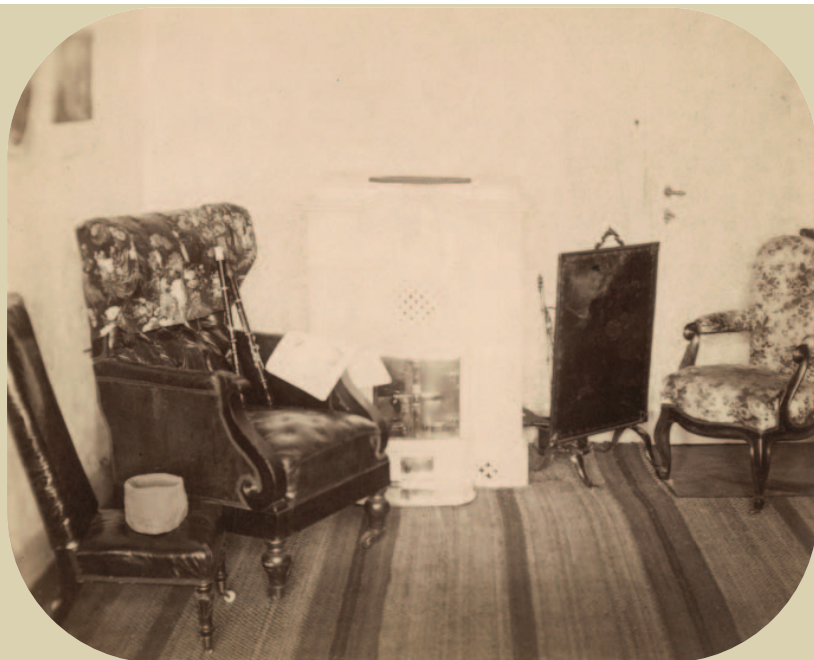
Székek és fuvolák döblingi otthonából (fent) Széchenyi döblingi lakosztályának részlete (lent)

Az alkotás folyamatában azonban a kézirat politikai tartalmakkal telítő-