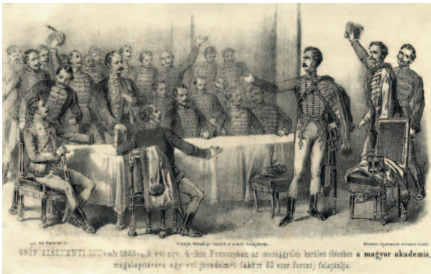
GRÖF SZÉCHENYI ISTVÁN 1825-évi évi bev. 4-ikén Pozsonyban az országgyűlés kerületi ülésében a magyar akadémia megalapítására egy évi jövedelmét (akkor 60 ezer forint) felajánlja.

A híres jelenetet a neves osztrák művész a szemtanúk fennmaradt beszámolói alapján örökítette meg, és ma így él az utókor emlékezetében. Hasonlóképp ábrázolja Holló Barnabás is e történelmi pillanatot az Akadémia palotájának falán 1893-ban elhelyezett domborművén.