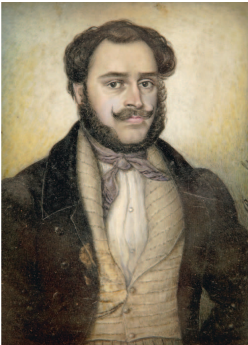
Wesselényi Miklós. Elefántcsont, Johann Ruprecht vízfestménye, 1839.

Amikor állapota az 1850-es évek közepére „feltisztult”, mi több, az évtized végére magas színvonalú értelmiségi tevékenységre lett képes, ám az erről író biográfusok véleménye újra megoszlik. Beteg volt-e, vagy beteg maradt-e Széchenyi ebben a korszakában is, gyógyítási színhely vagy csupán politikai búvóhely volt-e számára Döbling? A dilemma többek között azért maradhatott eldöntetlen, mert ekkoriban még hiányzott a sok évtizedes megfi-