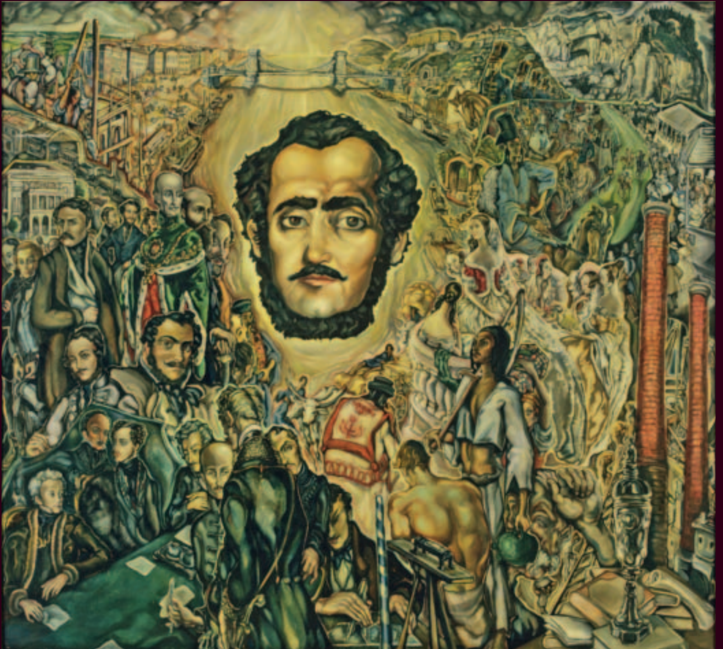
Széchenyi István apoteózis. Batthyány Gyula olajfestménye, 1941

A késő szecesszió, a szürrealizmus és az art deco határait saját, különleges stílusban ötvöző festőművész, Batthyány Gyula gróf – Batthyány Lajos dédunokája, Andrássy Gyula unokája – nagy tisztelője volt Széchenyinek. Amellett, hogy nagyszerű grafikai sorozatot szentelt életének és munkásságának, megdicsőülését ezen a különlegesen gazdag festményen fogalmazta meg. A Duna vonalára mintegy égi fény árad a Lánchíd – a legemblemikusabb Széchenyi-alkotás – felől, s a folyó zöldes-aranyos vizében fürdik a „legnagyobb magyar” kissé idealizált, életkorát tekintve az Akadémia alapítása körüli időszakhoz közeli portréja. A pesti oldalon korának és életútjának neves szereplői alkotnak burjánzó, hul-