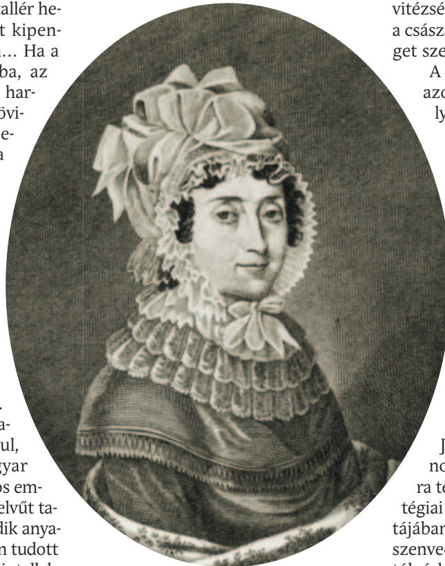
Festetics Julianna grófnő arcképe.

amelyekben persze lehet némi túlzás – valamennyi „eminens” minősítés mint „óriási hazugság ragyogott tanodai bizonyítványaim lapjain”.