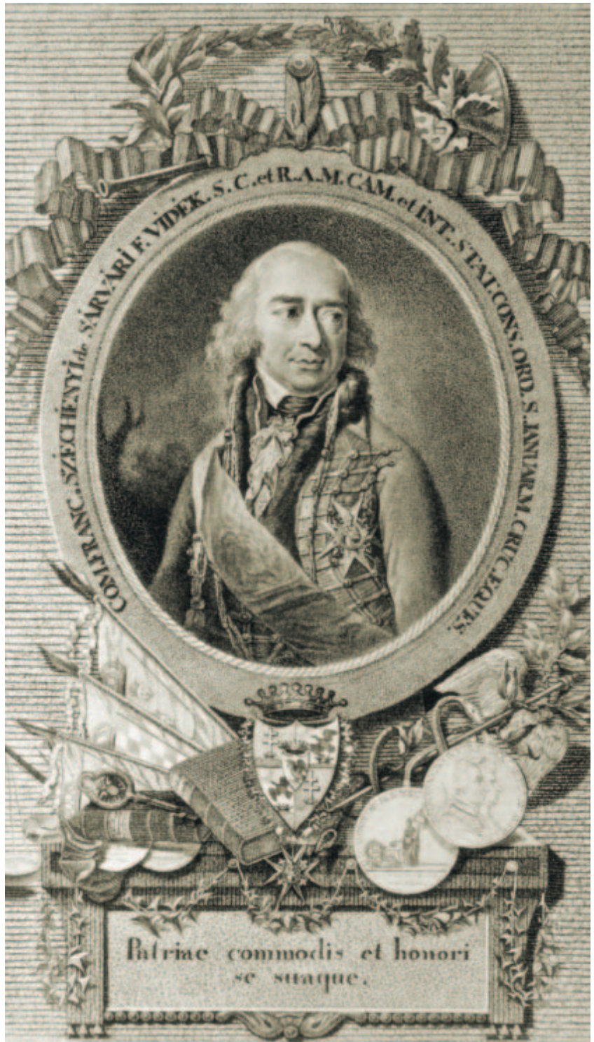
Széchenyi Ferenc gróf arcképe. Czetter Sámuel rézmetszete, 1798.

Ferenc és a „keszthelyi mágnes” – édesanyja nevezte így egy levelében a családjához visszaköltöző, özvegy Julianát – hamar tisztába jöttek egymással, ám jó másfél esztendőbe telt, mire a Festetics szülők ellenkezését sikerült legyőzniük. Ezután indult a csata a pápai engedély kieszközléséért, mert a