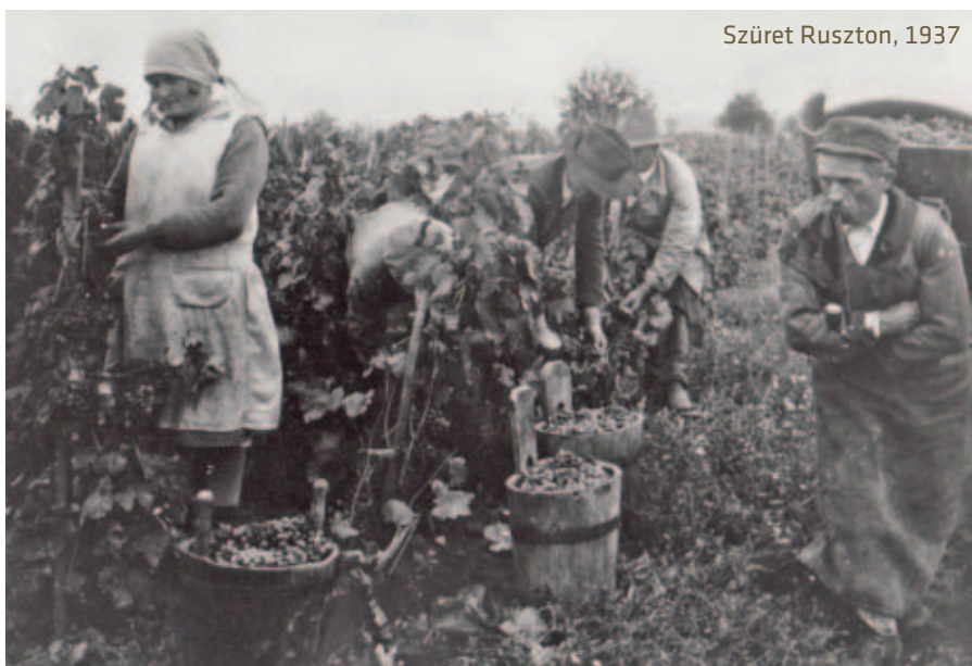
Szüret Ruszton, 1937