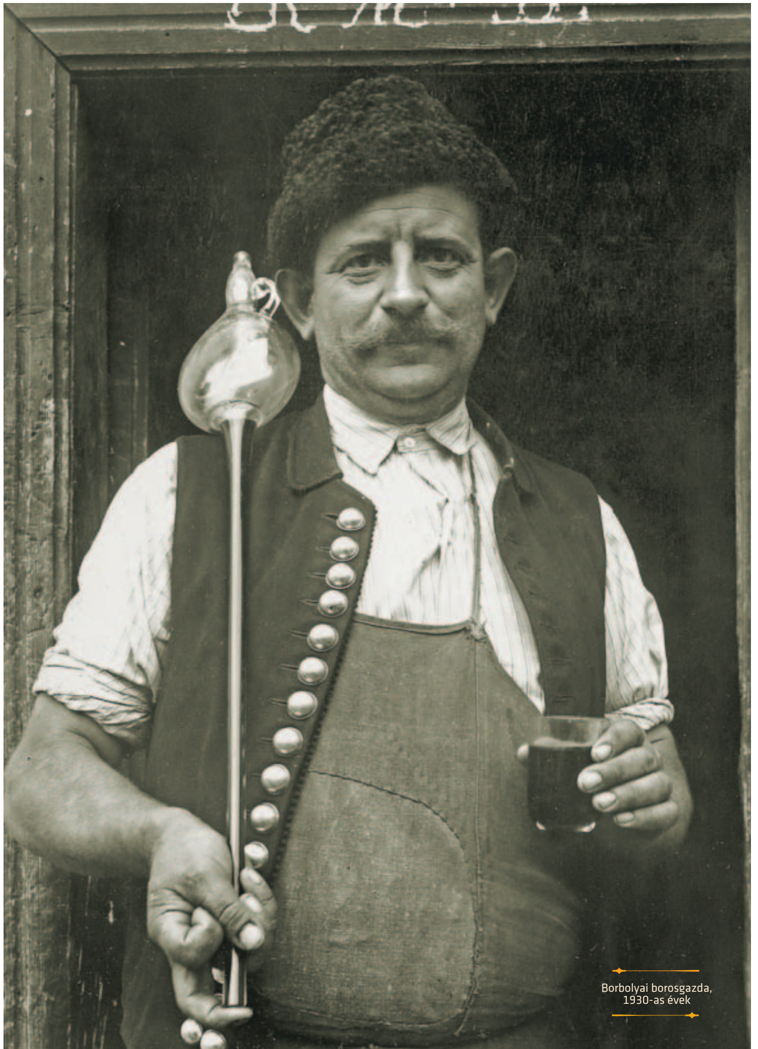
Borbolyai borosgazda, 1930-as évek