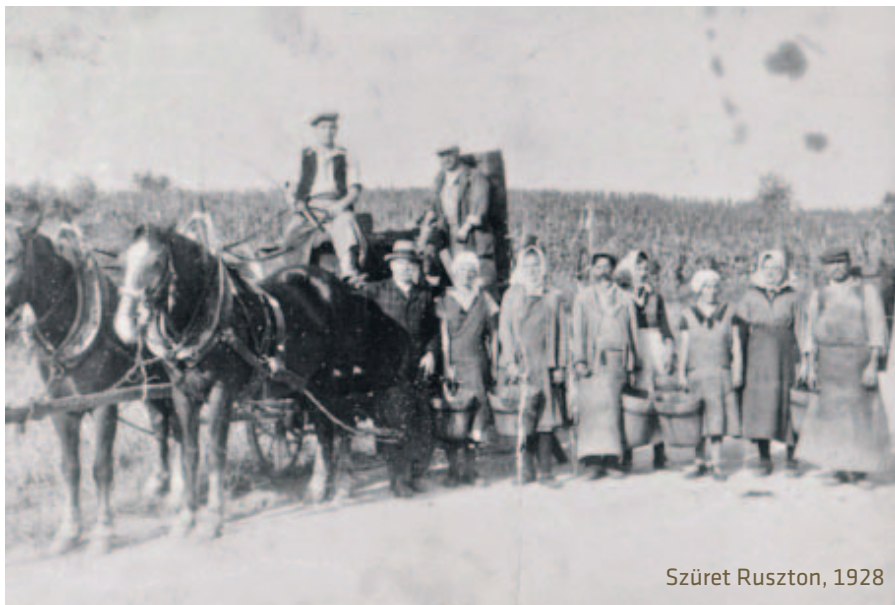
Szüret Ruszton, 1928

Elterjedt volt még a korán érő Augster (neve az augusztus szóból ered), a muskotályos, amelyet gyakran Weyrernek neveztek, továbbá a szintén korán érőnek számító Krämler és Gässler. A kevésbé értékes fajtákból, például az ezüstfehérből (Silberweiss) készült bort a tulajdonosok vagy a napszámosok fogyasztották. Vörösbort csak nagyon kis mennyiségben termeltek, elsősorban uradalmak és gazdag polgárok engedhették meg azt a luxust, hogy a kékszőlőt külön szüreteljék. Fűszerborokat kisebb mennyiségben, el-