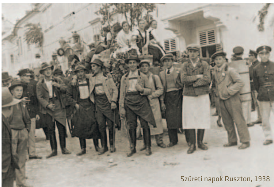
Szüreti napok Ruszton, 1938