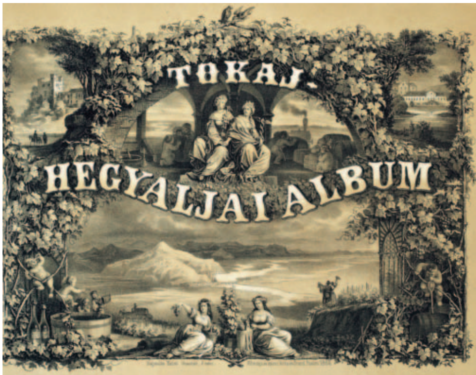
A Tokaj-hegyaljai album borítóképe, 1867. Szerkesztette dr. Szabó József akadémikus és Török István földbirtokos.

A Hegyalja szempontjából a birtokviszonyok jelentős átrendeződése következett az összeesküvés megtorlása miatt. A mozgalomban részes nemesek és polgárok egész sora veszítette el birtokát. A Rákóczi-család hegyaljai monopóliuma is megroppant, bár a legrosszabbat, a kivégzést vagy bört-