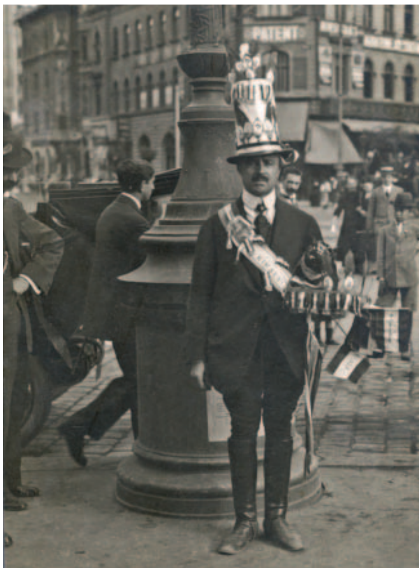
Háborús jelvényeket árusító férfi a Népszínház utca és a József körút sarkán, 1914. augusztus

Az, hogy a háború fokozottabban igénybe veszi a hátország támogatását és kitartását, nem volt eleve eltervezve. A küzdelmek rövid lefolyásával