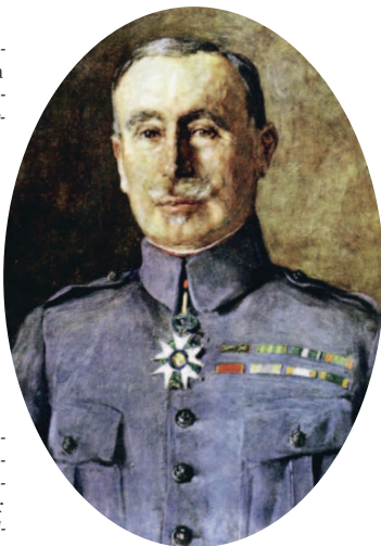
Robert Georges Nivelle tábornok

„zöld keresztet” harci gázzal intéztek támadást, s másnap a front keleti részén Souville és Tavannes felé nyomultak előre. A francia védelem megintgott, de a német támadás is kifulladás.