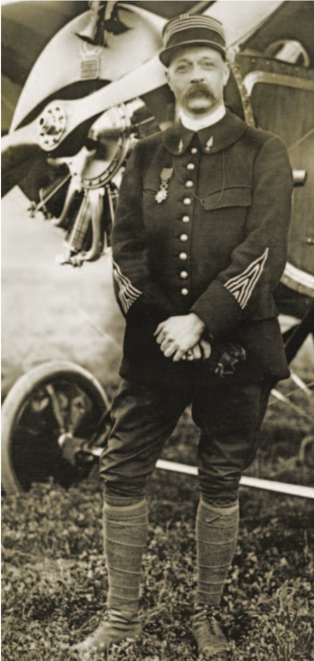
Charles de Tricornot de Rose, a francia pilóták parancsnoka

egy kocsi, s ha valamelyik elromlott, csak lelőttek róla, hogy ne akadályozza a többi. A Verdun a hátsózággal összekötő „fő ütőer” vagy „köldökzsinór” is legendává vált. Maurice Barrès az ókori római Via Sacra mintájára „Szent útnak” keresztelte el, s e néven került be a történelembe. A város természetesen alaposan megszenvedte az ostromot, lakói közül sokan elköltöztek, de az útnak köszönhetően Verdun kereskedelme semmit sem csökkent.