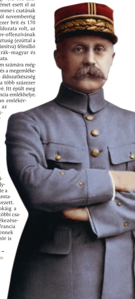
Philippe Pétaint tábornok