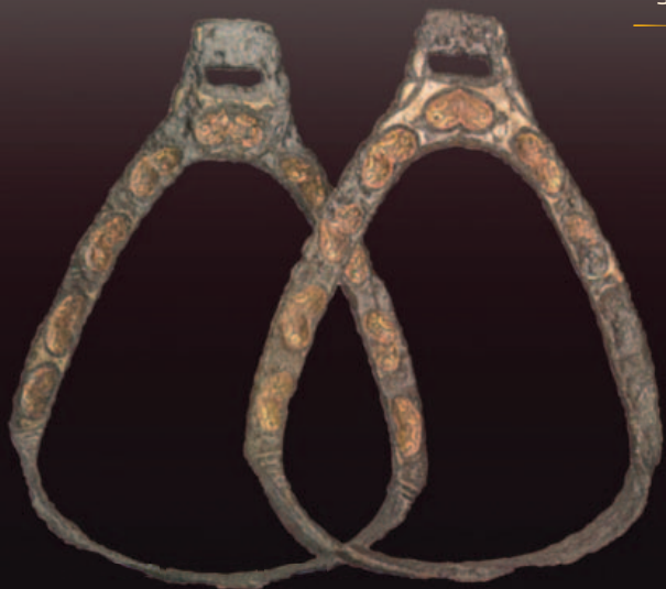
Honfoglalás kori kengyelek és zablák