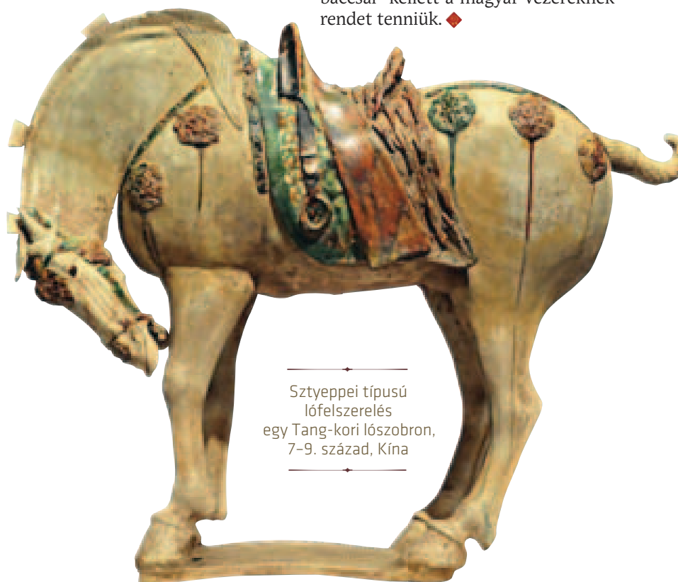
Sztyepei típusú lófelszerelés egy Tang-kori lószobron, 7-9. század, Kína

párhuzamok alapján akár a lovaglóstor végét is ékesíthették. Érdekes, hogy a lovaglóstor használatát a kalandozó hadjáratokról szóló korabeli írott források is alátámasztják: 954-ben Lobbes kolostorának és 955-ben Augsburg várának ostrománál is „korbáccsal” kellett a magyar vezéreknek rendet tenniük. ♦