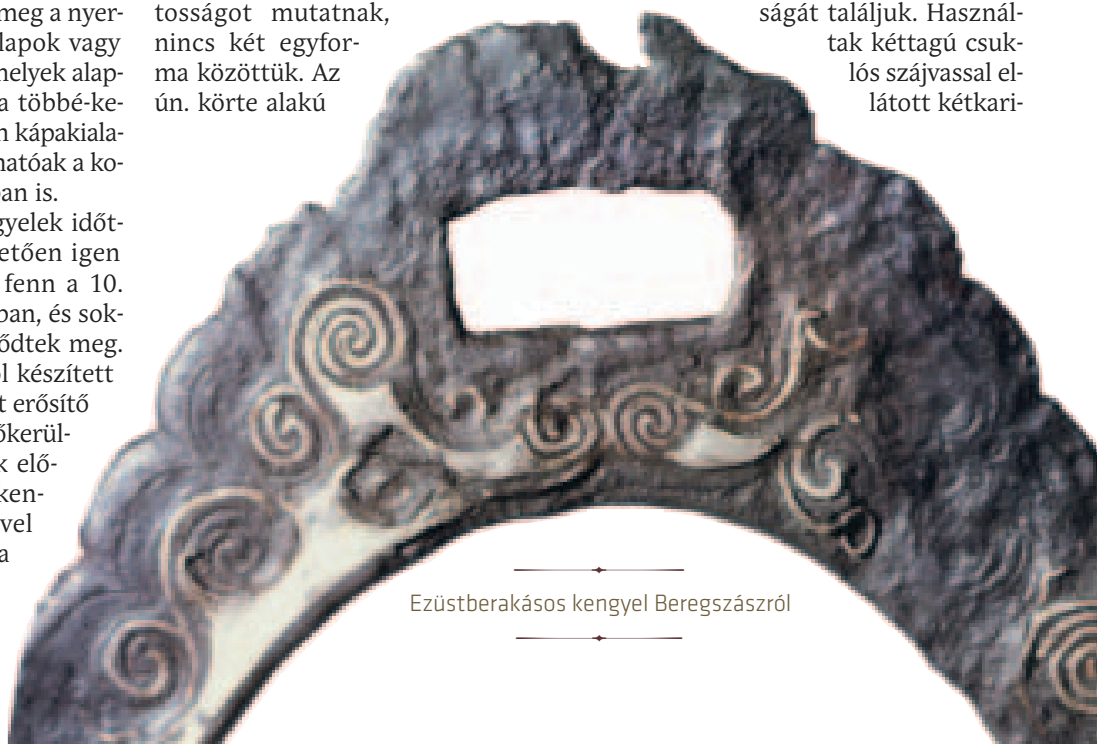
Ezüstberakásos kengyel Beregszászról

A lovas sírokban a kengyelek mellett rendszerint ott találjuk a zablákat is, lévén ezek is időálló vasból készültek, így nagy számban és gyakran jó állapotban maradtak meg. A 10. századi magyar leletanyagban a zablák igen nagy formai változatoságát találjuk. Használtak kéttágú csuklós szájjal ellátott kétkari-