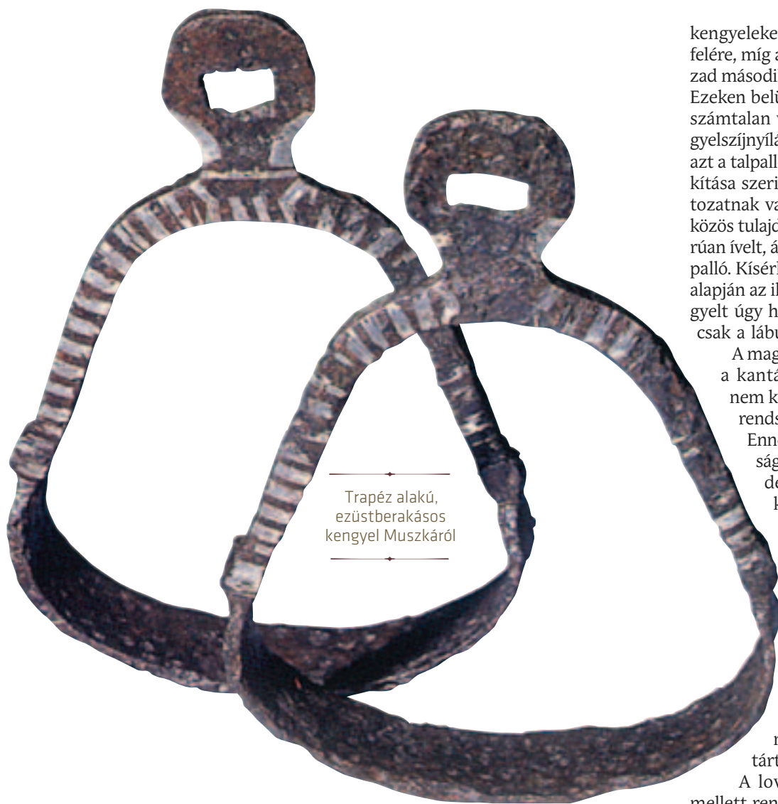
Trapéz alakú, ezüstberakásos kengyel Muszskáról

nyomtalanul elenyésztek, azonban a gyakran megtalálható kengyelpár és hevedercsat egyértelműen jelzi, hogy hajdanán a nyerges is a sírba helyezték. Csak kivételes esetben, igen gazdag temetkezésekben maradtak meg a nyerges díszítő faragott csontlapok vagy ötszögletes ezüstveretek, melyek alapján a nyeregkápák formája többé-kevésbé rekonstruálható. Ezen kápakialakítás párhuzamai megtalálhatóak a korabeli sztyeppi leletanyagban is.