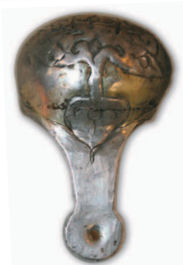
Válogatás az Urál nyugati oldalán, Baskíriában (Sztjerlitamak) és Tatárföld területén (Bolsije Tyigani) előkerült gazdag kora középkori (7–9. század) temetők azon leleteiből, amelyek a honfoglalás kori leletekkel mutatnak kapcsolatot.

még fontosabb lenne, volga–uráli eredetű leletek sem tűnnek fel. Sőt régészetileg jelenleg semmi jele annak, hogy a 6. századtól a 9. század elejéig a Volga keleti partjáról bármilyen népesség Európába költözött volna, aminek lehetőségét az írott források szerint a Kazár Kaganátus amúgy is eredményesen leszűkítette. Ezzel szemben a 9. század közepén lejátszódó vándorlás ma már egyértelműen kimutatható régészetileg is.