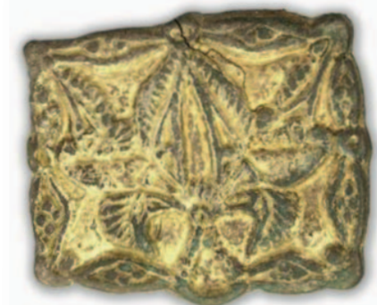
Válogatás az Urál keleti oldalán 2009-ben előkerült Ujelgi lelőhely azon leleteiből, amelyek a honfoglalás kori leletekkel mutatnak kapcsolatot.