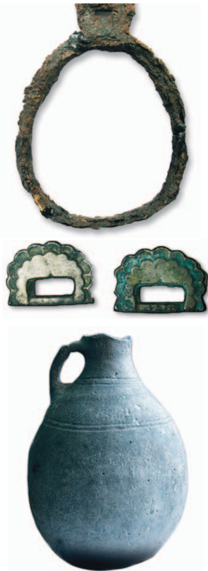
Válogatás a Dnyeszter középső folyásánál előkerült Szlobodzeja lelőhely 9. századi leleteiből, amelyek a honfoglalás kori, illetve a Dél-Urál/Volga-vidék hasonló korú leleteivel mutatnak kapcsolatot. Jelenleg Szlobodzeja a feltételezett etelközi szállások legnyugatibbi biztos lelőhelye.

Azt, hogy a magyarok mikor és főként miért keltek át a Volgán és költöztek nyugatra, ma még nem tudjuk. Véleményem szerint azonban joggal feltételezzük – miként később a besenyők esetében erről az írott források is beszámolnak –, hogy erre az eseményre nem kerülhetett sor a kazárok közreműködése, hozzájárulása, szövetsége nélkül. Okként a Dél-Urál előterében a 8–9. század fordulóján déli irányból feltűnő besenyő, míg keleti irányból a kimek (Szrosztinszkaja-kultúra) hatás tűnik valószínűnek. Időrendileg pedig a 9. század középső harmada jöhet szóba, melyet a Kelet-Európában feltűnő Volga–Dél-