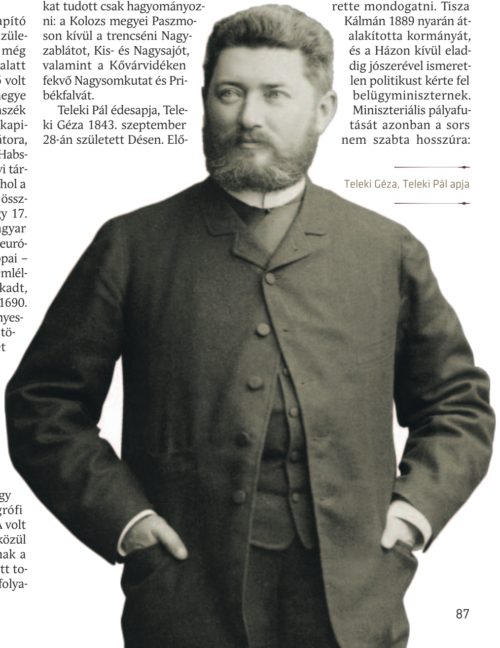
Teleki Géza, Teleki Pál apja

Kálmán 1889 nyarán átalakította kormányát, és a Házon kívül eladig jószerével ismeretlen politikust kérte fel belügyminiszternek. Miniszteriális pályafutását azonban a sors nem szabta hosszúra: