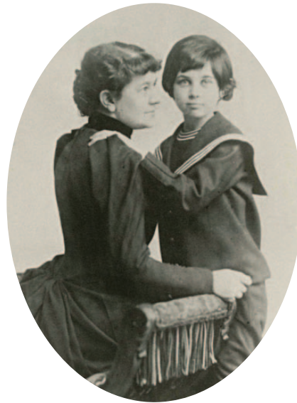
Teleki Pál édesanyjával 1890 körül