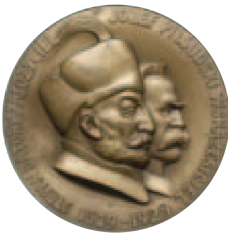
A vilnai Báthori István Egyetem újraindításának emlékére vert érem, 1929. A körfelirat: „Báthori István, az alapító, Józef Piłsudski, a feltámasztó. Középen az egyetem mottója: Innen jutunk el a csillagokhoz.”

Minél több probléma mutatkozott a Piłsudski-táborban, a kultusz annál inkább növekedett, főként azután, hogy a marsall, megfáradva, betegeskedve egyre inkább visszavonult a napi politikai életből. Végül a halála és a temetése adta a végső impulzust a kultusz kiteljesedéséhez.