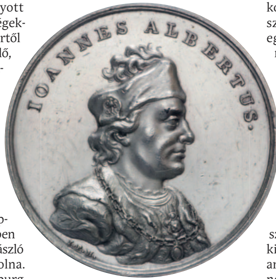
János Albert lengyel király

tak a megállapodással, ezért rábírták Corvint arra, hogy a királyi kincstárral és a Szent Koronával hagyja el a fővárost, talán éppen királlyá koronázása –