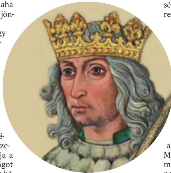
II. Ulászló, „Dobzse László”

Pest alá, de sem a cseh katonákkal megrakott város ostromát, sem a Dunán való átkelést nem kockáztatta meg, így a testvérével való eredmény-