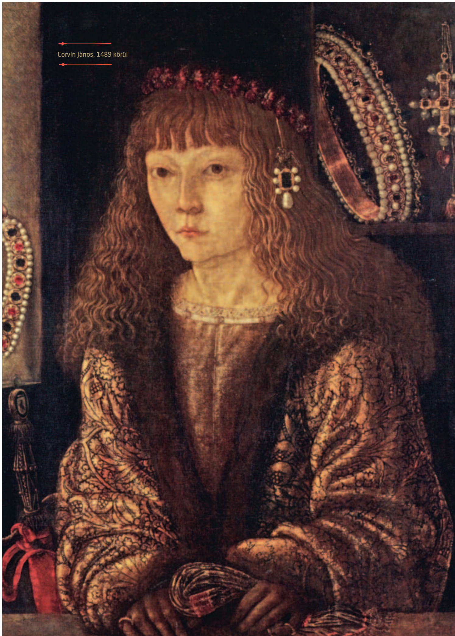
Corvin János, 1489 körül